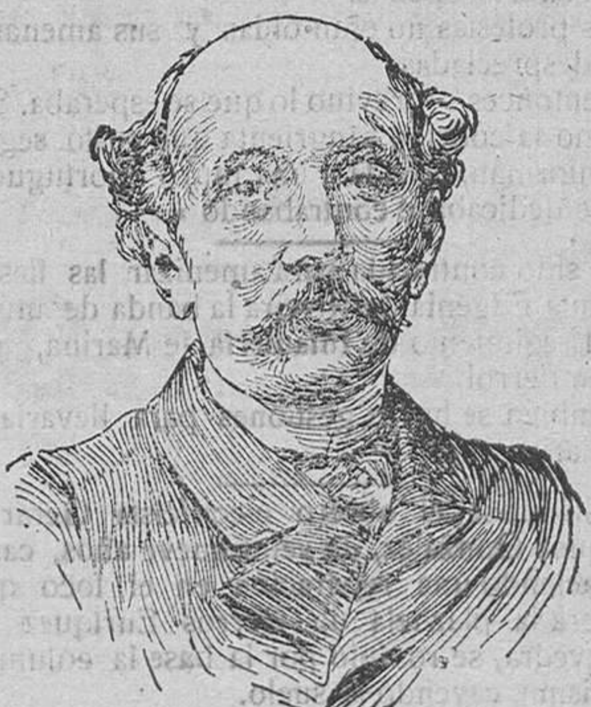
D. Eduardo Dato, presidente del nuevo Consejo de ministros.

La Acción «Era de esperar que, llegadas las cosas a la situación insostenible en que están; rota la disciplina en todos los organismos sociales; desviado el cauce de la vida nacional, esto que vemos todos, y que todos lamentamos, porque nos lleva a la catástrofe definitiva, fuera visto también