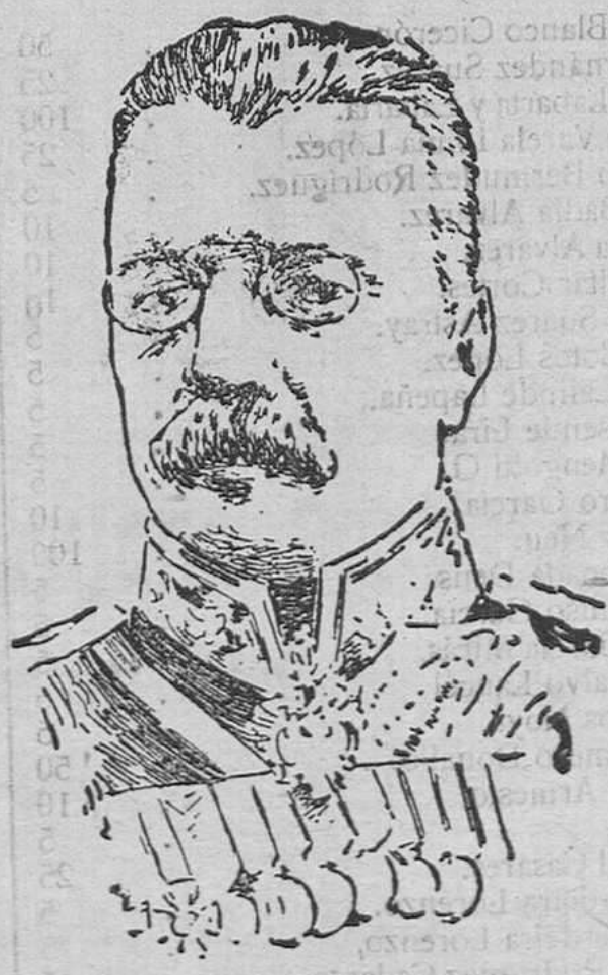
El general del ejército ruso Rousky, ayudante del Zar Nicolás que abdicó la corona.