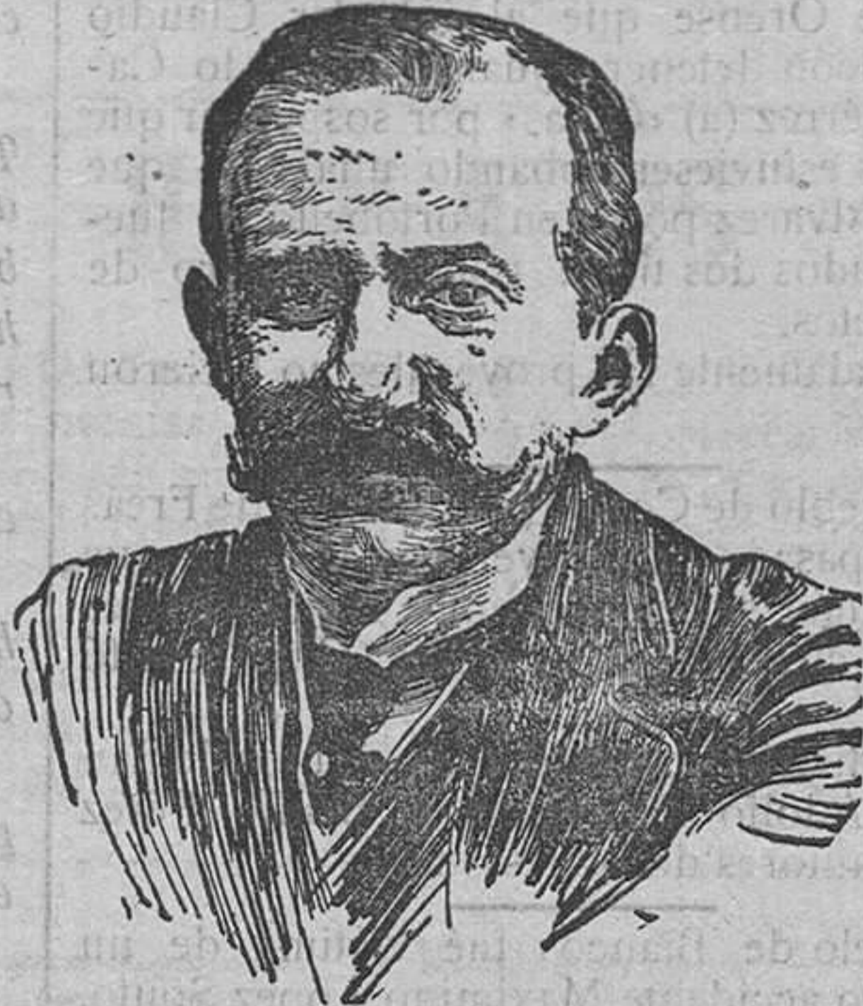
El conde de Romanones, Presidente del Consejo de Ministros a quien ayer ratificó los Poderes S. M. el Rey.