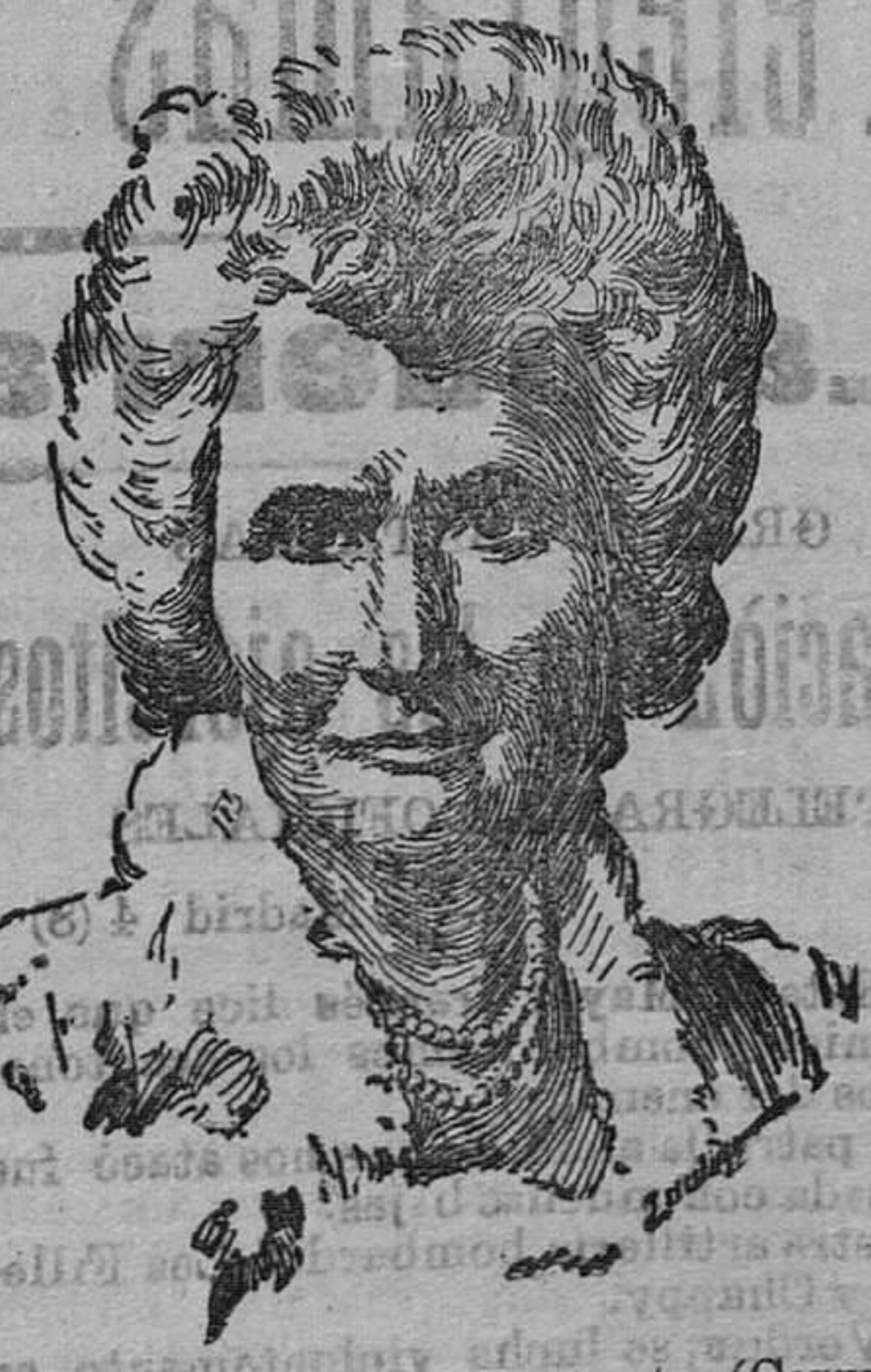
La Reina Isabel de Rumania (Carmen Sylva en el mundo de las letras) que falleció ayer en Bucarest.

—Esta Europa es una triste bochorno se feria, ¿cómo los hombres pueden consentir esto? Y no es que lo consienten, es que para sostenerlo y fomentarlos trabajan delinquentes, adulteros, defraudados, roban, pierden el honor y la vergüenza, que ya empezaron a perder al consentir que sus madres, sus hermanas, esposas, sus hijas, anden de esa manera. ¡Siquiera el árabe guarda el decoro de la mujer, con lo que guarda el propio!.