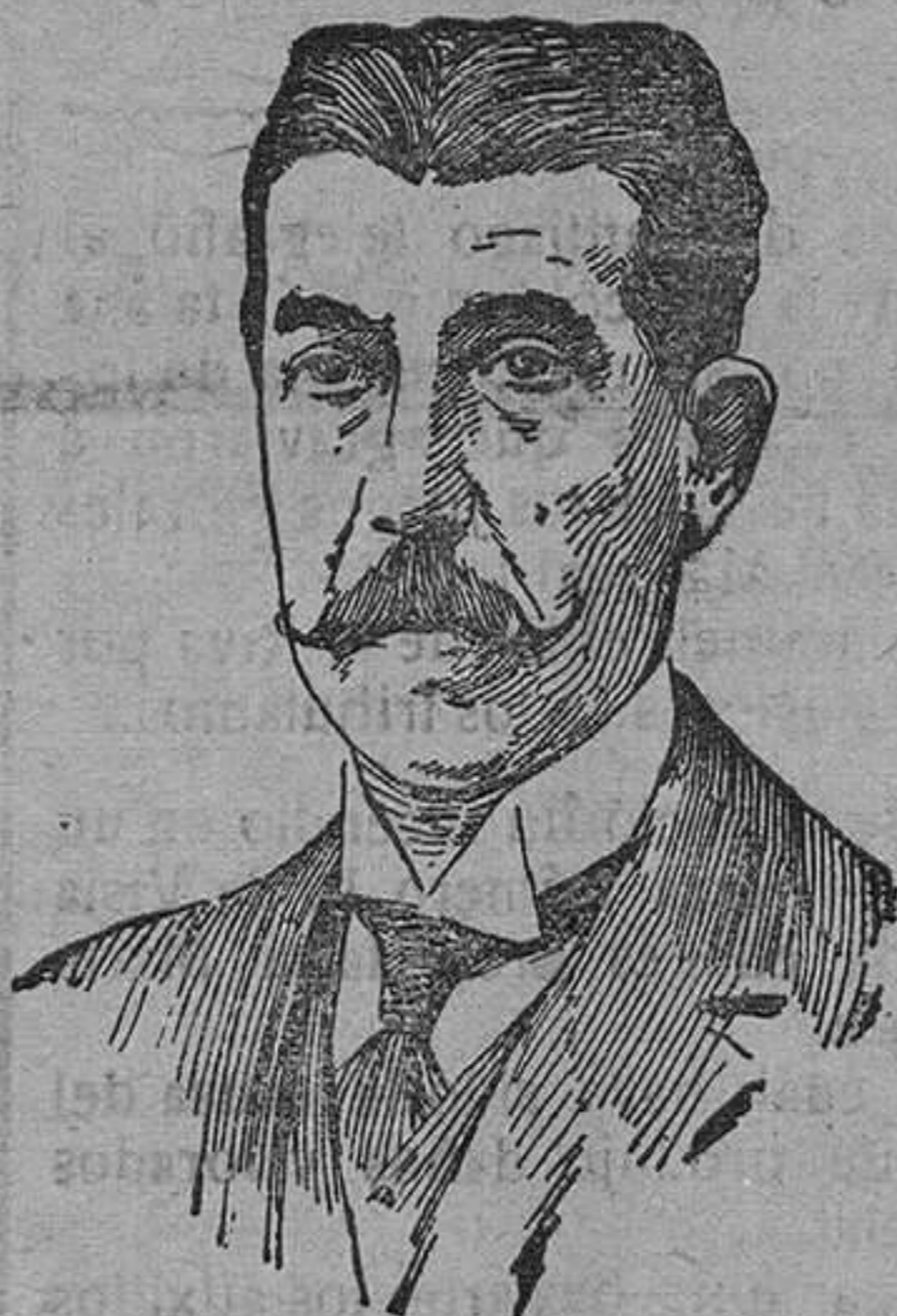
D. Francisco Bergamín, nuevo ministro de la Gobernación.