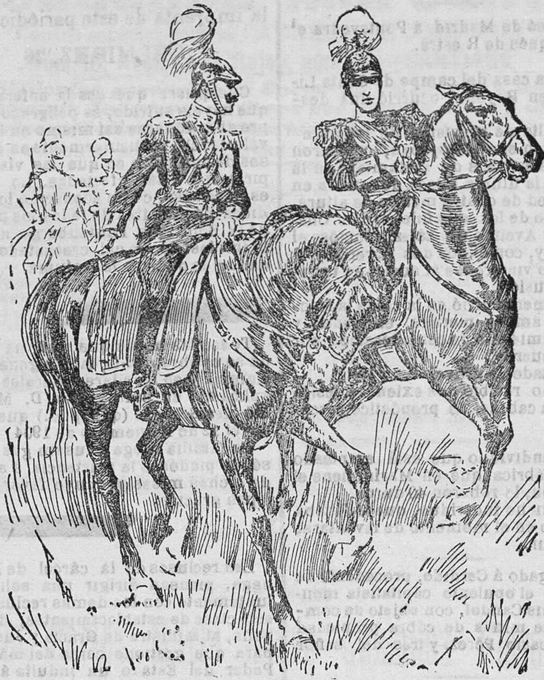
GUILLERMO II Y ALFONSO XIII PASANDO REVISTA AL EJÉRCITO ALEMÁN

Y no conviene perder el tiempo, porque acaso lo imprevisible, suprema fuerza que regula la política española, haga necesario y útil á la patria, al orden y á la monarquía nuestro común esfuerzo.»