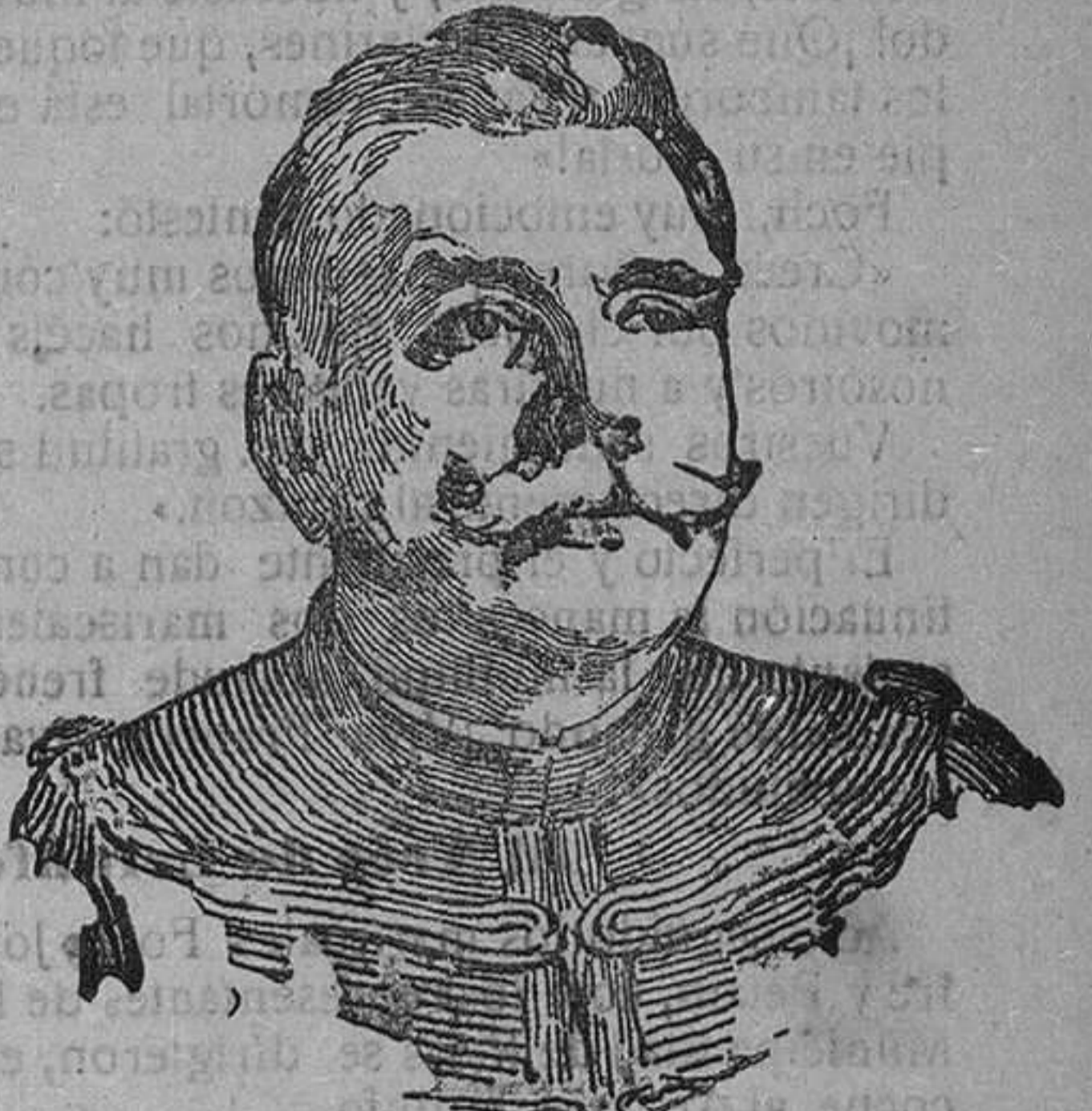
El Mariscal Joffre, generalissimo de los ejércitos aliados.

Entonces al Ayuntamiento de París se le ocurrió una idea... Instalar fábricas provisionales de luz a lo largo de la carrera, de doscientos en doscientos me-