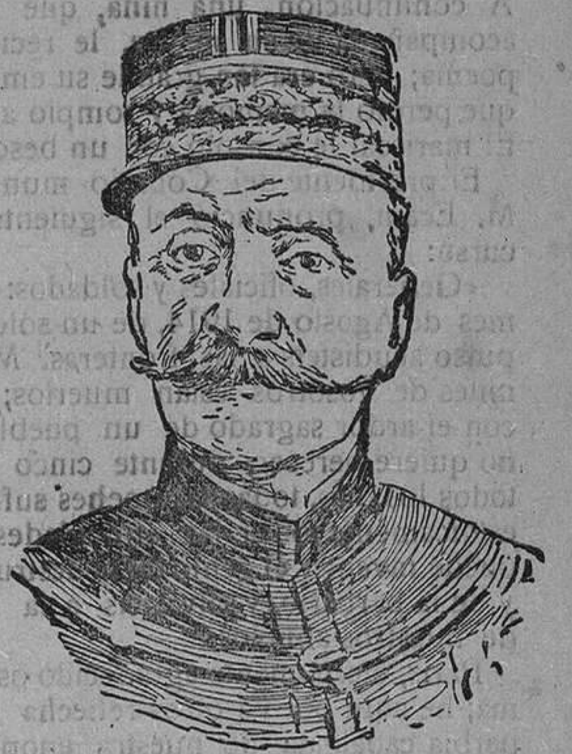
El Mariscal Foch, generalissimo de los ejércitos aliados.

Entre los kilómetros de tela y los kilómetros de banderas, aparecen los milla-