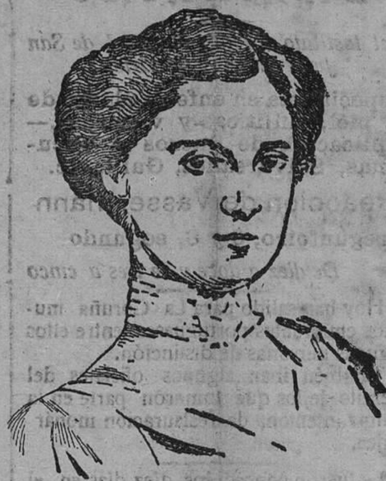
Zita de Borbón, exemperatriz de Austria-Hungría, que en unión de toda la familia imperial se ha internado en Suiza.