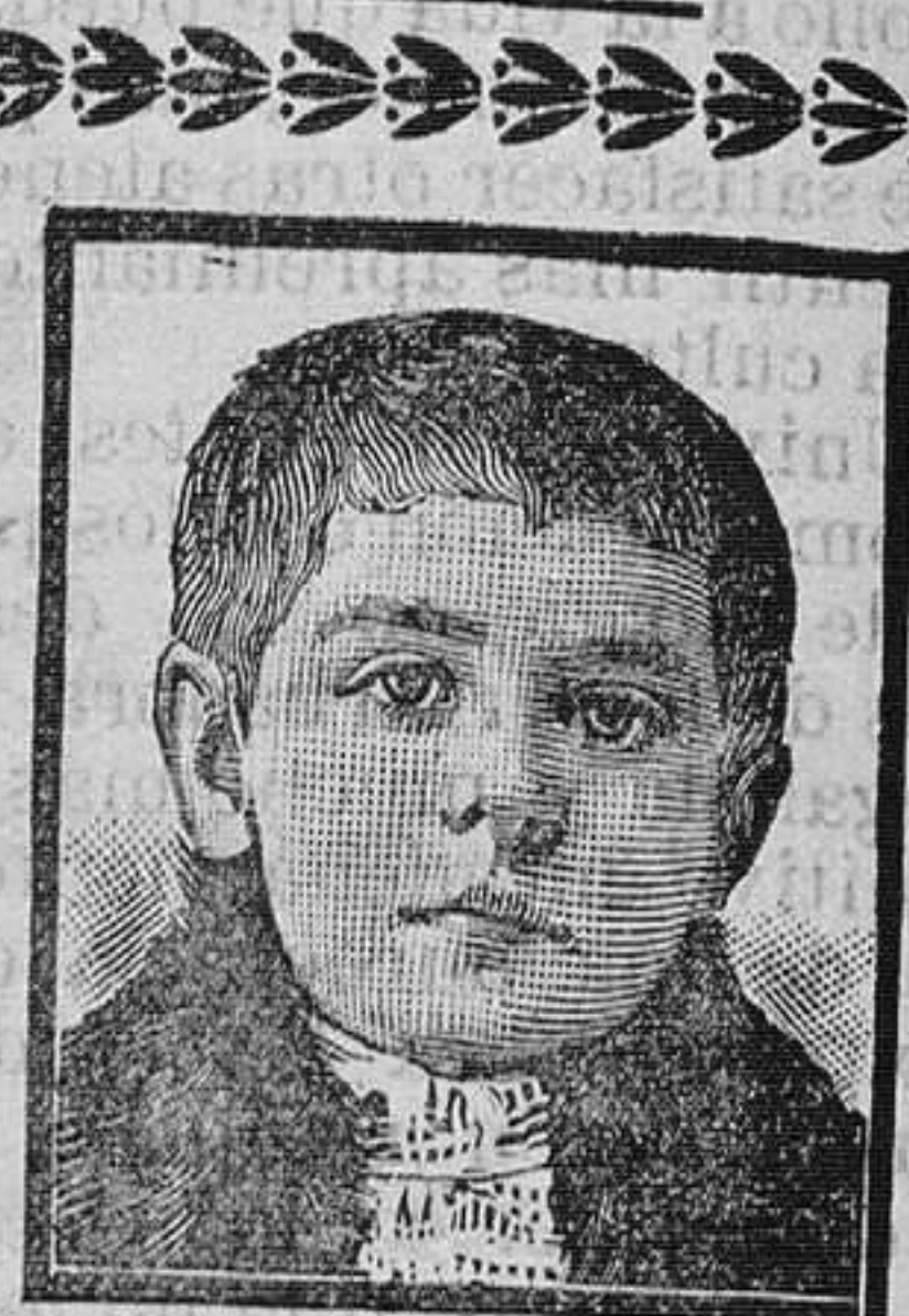
Peralta de Navarra, Enero 1908.

Tos y enfermedades del pecho lo mejor Pectoral Cardin. Cura siempre. En la Tosa Ferina resultados eficacísimos. Pídense a Bermejo y buenas Farmacias.