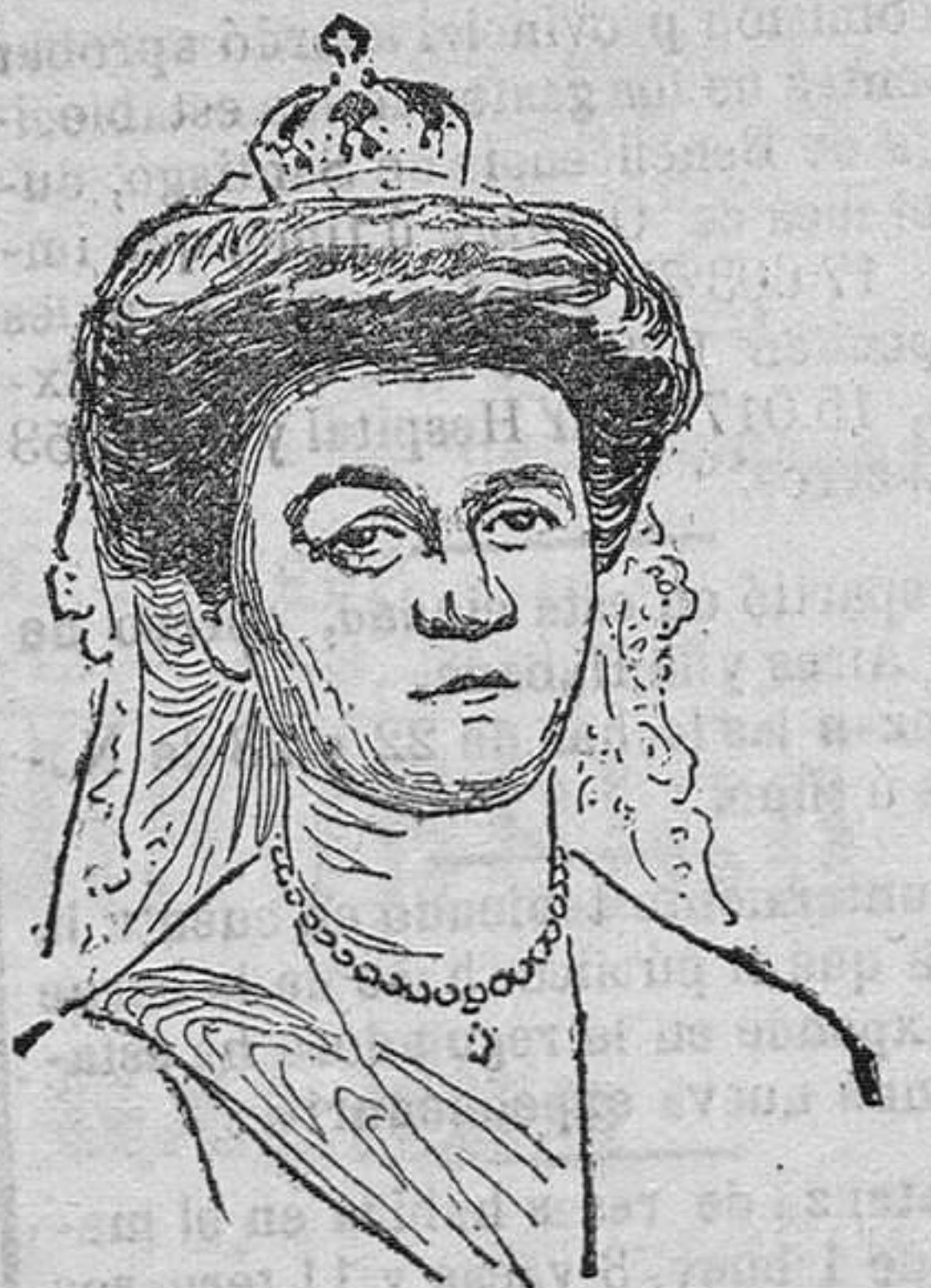
La czarina de Bulgaria

La victoria es más importante por ser doble. Fernando I ha tenido la habilidad de resolver el asunto de la independencia de Bulgaria al par que el del ferrocarril, como si fuera uno solo, ó derivación uno de otro, con lo cual ha logrado solucionar