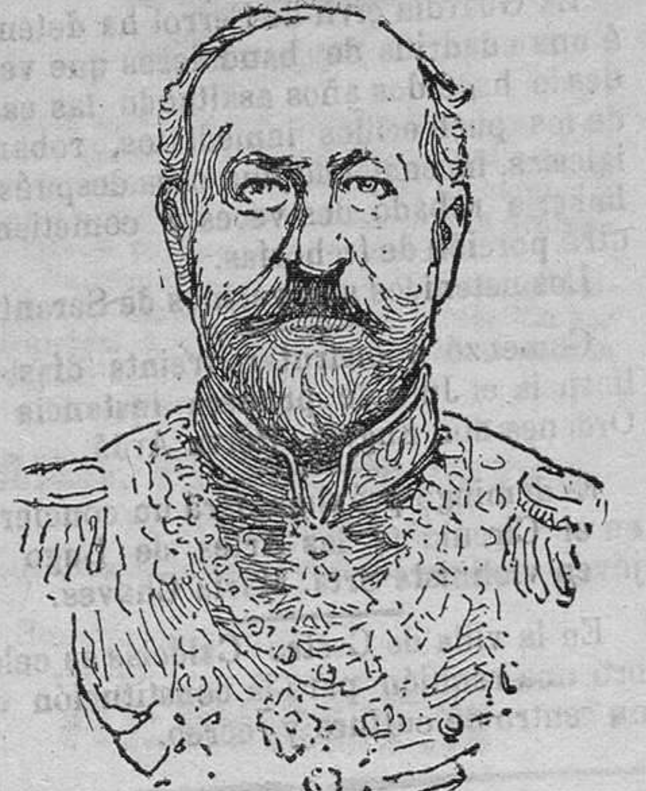
El czar Fernando I de Bulgaria

Entre los cientos y cientos de noticias alarmantes para la paz de los pueblos europeos y orientales, que un día y otro llegan hasta nosotros, ya de los pequeños Estados bálticos y Turquía, ya del Norte de Europa, encontramos hoy una, por rara excepción tranquilizadora, lisonjera y que á estas horas será objeto de generales regocijos en uno de esos países de reducido territorio á que más arriba hemos aludido. La noticia en cuestión es otra que la del próximo reconocimiento de la Independencia Bulgaria por Turquía.