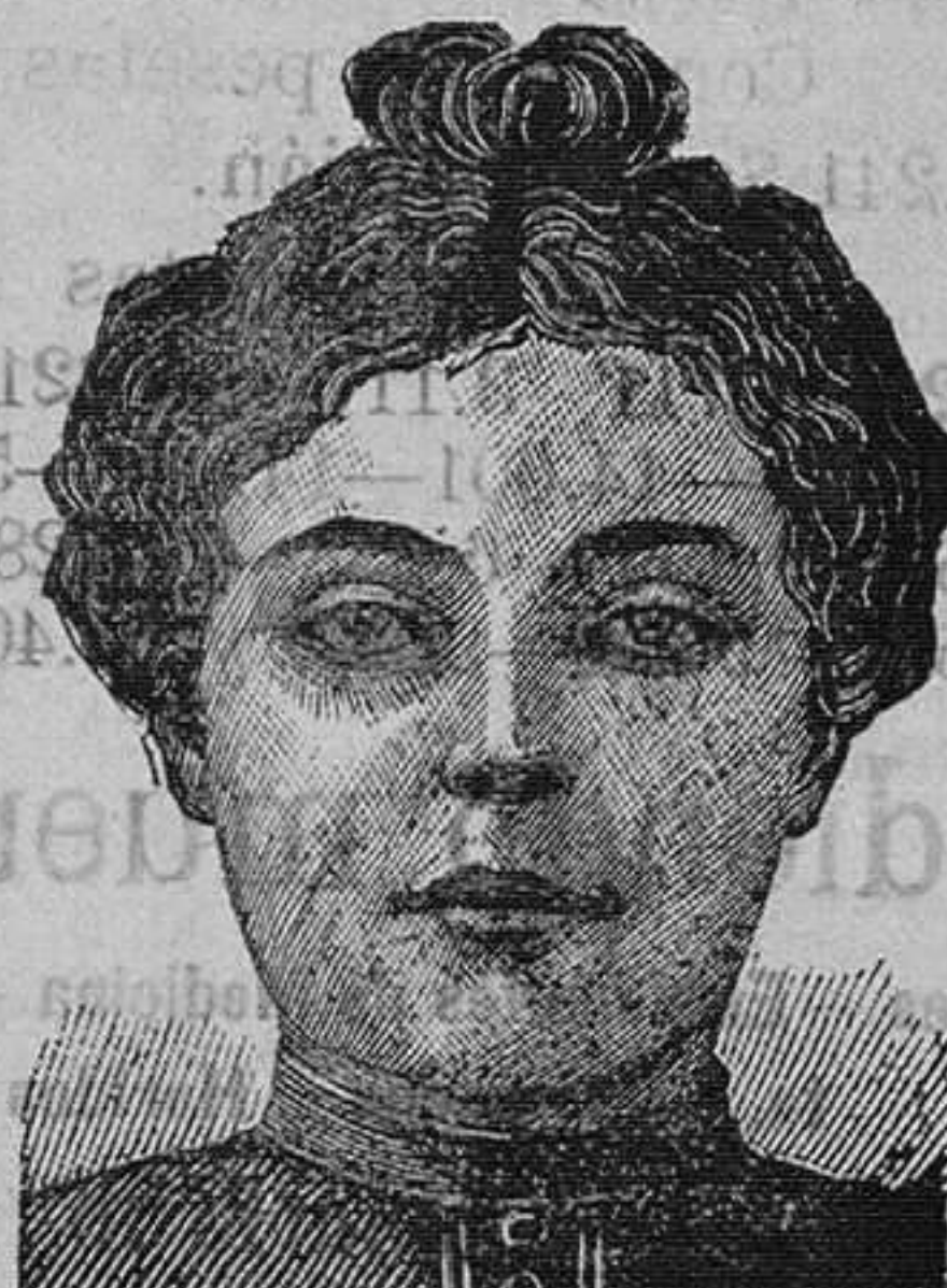
Después de 15 días de tratamiento

Hemos señalado á los lectores de este periódico el descubrimiento en lo que toca á las enfermedades de la piel. Aquí la lista de estas enfermedades que han sido curadas, después de algunos días por este tratamiento maravilloso: Eeema, herpes, impetigos, acnes, sarpullidos, prurigos, rojeces, sarpullidos tarindicos, sycoses de la barba, comezones, varices, llagas varicosas y eczemas varicosas de las piernas, enfermedades sifilíticas.