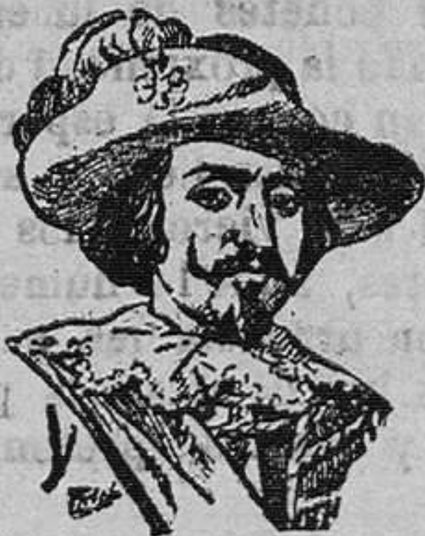
DON FADRIQUE DE TOLEDO

En 1629 hizo una expedición a las Antillas asoladas por filibusteros y bucaneros, y en ellas conquistó inmarchitables laureles, pues en menos de un año acabó con los enemigos y restableció el orden.