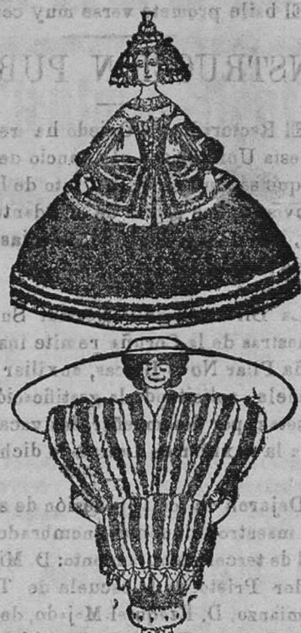
Lo que va de ayer a hoy.