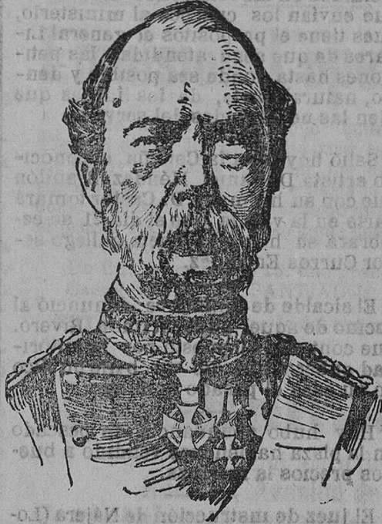
CHRISTIAN IX DE DINAMARCA

nada y metódica, tan sencilla y familiar, que no se altera ni cambia por cualquier acontecimiento que surja.