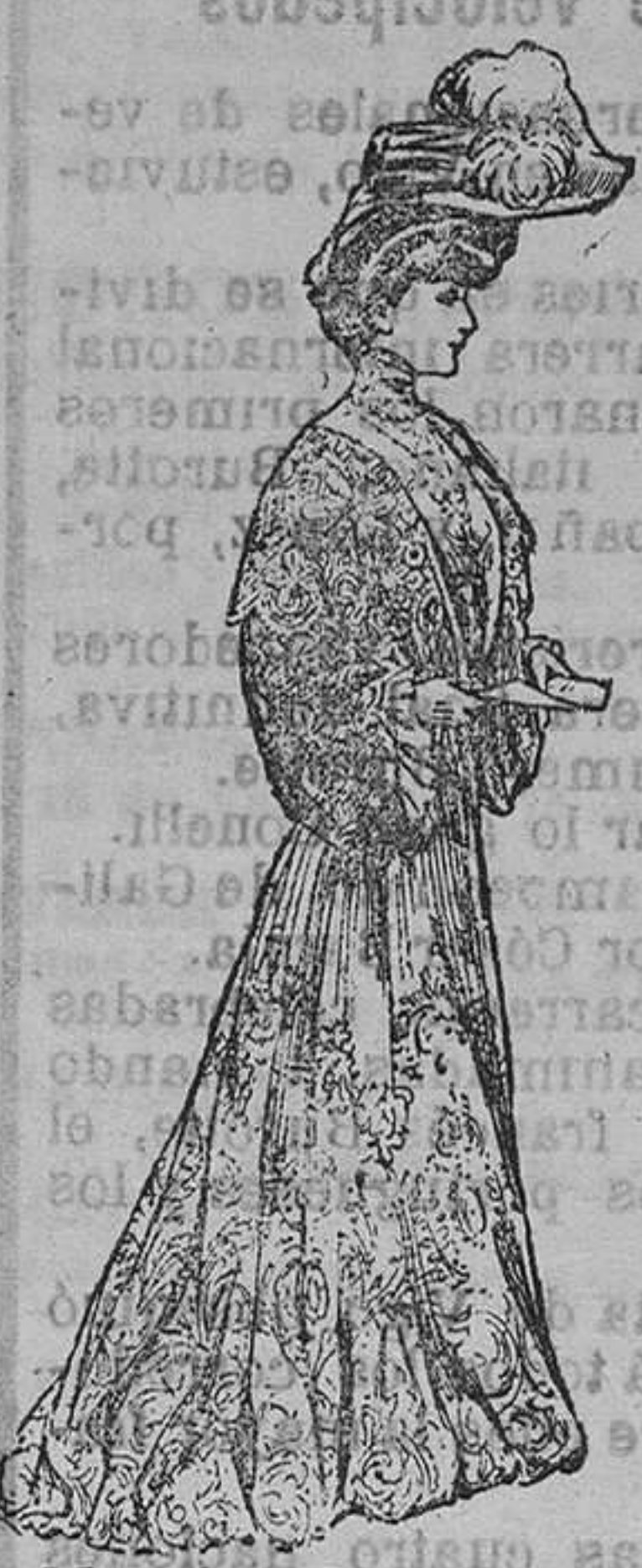
Mantelota de gupure.