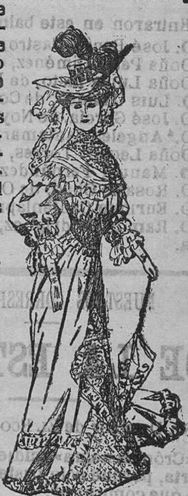
Toilette de paseo.