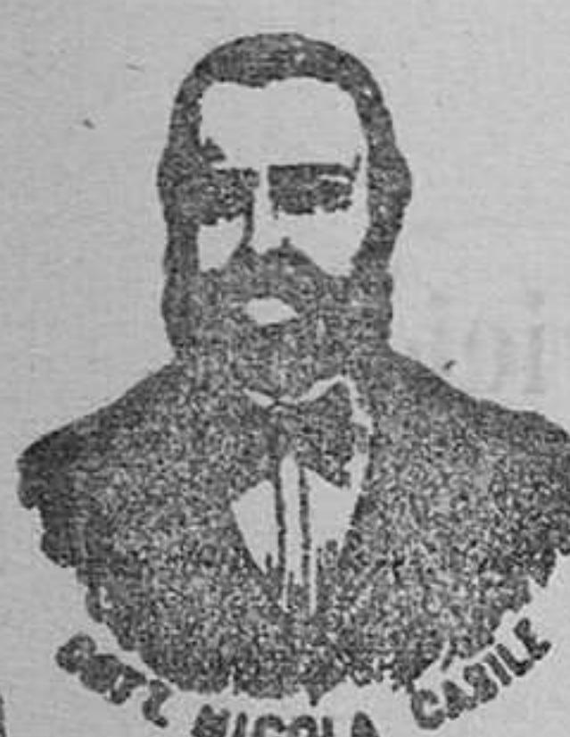
Dr. NICOLA CASILE Inventor de los renombrados medicamentos CASILE

han logrado el doctor Casile, descubriera los milagrosos medicamentos que curan infaliblemente la tisis en cualquiera de sus periodos y todas las enfermedades del estómago. A la más pequeña manifestación de un resfriado, tos, catarro, bronquitis, tiple, asma (sufocación), espectoración y de cualquier enfermedad del pecho, tomar inmediatamente las Perlas se asile , que no solo curan infaliblemente estas enfermedades, sino que segurando la completa seguridad de no contraer otras mucho más graves, siguiendo este método se podrá decir no más tisis . Si por desuido no se hubiera seguido este tratamiento, y por desgracia cualquier persona se encontrara atacada de tisis , no tiene que apurarse, porque gracias a los constantes estudios, hemos podido encontrar los renombrados Conf. tisis se asile , que asociados a las Perlas combaten con eficacia la tisis en cualquiera de sus periodos.