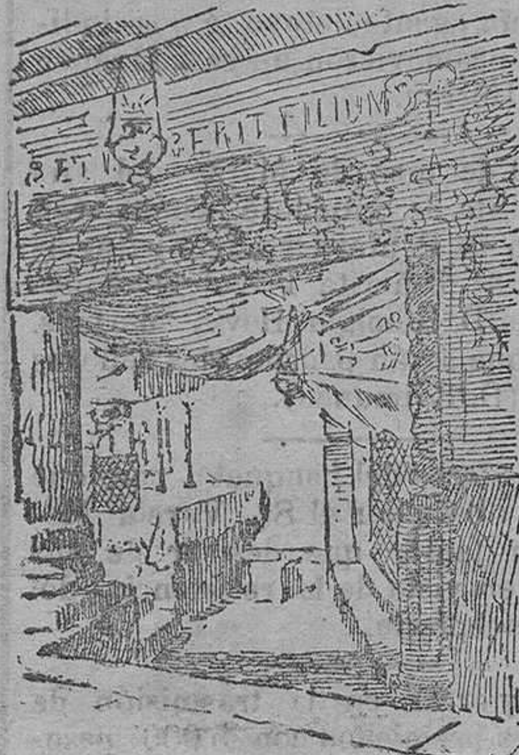
Nicho del Pesebre.

Pequeñas ventanas, muy escasas, aparecen en lo alto extrañando sobre manera no ver ninguna puerta. Sin embargo siguiendo con la vista a algunas personas se observa que llegan al muro, se inclinan hasta casi poner las manos en el suelo y desaparecen tras una especie de mancha negra que presenta el muro.