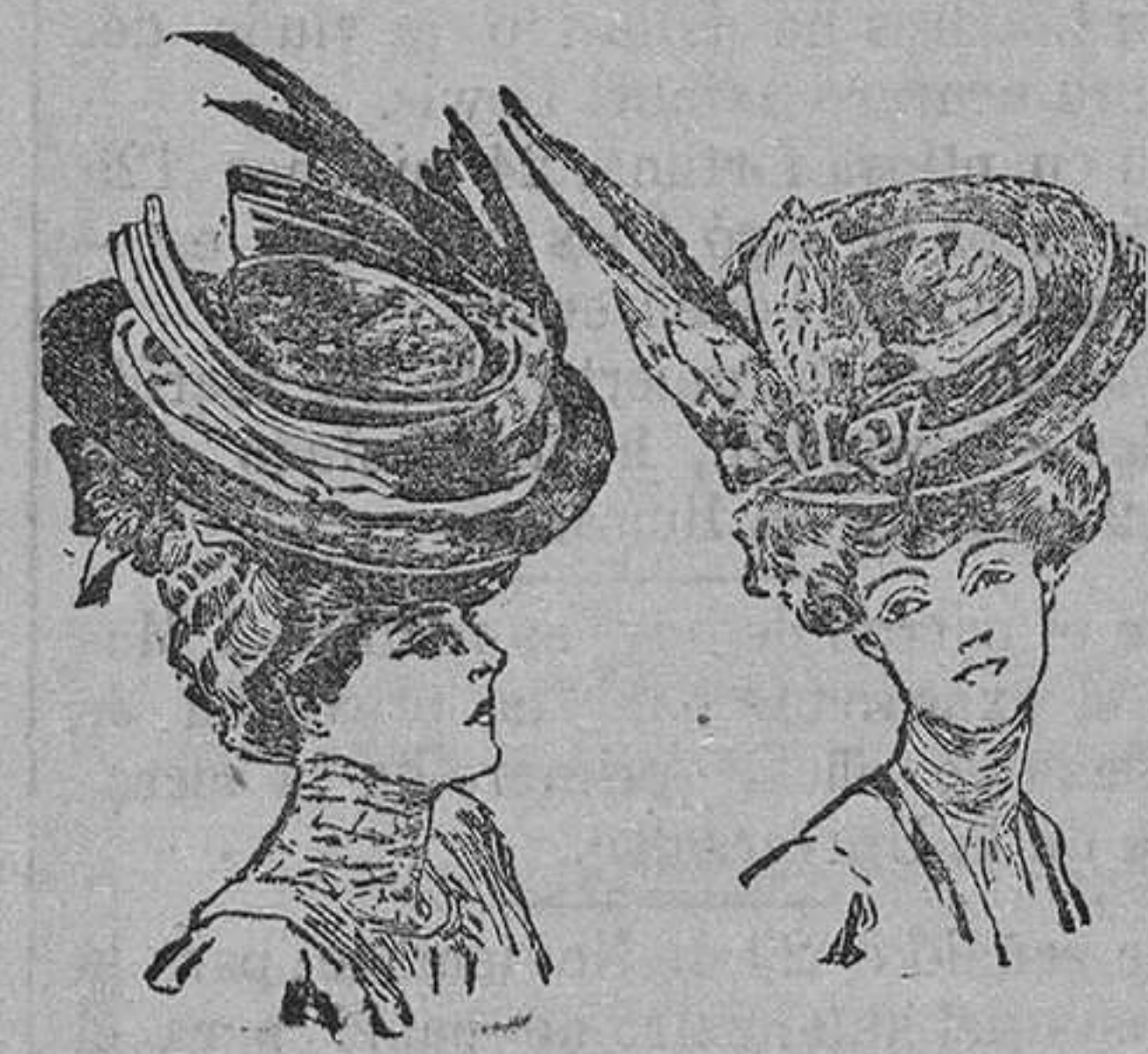
Una preciosa forma es la que se deno-

Lo que decimos de estos sombreros es aplicable también á los de terciopelo. Este tejido se presta igualmente á hacer con él nudos, reemplazando con estos adornos las flores, que parecían insustituibles.