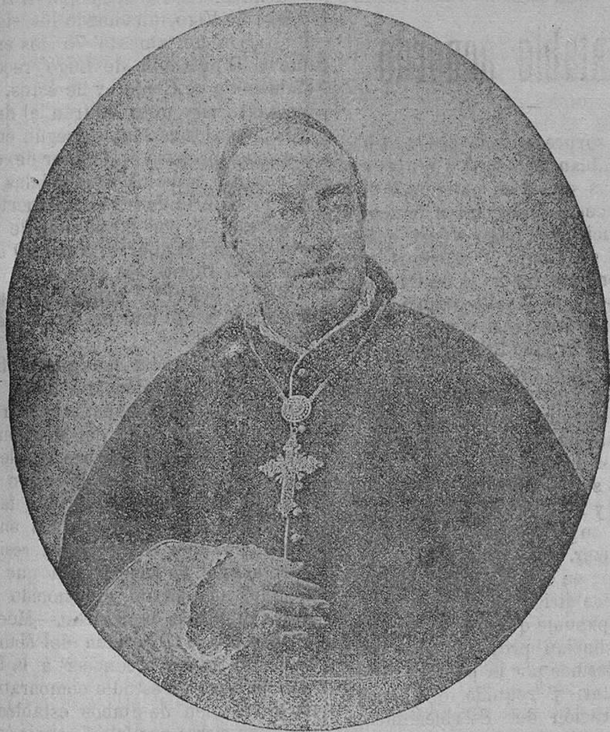
Emmo. Sr. Cardenal Arzobispo Consagrante.

Pústrase el electo y los demás se arro- dillan y entónanse las Letanías de todos