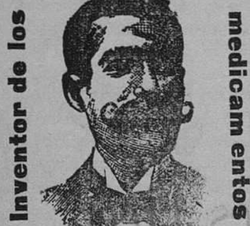
Inventor de los medicamentos

para Est las Uretrales Uretritis-Prostatitis-Cistitis Catarros de la Vejiga