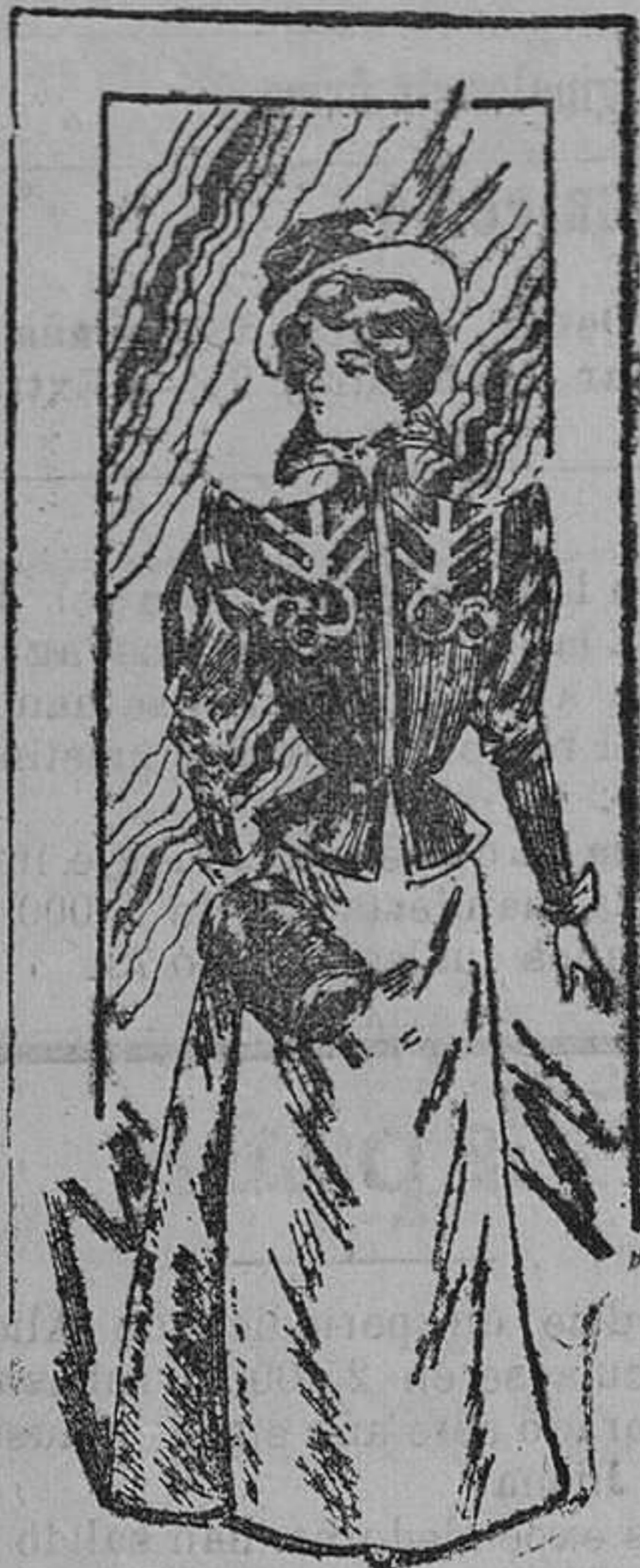
Chaqueta-blusa para señora

Modelos exclusivos para nuestras lectoras, de los grandes almacenes de EL SIGLO, Barcelona.