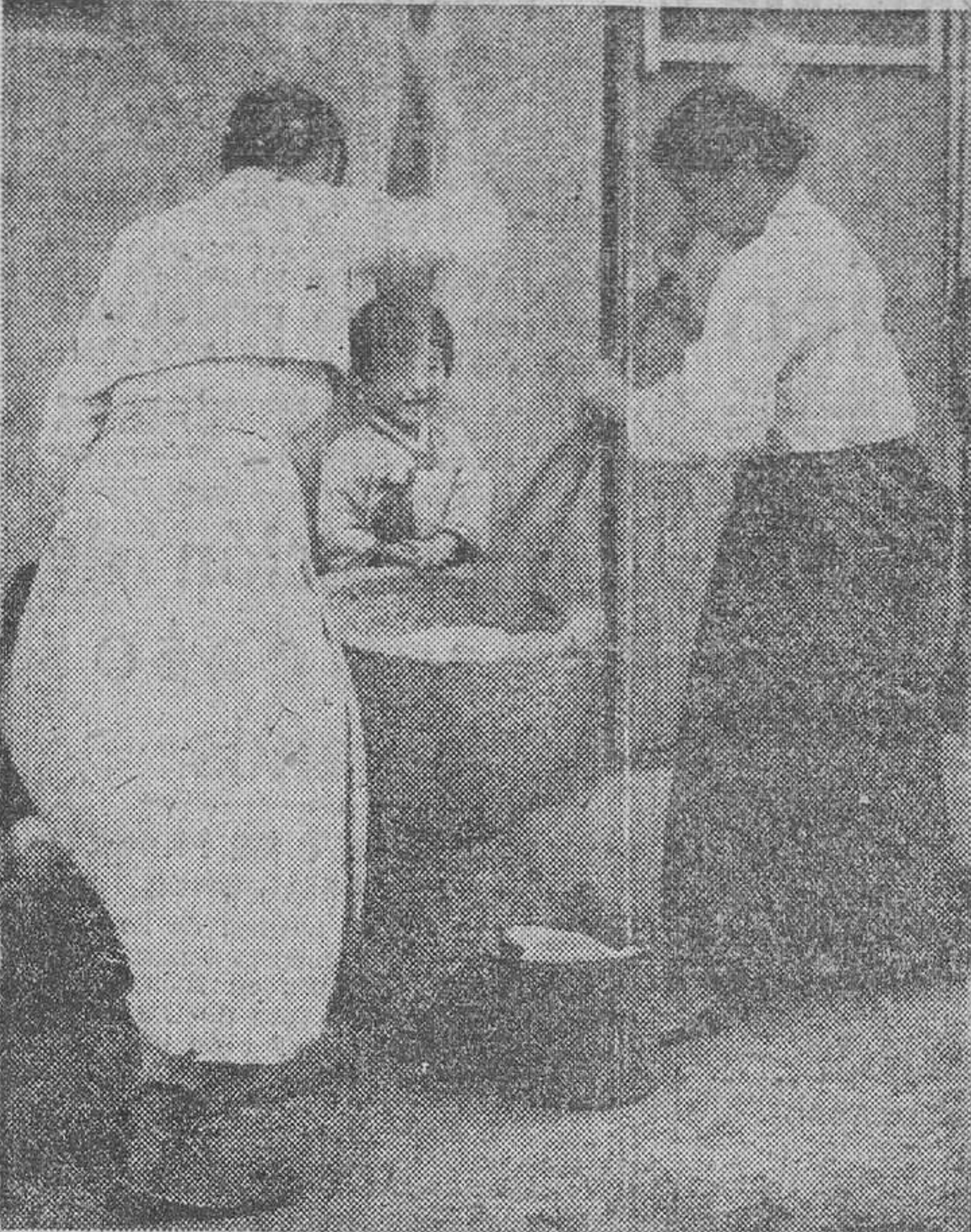
FUSAN.—Amas de casa coreanas muelen el arroz que les ha proporcionado el Mando de la Asistencia Civil de las Naciones Unidas.