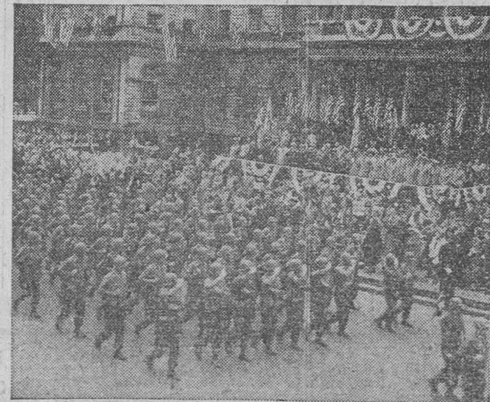
Soldados de la IV División de Infantería norteamericana desfilan por las calles de Nueva York antes de trasladarse a Europa para reforzar los efectivos militares del Pacto del Atlántico.