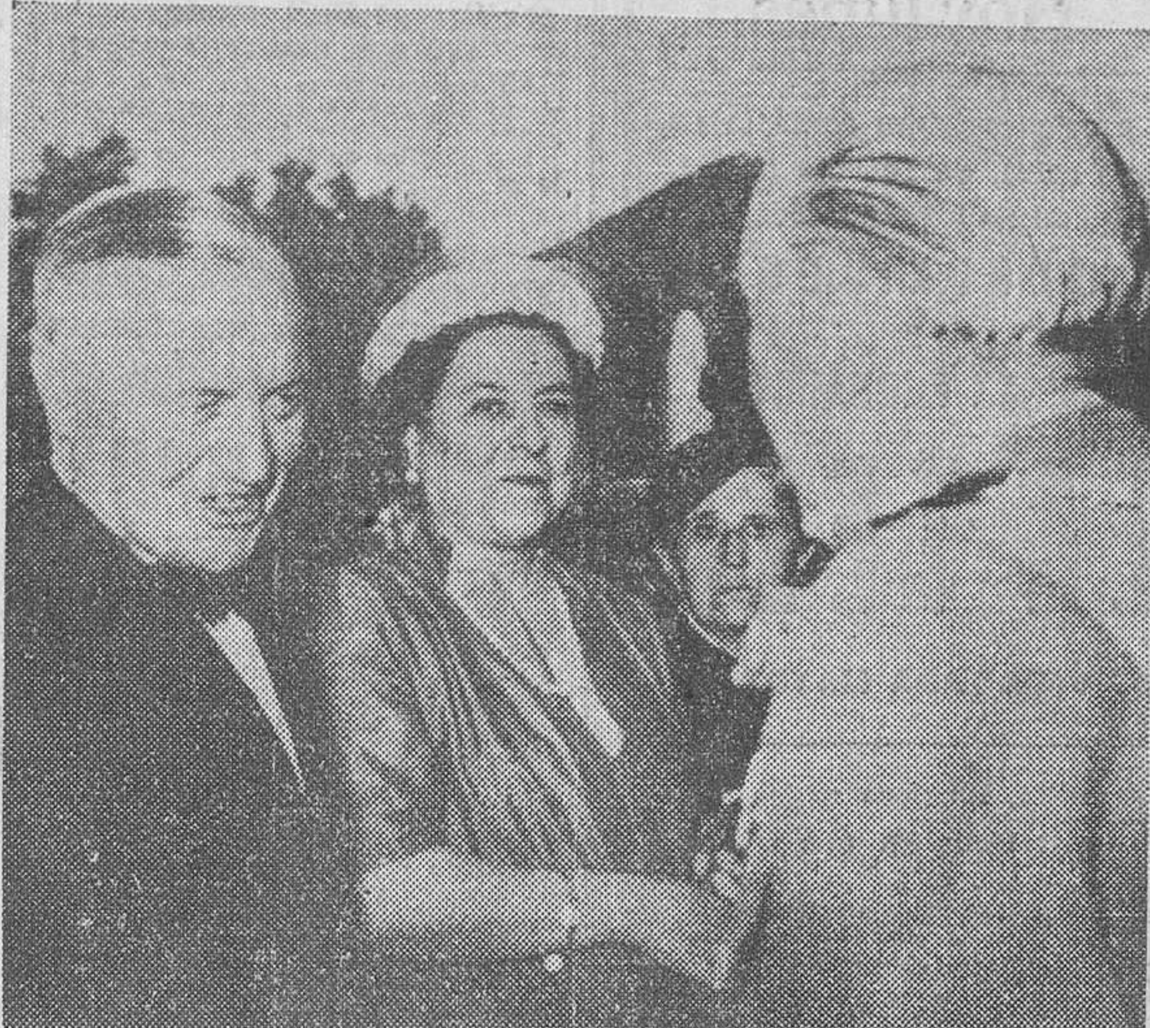
He aquí una fotografía de valor histórico y de palpante actualidad. El almirante Sherman, acompañado de su esposa, saluda al Generalísimo Franco en la fiesta celebrada en los jardines de La Granja el pasado día 18 de julio, después de la conferencia sostenida entre el almirante norteamericano y el Jefe del Estado español.