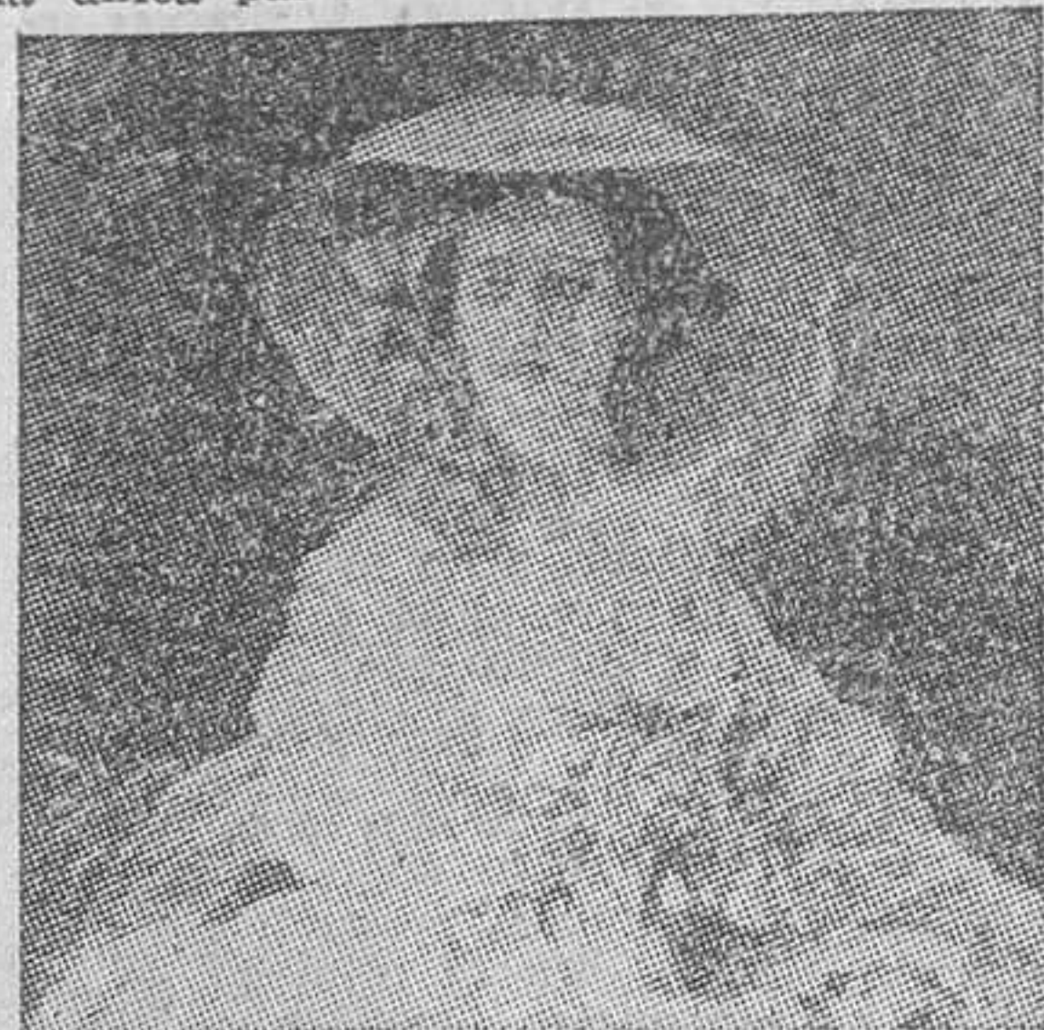
La emperatriz Eugenia que presidió la inauguración del Canal de Suez en 1869.

El incidente ocurrido con el barco británico «Empire-Roach», en el Mar Rojo, centra la atención sobre el Oriente Medio turbado ya por tantos otros incidentes. En todos ellos, parece que Gran Bretaña es la única parte litigiosa entre los occiden-