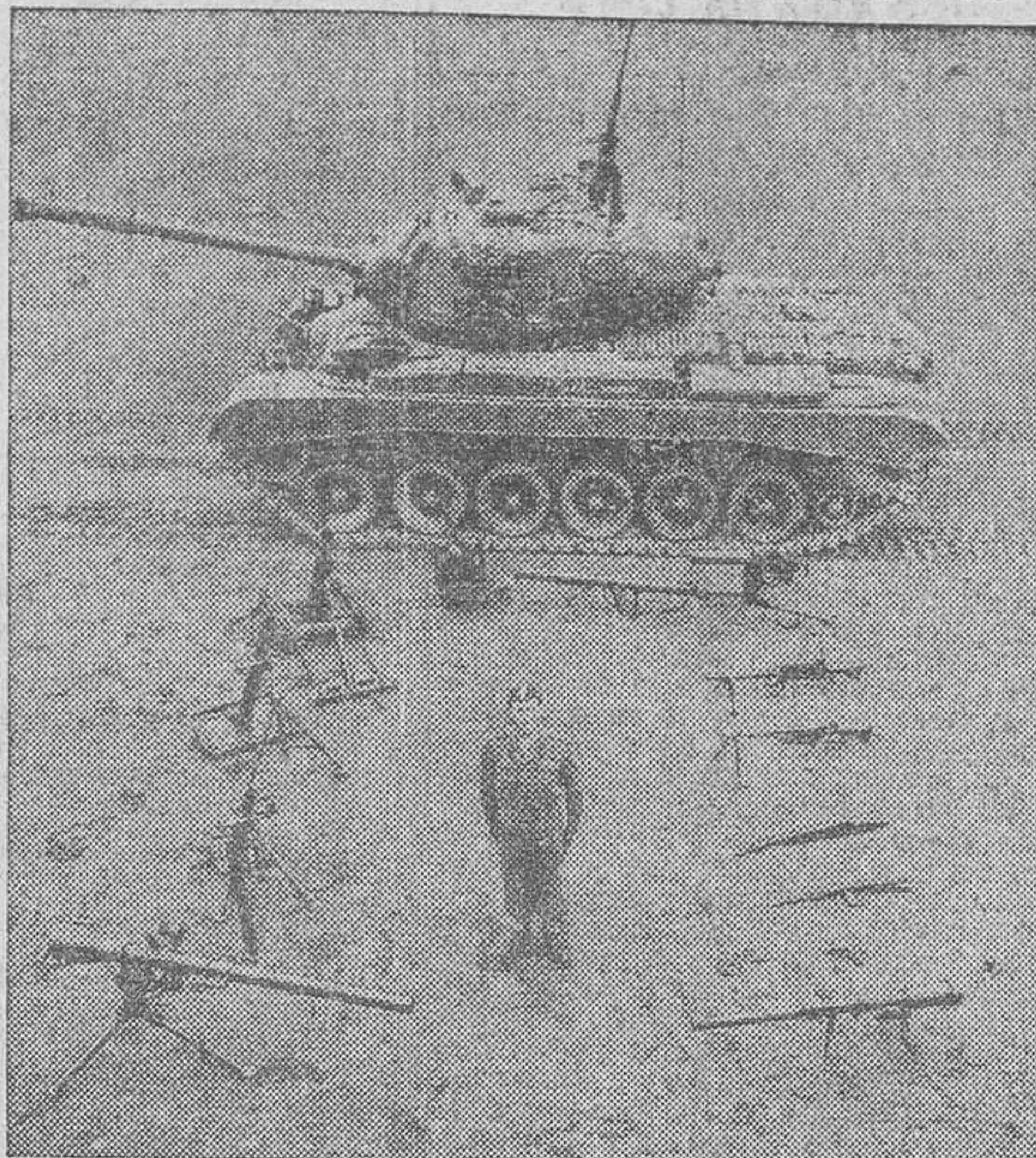
En la Academia de Infantería de Fort Benning (Estados Unidos) estudian militares de numerosas naciones. En esta fotografía aparecen las armas utilizadas por las tropas norteamericanas de Infantería.