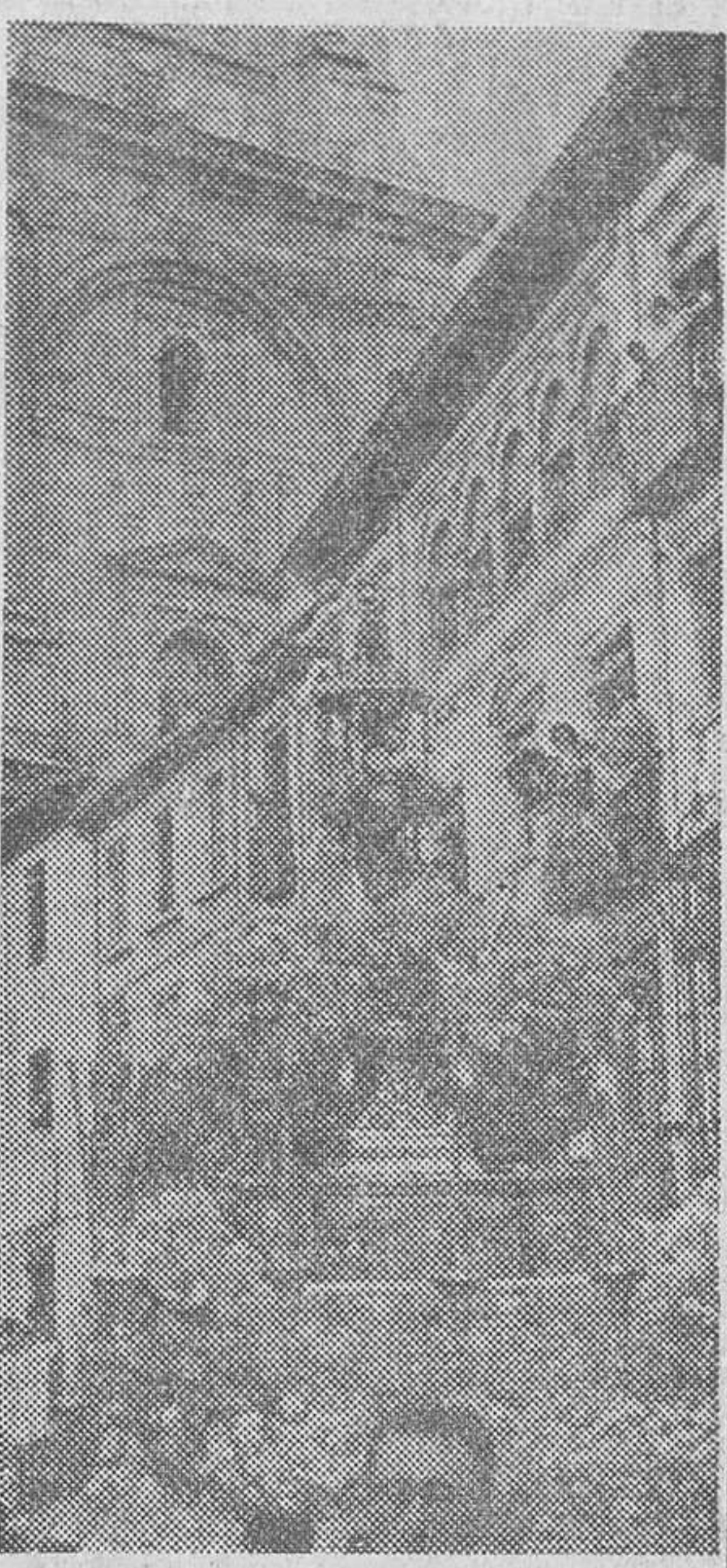
La Custodia con el Santísimo Sacramento, al paso por la Plaza de las Pasiegas.

El tercer día, «Excmo. Ayuntamiento», con copa del organismo y 10.850 pesetas (Pasa a la página 2)