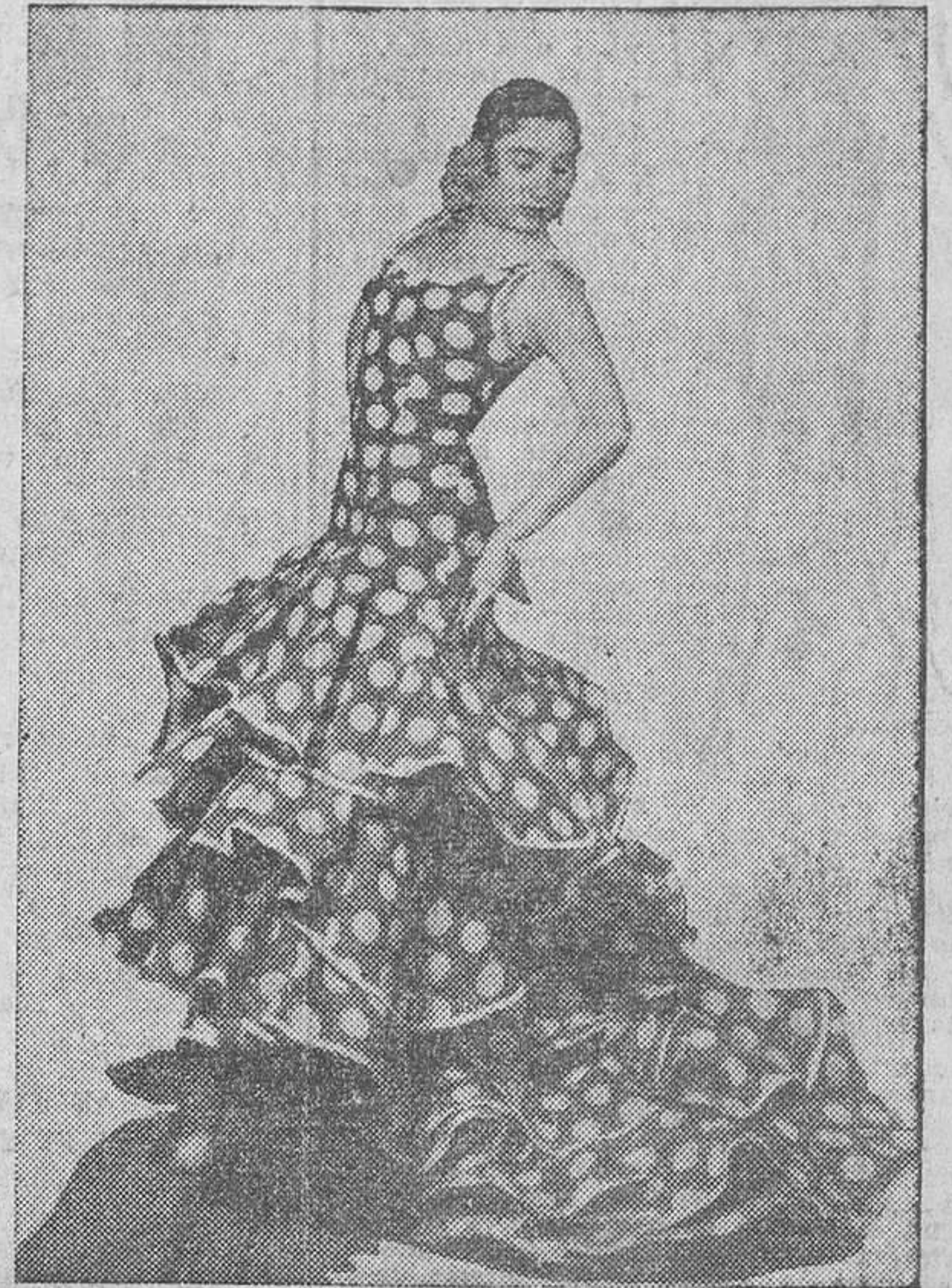
La genial bailarina Pilar López, que, con su grandioso «ballet» español, actuará en Carlos V el jueves y viernes próximos.

A la grandiosa ópera de Verdi, seguirá en la noche del 30, la del maestro Puccini, «Tosca», que tendrá también lucida interpretación por la Compañía italiana