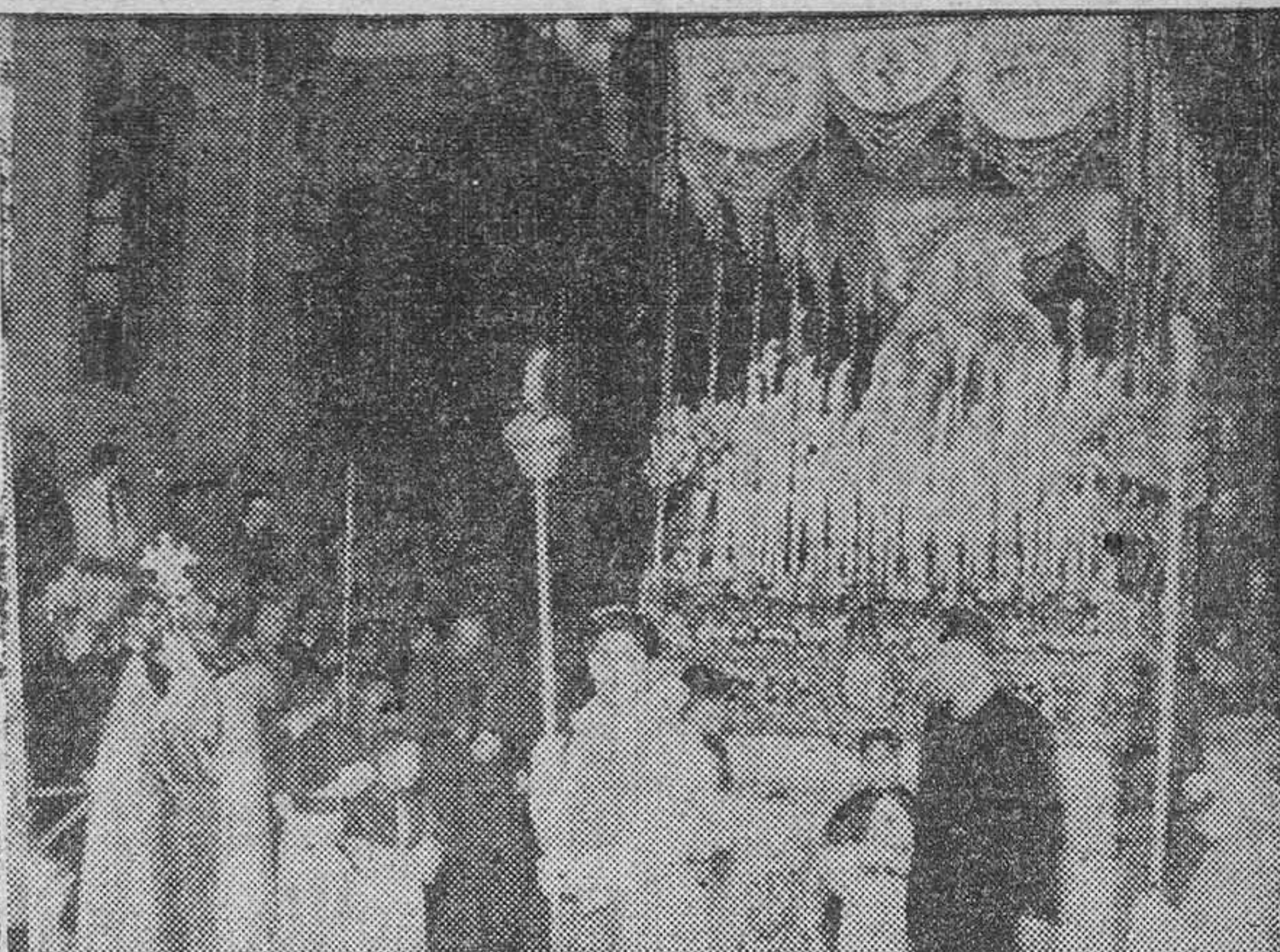
Ntra. Sra. de la Victoria, de la Cofradía de la Santa Cena Sacramental.