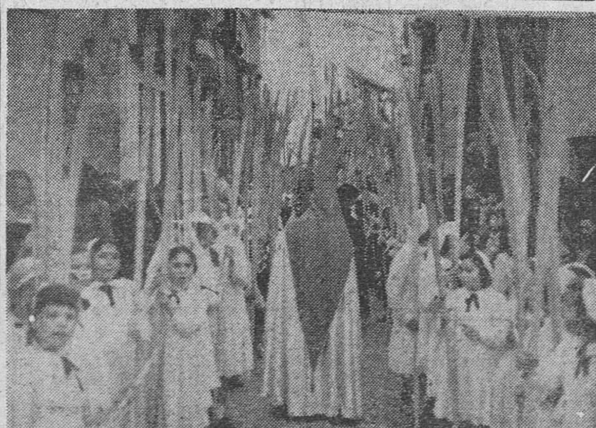
La Cofradía de la Entrada de Jesús en Jerusalén, la primera que ha desfilado en la Semana Santa granadina.