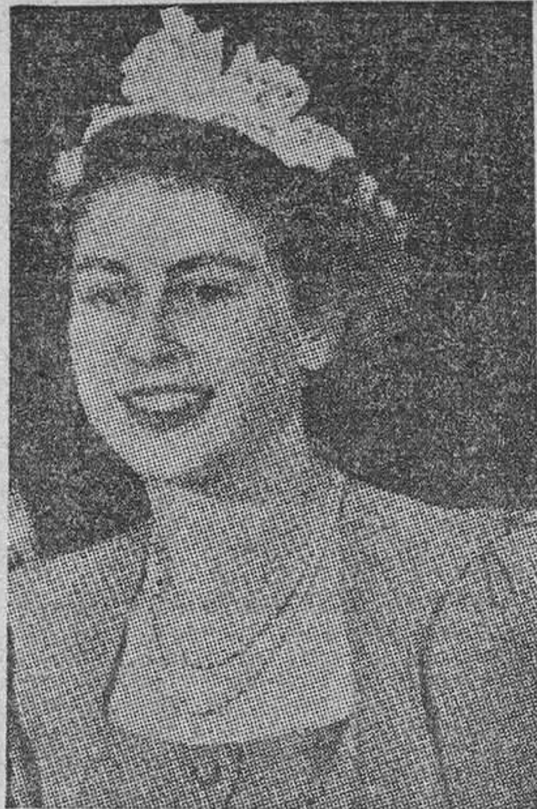
Isabel II, que ha sucedido en el trono de la Gran Bretaña a su padre, Jorge VI, fallecido el miércoles repentinamente.

FUE CONSTRUIDA EN 1838 PARA LA REINA VICTORIA