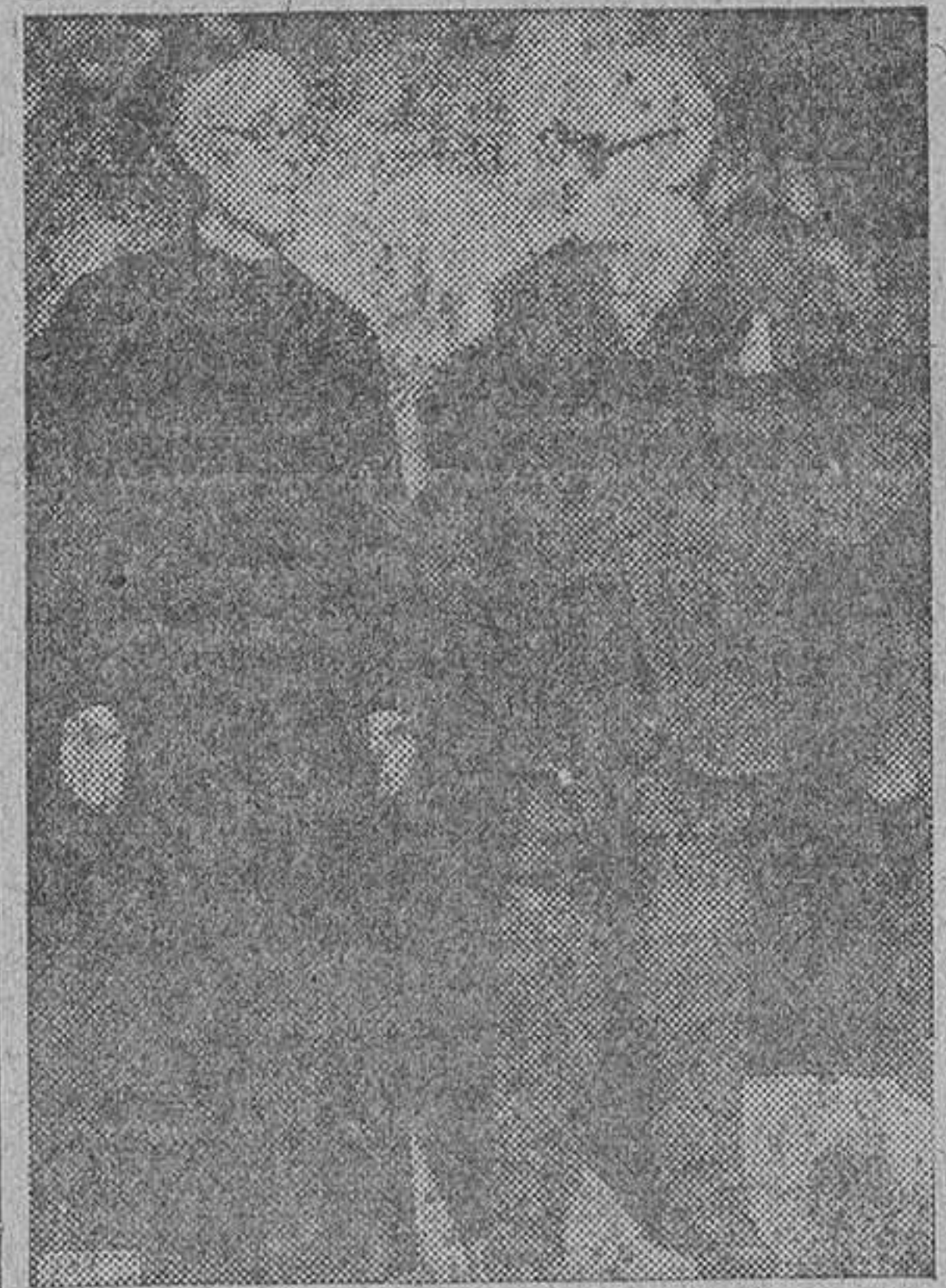
VICHY.—Una de las últimas fotografías del gran pintor Sert en la Catedral, después de rotar uno de sus lienzos admirables. Le acompaña uno de los canónigos de dicha Catedral.