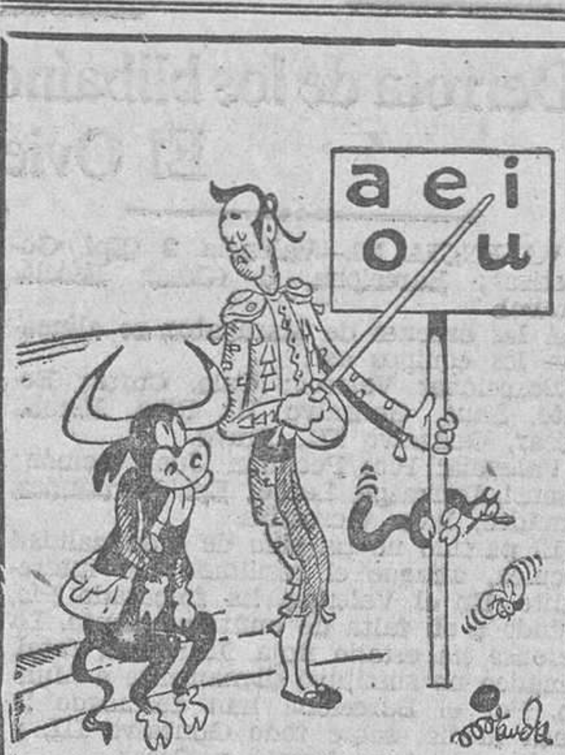
TAURINA, por Miranda «Una faena de maestros»