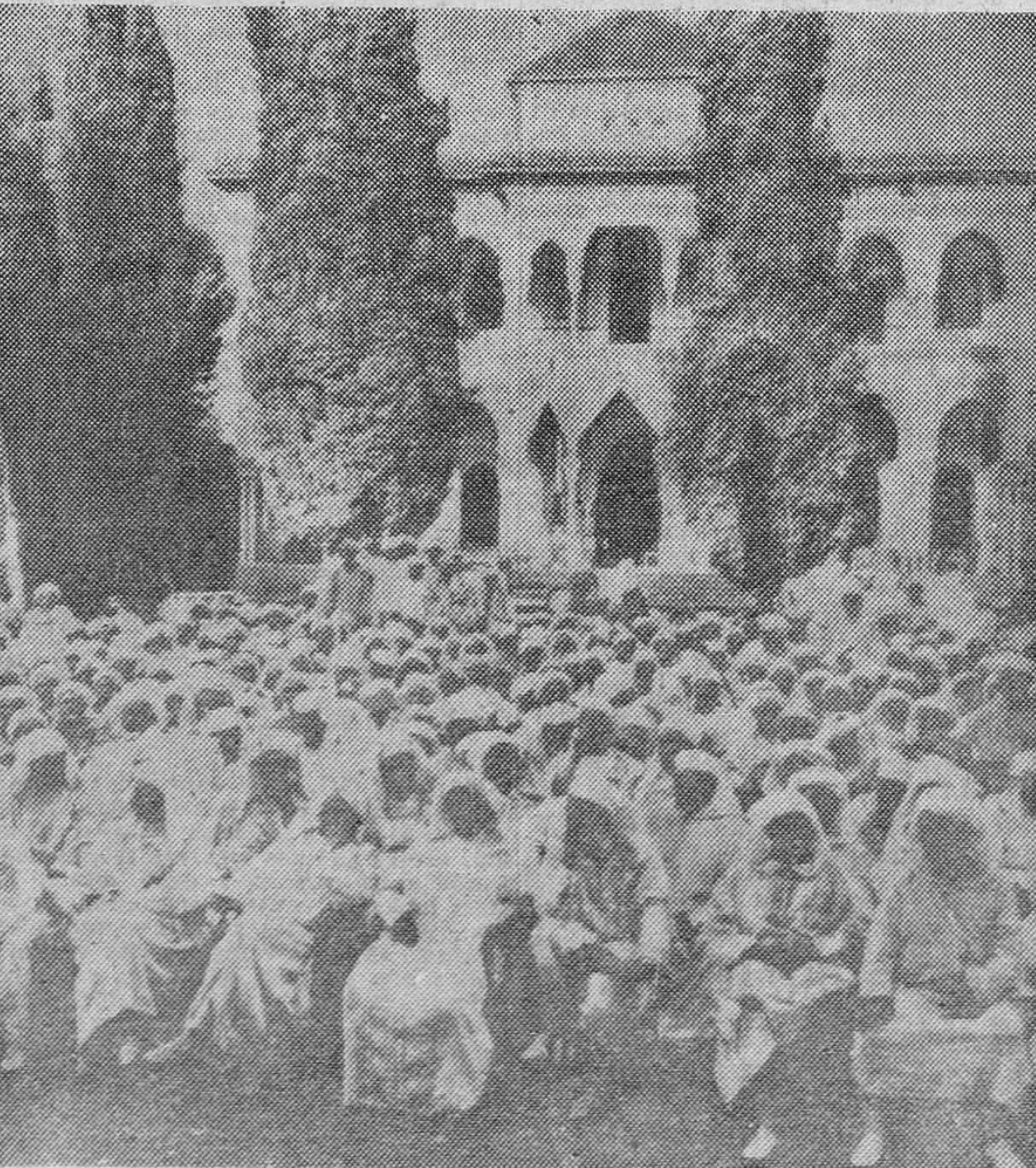
En el gran patio del palacio imperial de Rabat, bajas, caídos, moros notables y otras personalidades marroquíes esperan el momento de la proclamación de Muley Ben Arafa como Sultán de Marruecos, para rendirle seguidamente vasallaje y firmar la promesa de obediencia al nuevo Soberano.