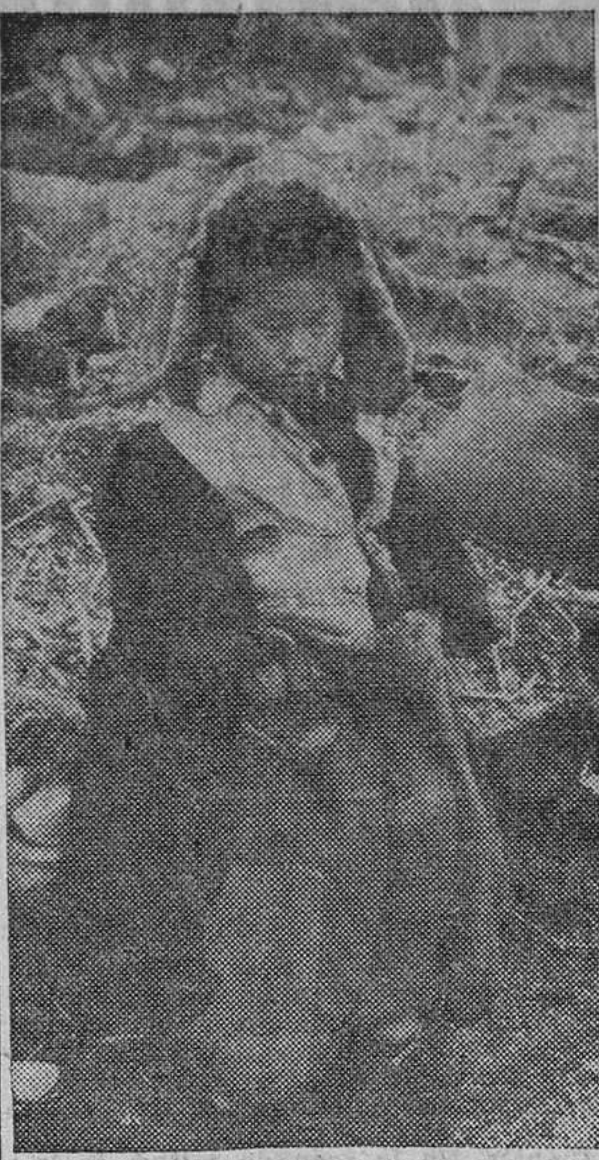
Sola y sin techo que la cobije, esta niña, a la que la guerra de Corea ha dejado huérfana, ha sido sorprendida por la cámara fotográfica sentada entre escombros cerca del frente de batalla, dos días después del armisticio.