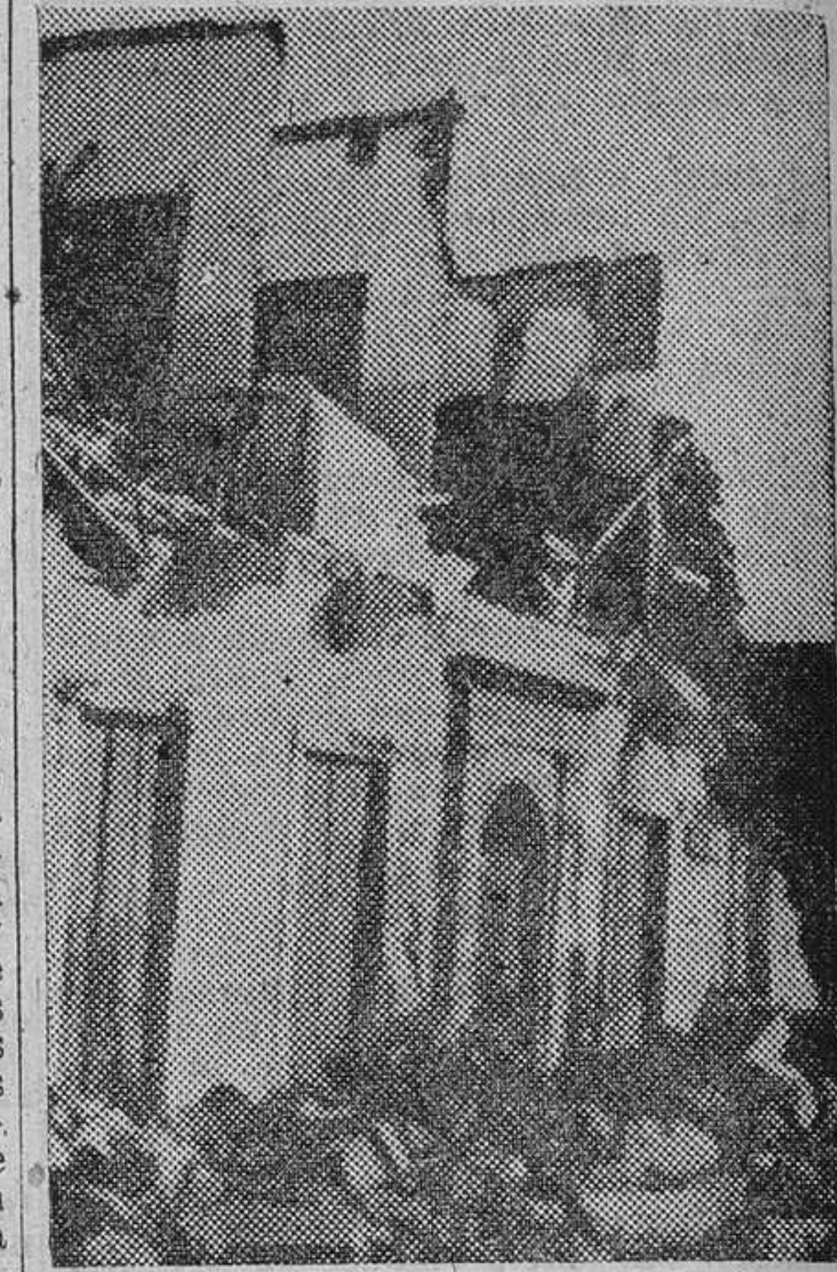
Desolación y ruina en las islas jónicas de Cefalonia, Itaca y Zante, donde quedaron destruidas unas veinte mil casas.

La causa fundamental de los terremotos es el enfriamiento del núcleo terrestre. En esa forma comenzó a organizarse el relieve de la Tierra. Primero fue una bola de fuego incandescente. Después se enfrió la superficie solidificándose, pero al enfriarse también parte del interior, se contrajo el núcleo dejando a la superficie sin apoyo. Entonces se rompió la corteza terrestre en mil peda-