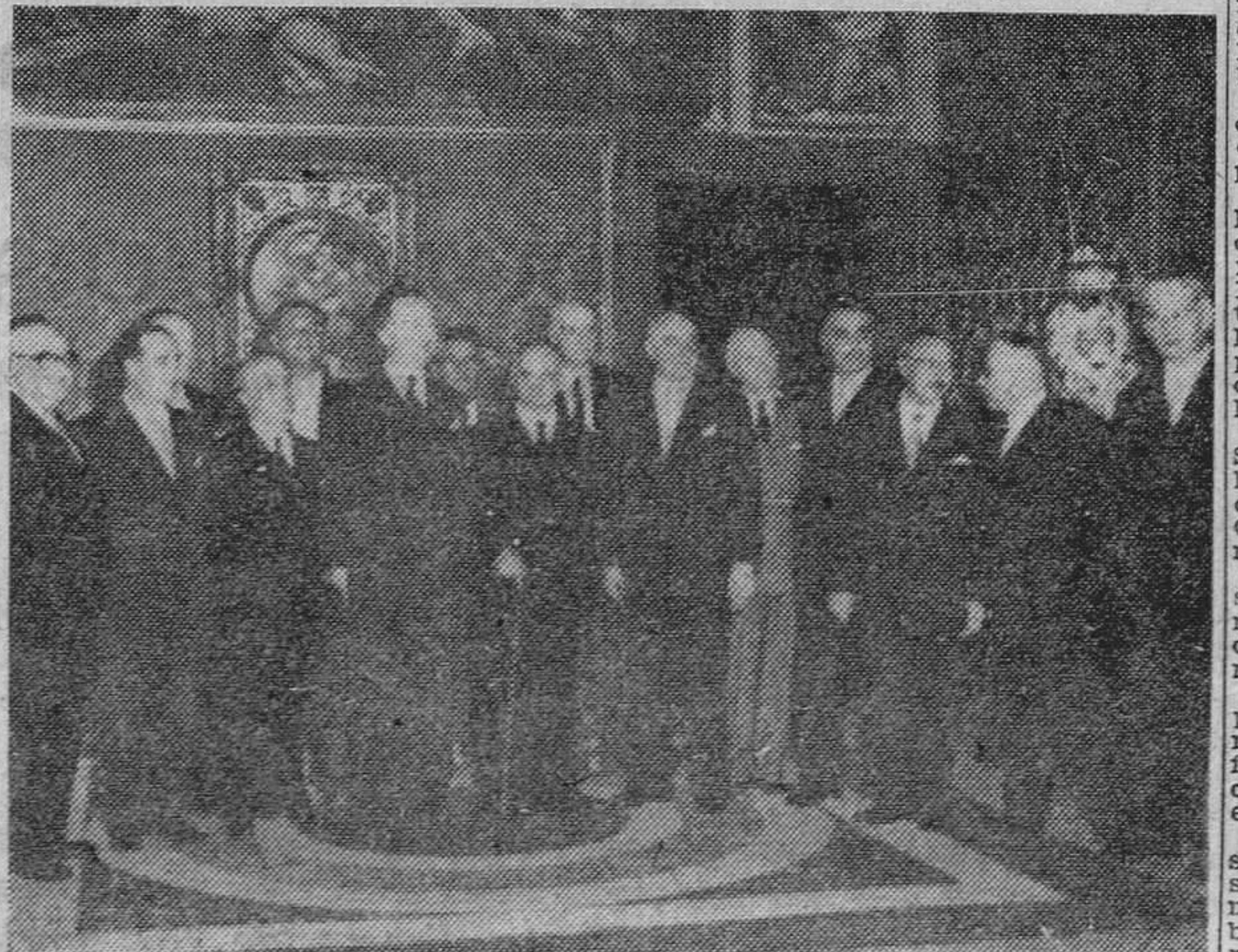
El nuevo Gobierno italiano presta juramento ante el presidente Einaudi.