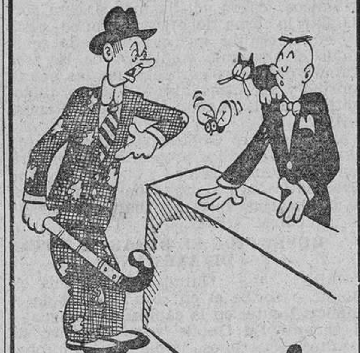
NOTA