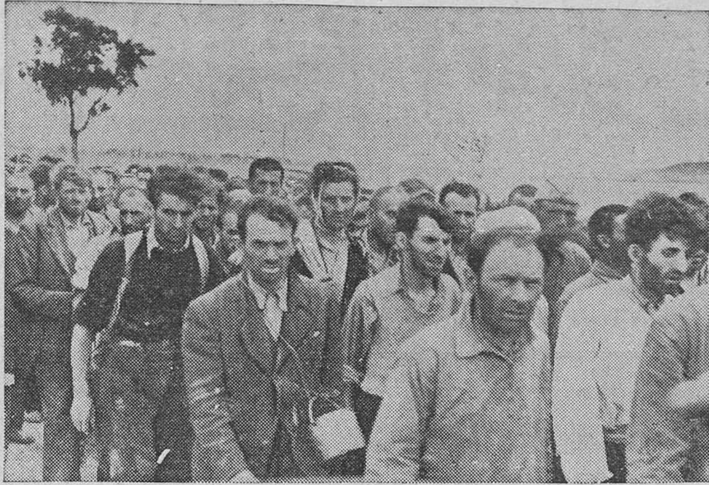
Francotiradores soviéticos prisioneros, entre los que hay numerosos judíos. Nunca mejor que ante esta fotografía puede decirse que la cara es el espejo del alma.

HELSINKI, 17.—La capital finlandesa ha sido atacada por los aviones soviéticos después de 19 horas de calma. La intervención de los cazas finlandeses rechazó el ataque soviético antes de que los aviones rojos hubieran podido alcanzar el centro de la población. (Efe.)