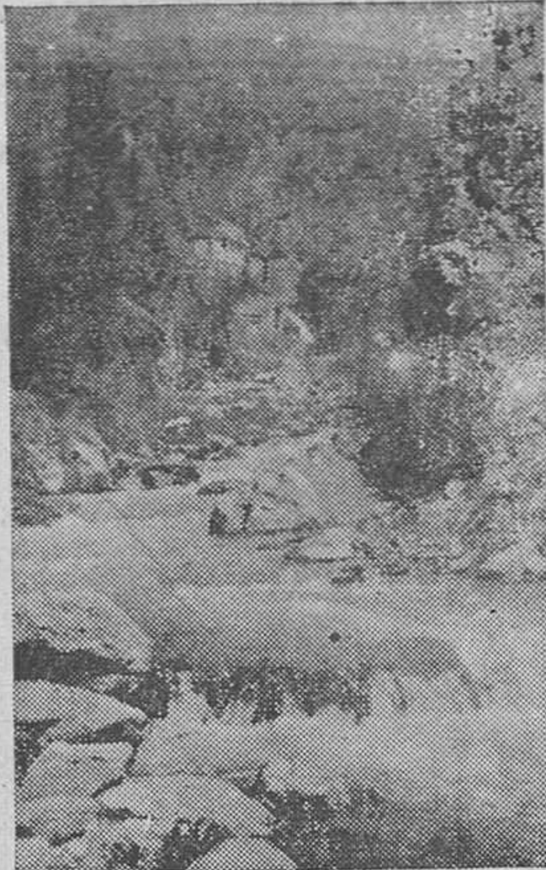
UNA VISTA DE LANJARON

Y por doquier, caras conocidas y otras muchas, muchísimas, de lejanas tierras, que dan a Lanjarón aspecto de ciudad cosmopolita en la temporada, que comienza el 1.º de junio y termina a mediados de octubre. Un cronista de sociedad tendría ancho campo para escribir varias crónicas de la estancia en el pintoresco y salutar pueblo de la provincia de Granada.—X.