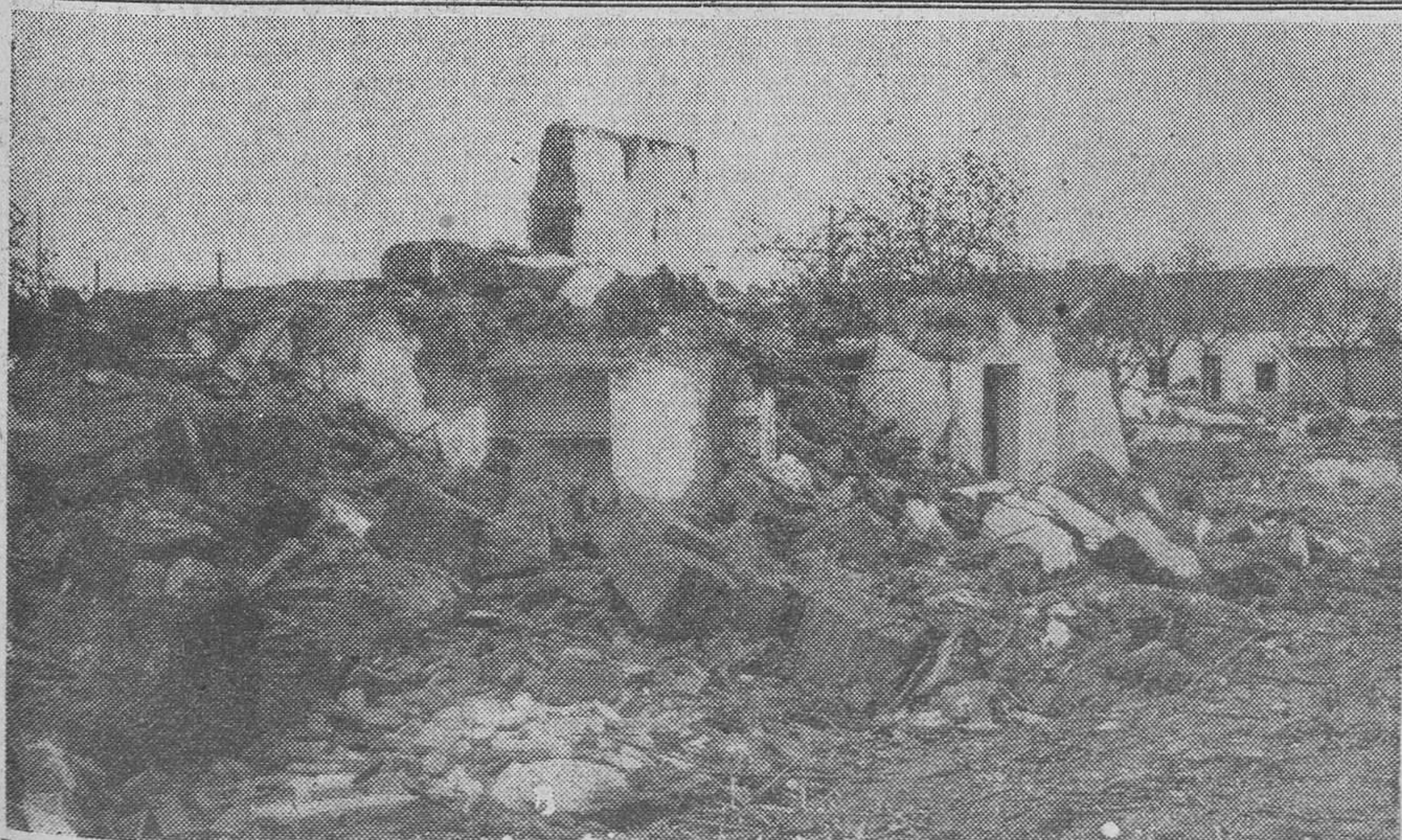
Regiones Devastadas ha comenzado su activa labor constructora en las zonas afectadas. La fotografía recoge uno de los muchos lugares de Albolote donde las huellas destructoras del terremoto quedan marcadas con más impresionante amplitud.

EL CAIRO 29.— Un tren de vía estrecha lanzó a un taxímetro lleno de personas a un canal de irrigación cerca de Tanta. Ocho personas resultaron muertas y diez y ocho heridas. El choque hizo descarrilar al tren, que cayó también en el canal, encima del coche.—(Efe).