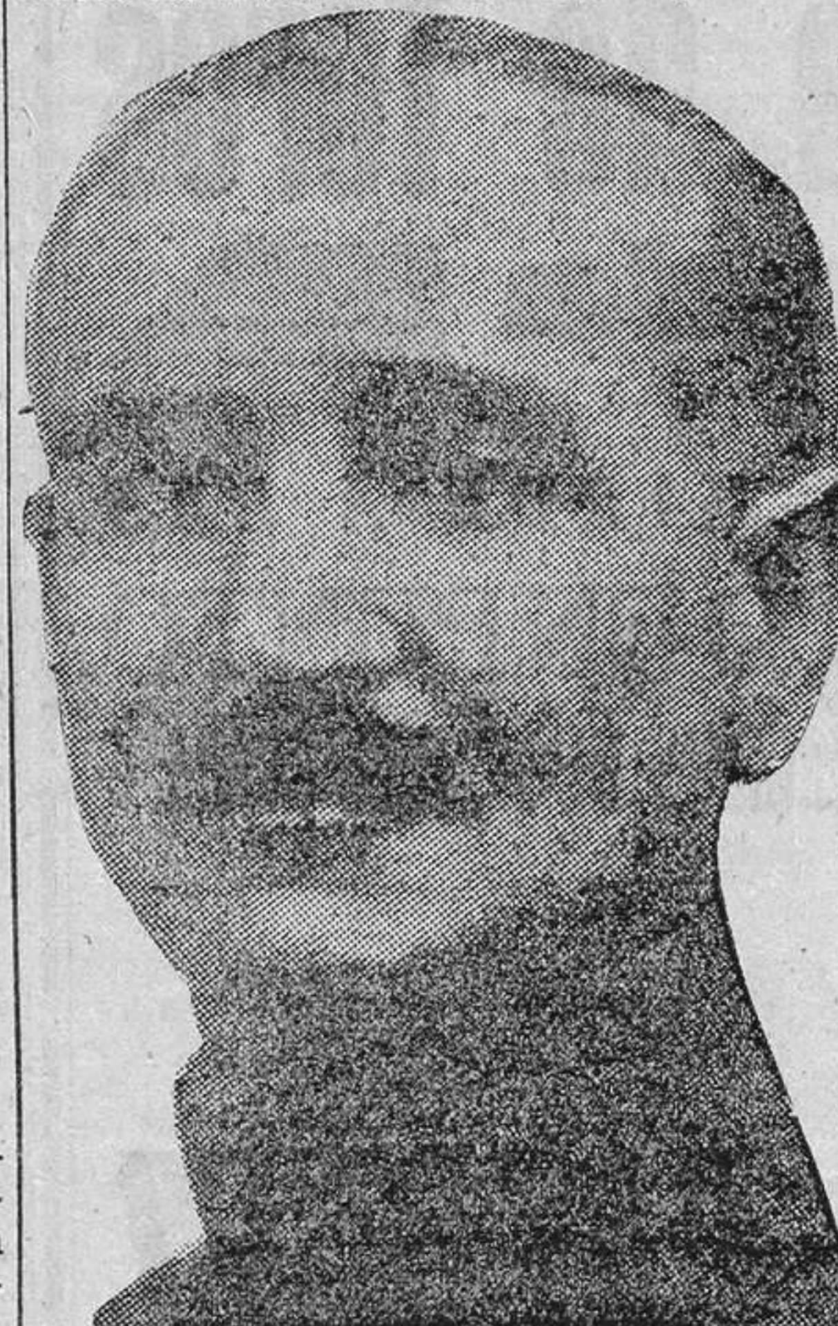
El jefe del Ejército del Sur, salvador de Andalucía.