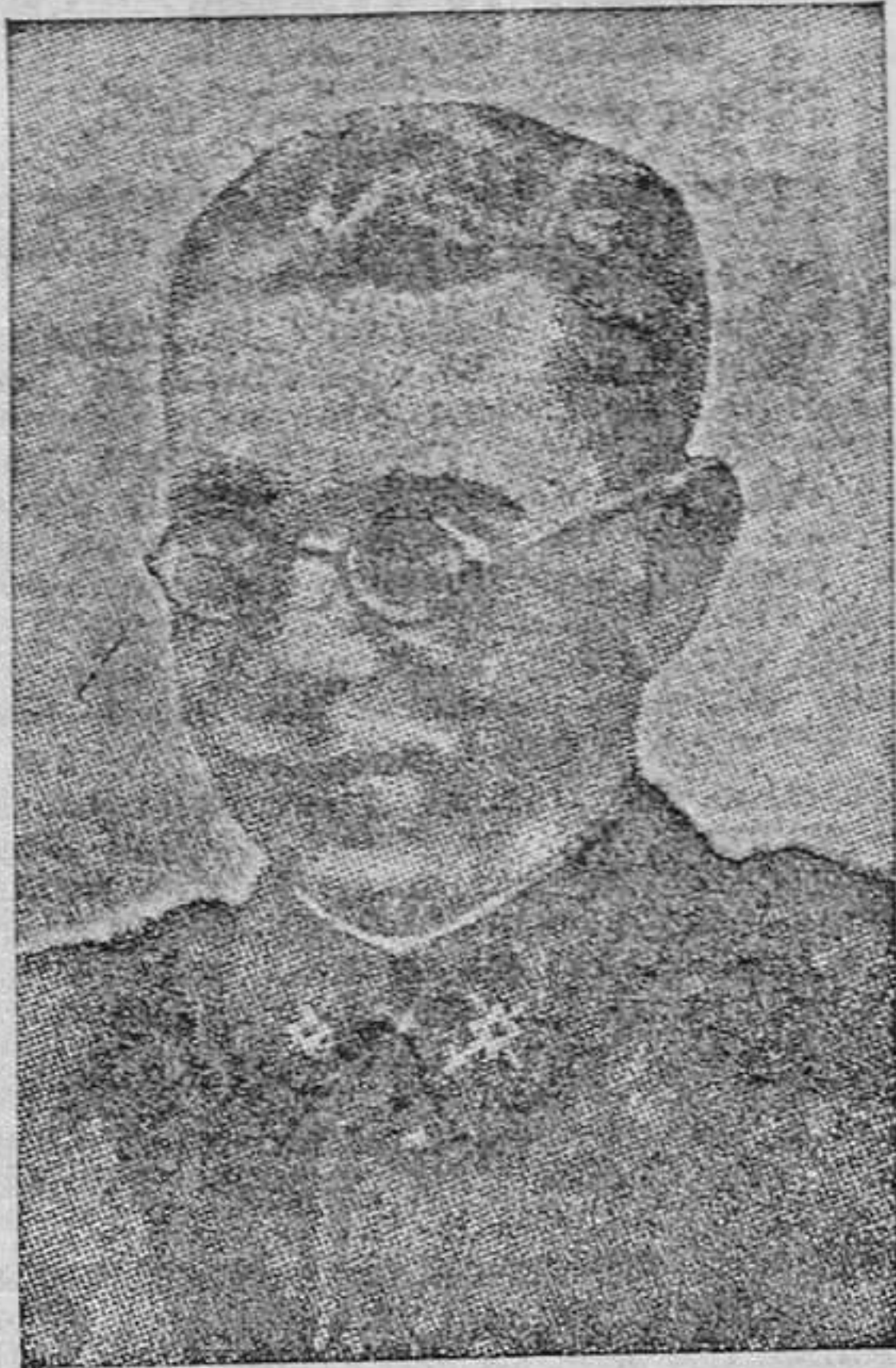
El artífice del Movimiento en el Norte, patriota insigne, que ofreció su vida por la España de Franco.

Hombres nuevos, hombres fuertes. Espíritus templados frente a todas las adversidades. Como lo están, también, con temple de héroes y de mártires, los que han vivido y viven en la zona roja. Muchachitas frágiles, que no parecían criadas para el menor trabajo han desempeñado rudos oficios, para llevar, después de la jornada agotadora, unos consuelos cristianos a los hombres encerrados en las cárceles. Damas que no resistían la impresión más pequeña han recorrido un día y