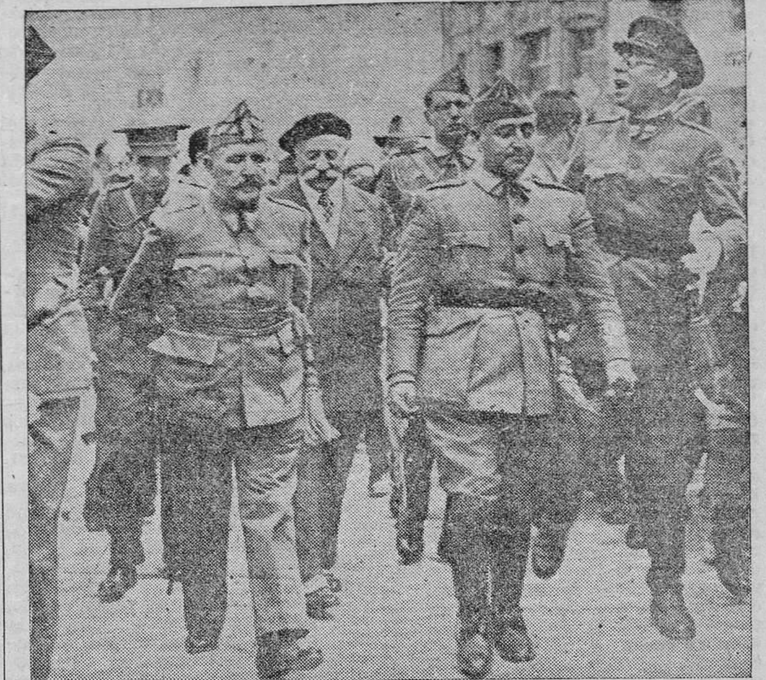
El Generalísimo, en la visita que hizo a las ruinas del Alcázar, recibió los aplausos del mundo, a quien asombró la victoria. Y entre los que le vitorean de cerca está uno de los más gloriosos soldados de España, el invicto general Mola, siempre presente en los españoles.

Pero aparte de esta razón fundamental, tenemos pruebas abundantes de la popularidad del Movimiento. Concretándonos a Granada, donde los ejemplos son más palpables para nosotros, tenemos la realidad de cómo fueron elementos populares los primeros que se incorporaron al levantamiento. Los camiones que aparecieron en aquel atardecer inolvidable en que Granada, dirigida por el Ejército, se decidió a escapar de la zampa marxista, iban ocupados por muchachos