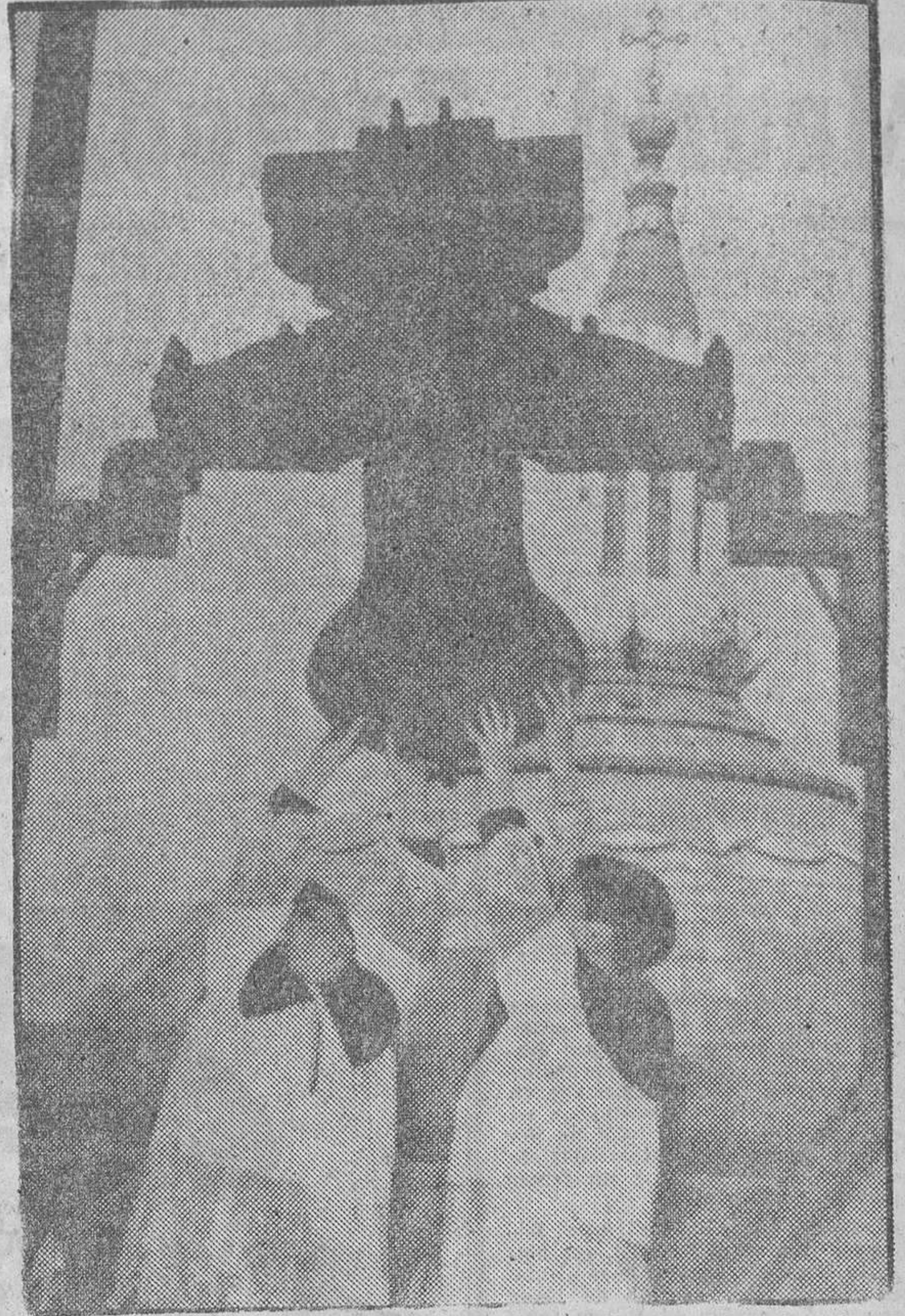
La mañana más optimista del año fue la de ayer, en que todas las campanas del mundo cantan la resurrección del Señor. ¡Cristo ha resucitado, aleluya, aleluya! Y el mensaje venturoso es transmitido por el aire, de uno a otro campanario, de uno a otro pueblo, de una a otra nación, en el idioma universal y tintineante del alegre sonido.

HOJA DEL LUNES (editada por la Asociación de la Prensa de Granada) se vende en las capitales y pueblos de las provincias de Granada, Jaén, Málaga, Córdoba y Almería.