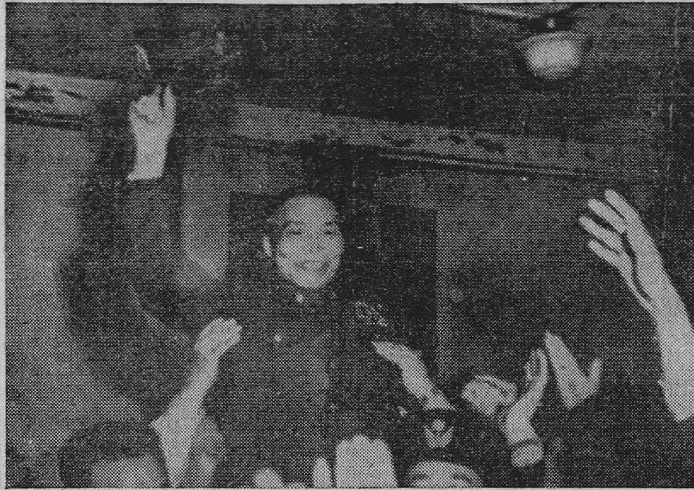
Fotografía del general Li Tsung Jen, que ha sucedido a Chiang Kai Chek, de acuerdo con el artículo número 49 de la Constitución china, al dimitir éste. Ahora Li encabeza el grupo gubernamental que quiere una paz honrosa con los comunistas