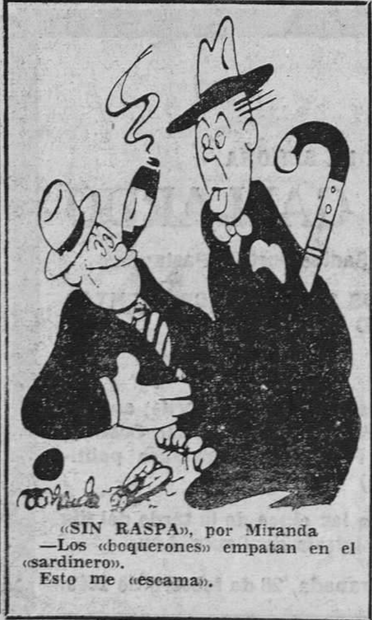
«SIN RASPA», por Miranda —Los «boquerones» empatan en el «sardinero». Esto me «escama».