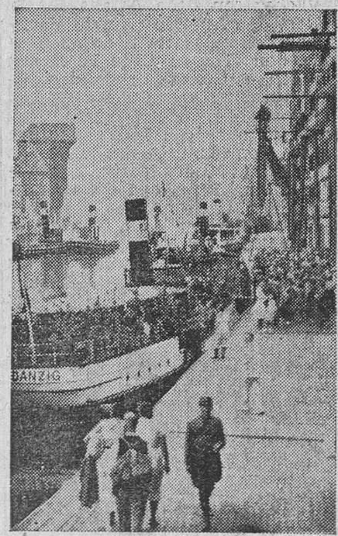
Vista del puerto de Dantzig

Hoy se ha hecho vida normal por la población de Roma. Las familias marcharon, como acostumbraban los domingos, a los alrededores de la ciudad para pasar el día, sin dar muestras de preocupación.