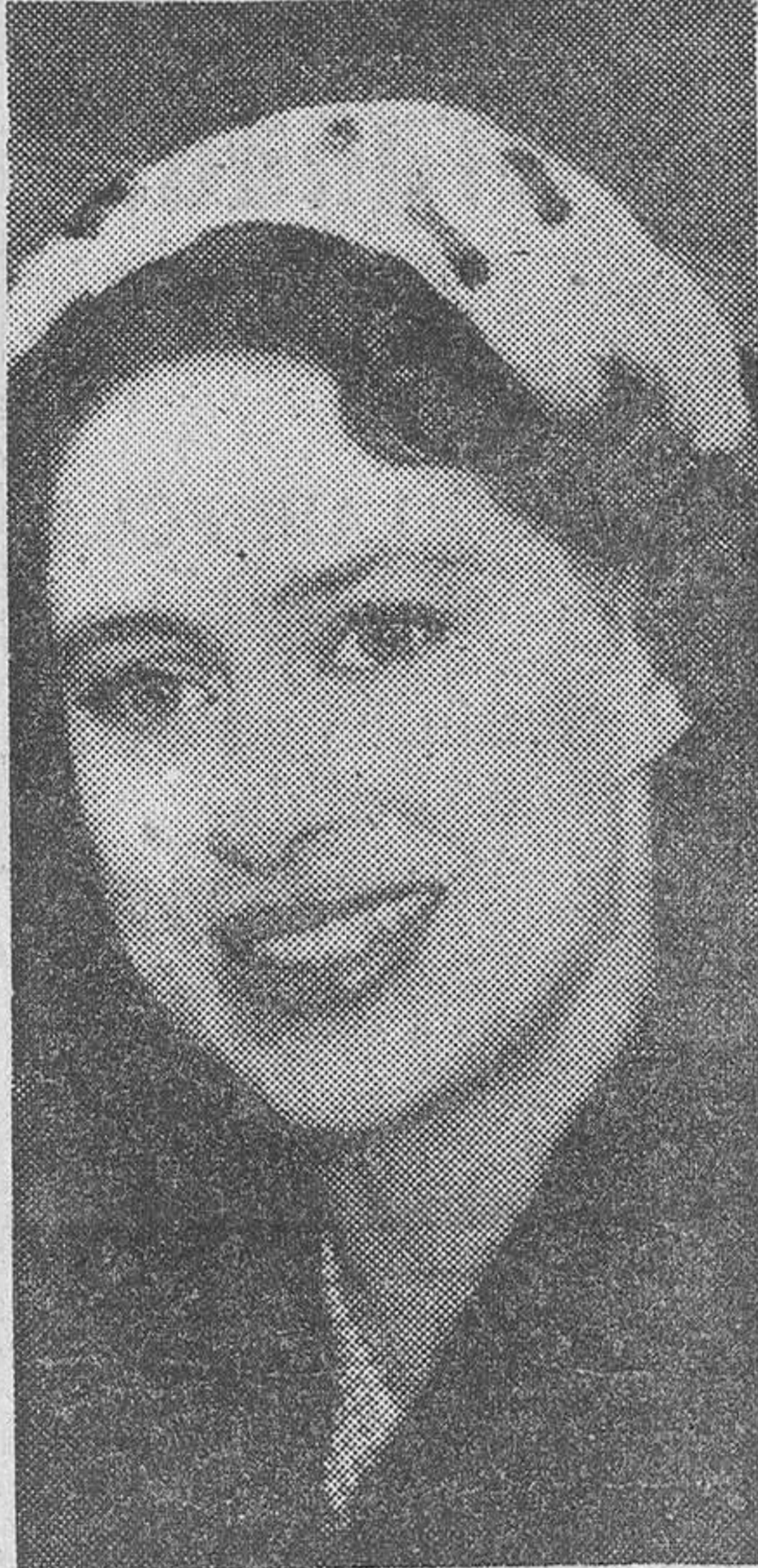
MARGARITA DE INGLATERRA

Hace dos años y medio, casándose con Townsend, la princesa habría renunciado inmediatamente no sólo a sus derechos sucesorios, sino también a su rango. Ahora ha cambiado de opinión. Constitucionalmente, está obligada a renunciar a la sucesión al trono, no en su propio nombre, sino en nombre de sus futuros hijos. Puede, por el contrario, conservar perfectamente su título de princesa real, lo que probablemente hará.