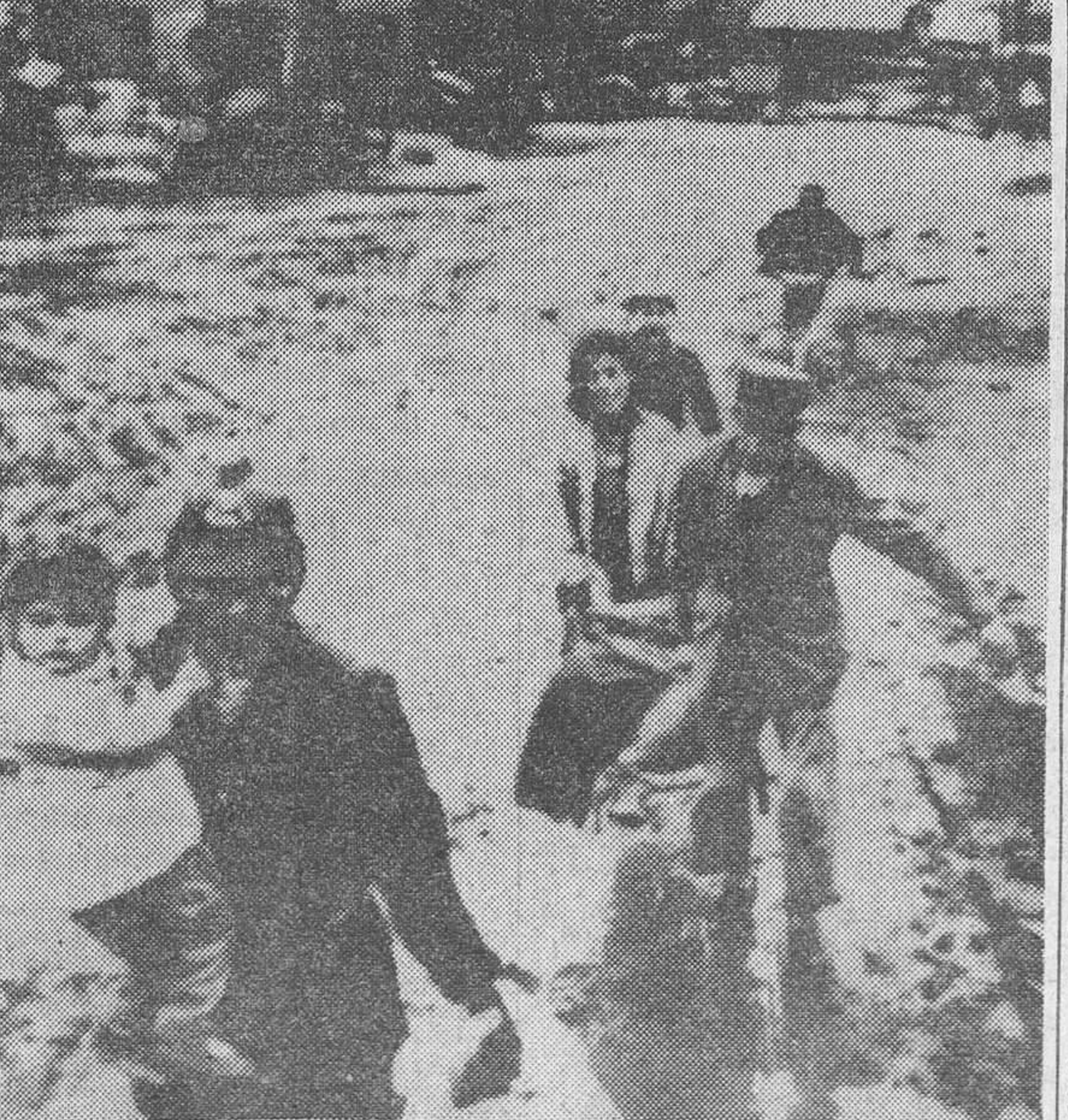
Mientras los padres rescatan los pocos enseres que han podido salvar de su hogar cubierto por las aguas del río Plata, un bombero lleva en sus brazos a la pequeña de la familia y dos hijos mayores corren detrás de los padres. Las autoridades estiman que medio millón de personas han resultado afectadas por las inundaciones.