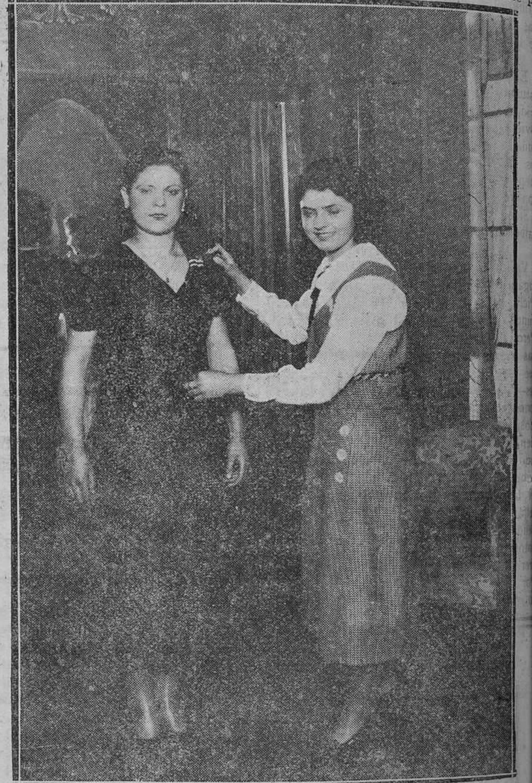
La hora de la prueba.—Aquí, si la señorita elegante es fastidiosa, puede aumentar el precio del vestido.

Y cuando terminamos de hacer esta información, era la hora de la salida de las lindas modistillas. Ellas que trabajaron durante ocho horas les toca expansionarse y salen a la calle llenas de optimismo para dar a ésta, la alegría del venil de la que estuvo ausente mientras duró la jornada. Quizá en alguna esquina esté situado el castigador que espera el paso de las modistillas para lanzar el piropero que de antemano tiene pre-