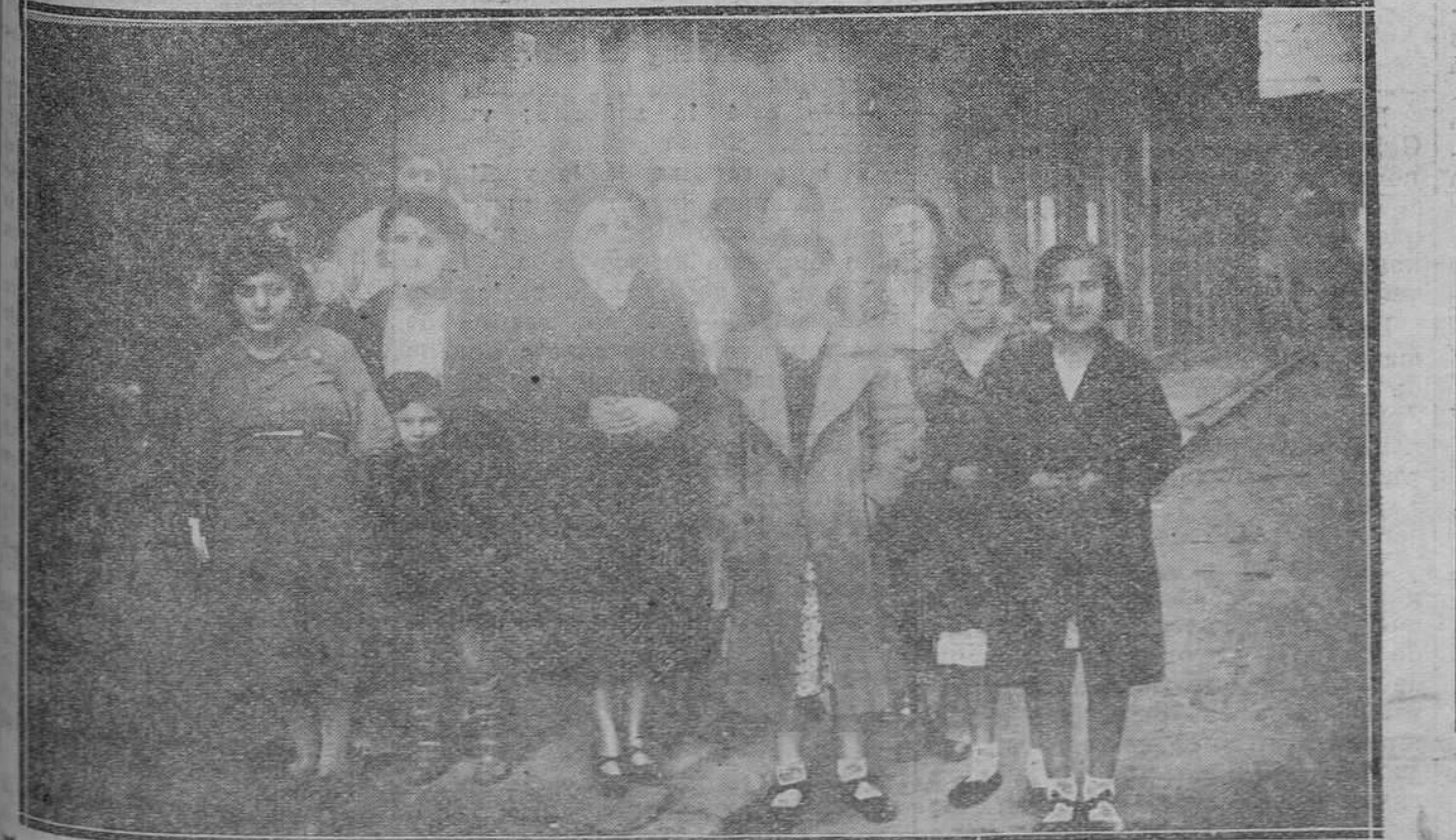
La hora de la salida. Las modistillas salen del taller optimistas, dando a la calle una alegría juvenil de la cual estuvo ausente mientras duró la jornada de trabajo.