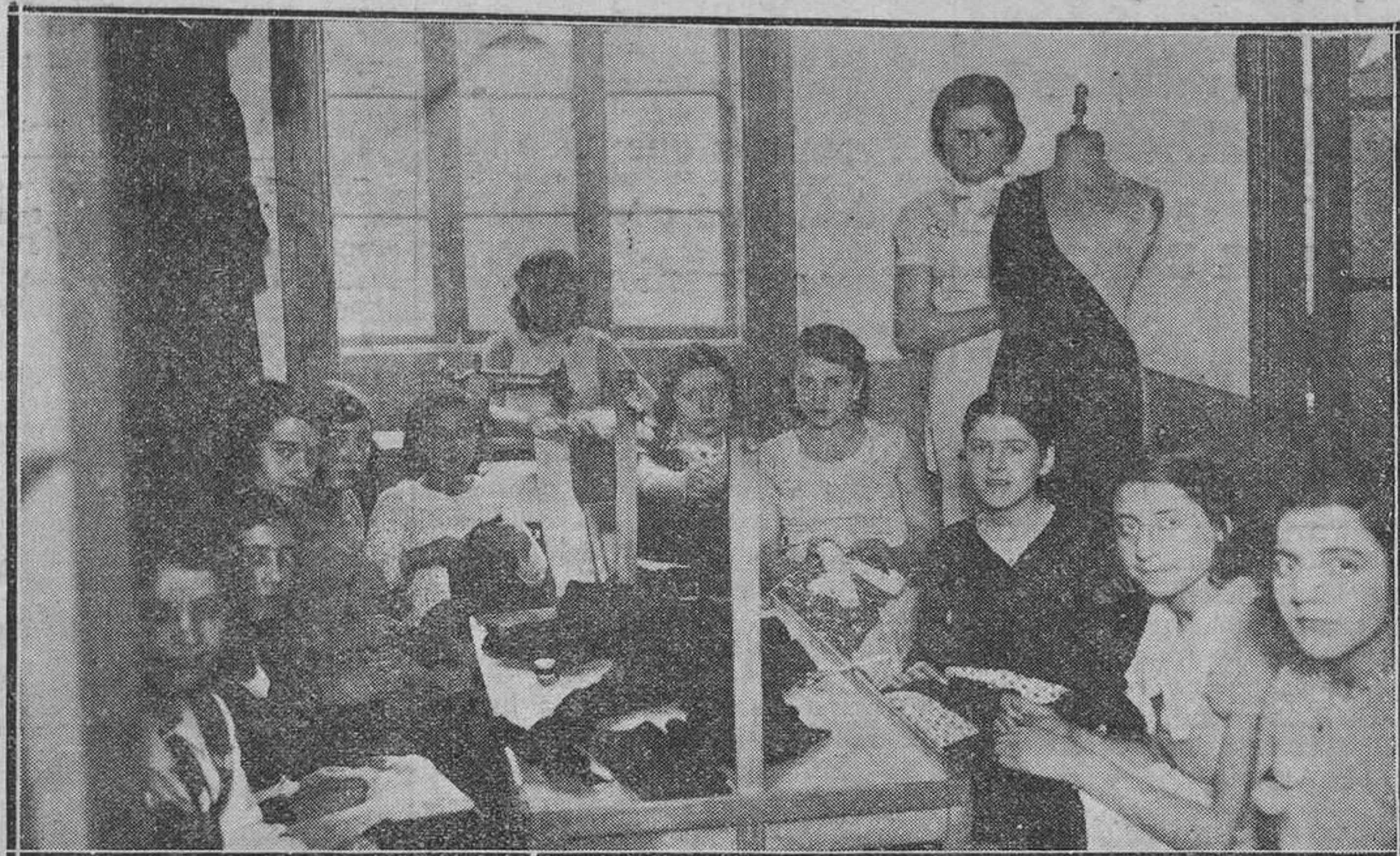
Lo que luego será un magnífico vestido, no es más ahora que pedazos de tela cortados para los profanos, sin valor alguno. Sin embargo, dentro de unas horas la prenda quedará terminada, gracias a las manos expertas de estas lindas modistillas.

Una mañana en el taller de confección.-En el momento de la prueba puede subir el precio de la prenda.-Donde más tiempo se emplea es en cobrar la cuenta