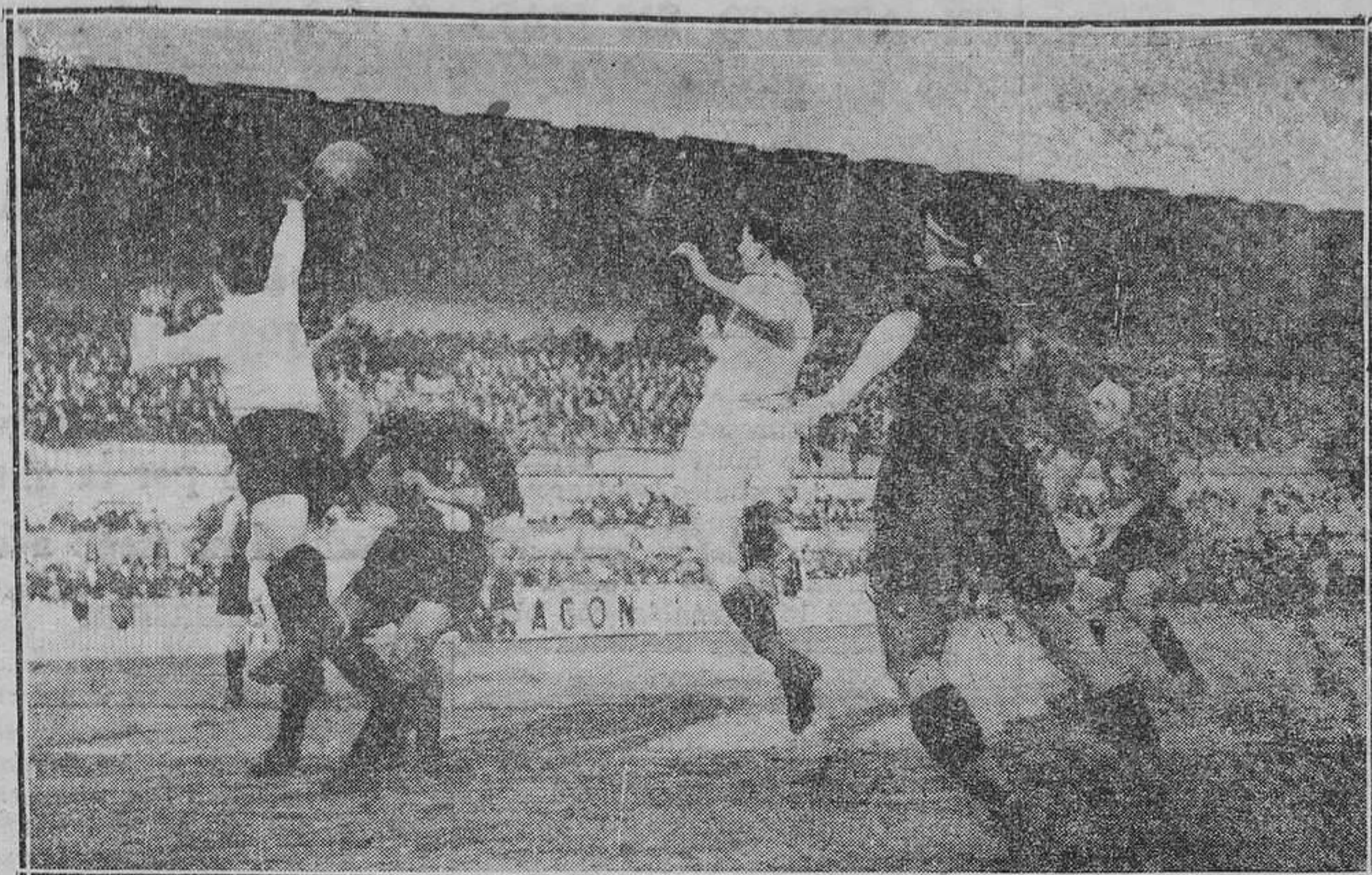
Lángara se trajo medio equipo a renero pegado a la camiseta. A pesar de todo, cuando el balón rondaba la puerta de Allande, allí estaba el internacional dispuesto a hacer llegar el cuero a la red. La foto representa un centro de Casuco que Lángara remata de cabeza; el balón tocó luego en el puño de Allande dirigiéndose hacia Emilín para que éste le envíe por encima del larguero.

El domingo fué la primera vez que Lángara tiro un penalty con poca fuerza.