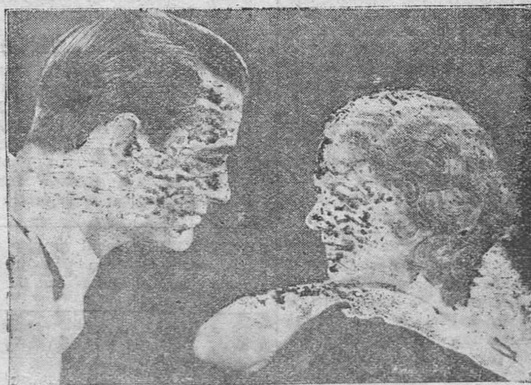
La encantadora Janet Gaynor, que tantas veces apareció en Benzo de plata al lado de Charles Farrell, ha formado, con Lew Ayres, una nueva "pareja ideal" para hacer "La feria de la vida".