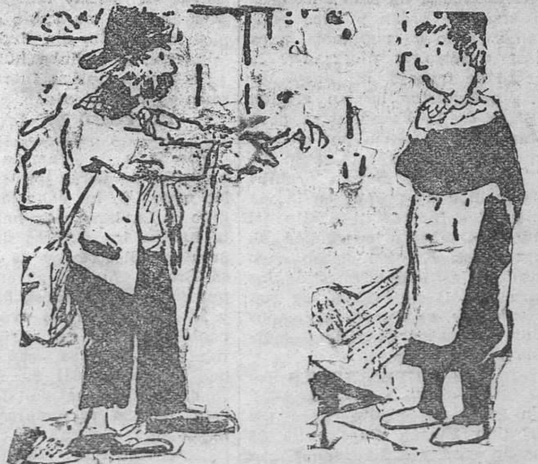
—Señor Dupont: su gato se ha comido mi canario, pero usted tiene que comprarme otro.

—Porque su mano es muy grande y su fortuna muy pequeña.