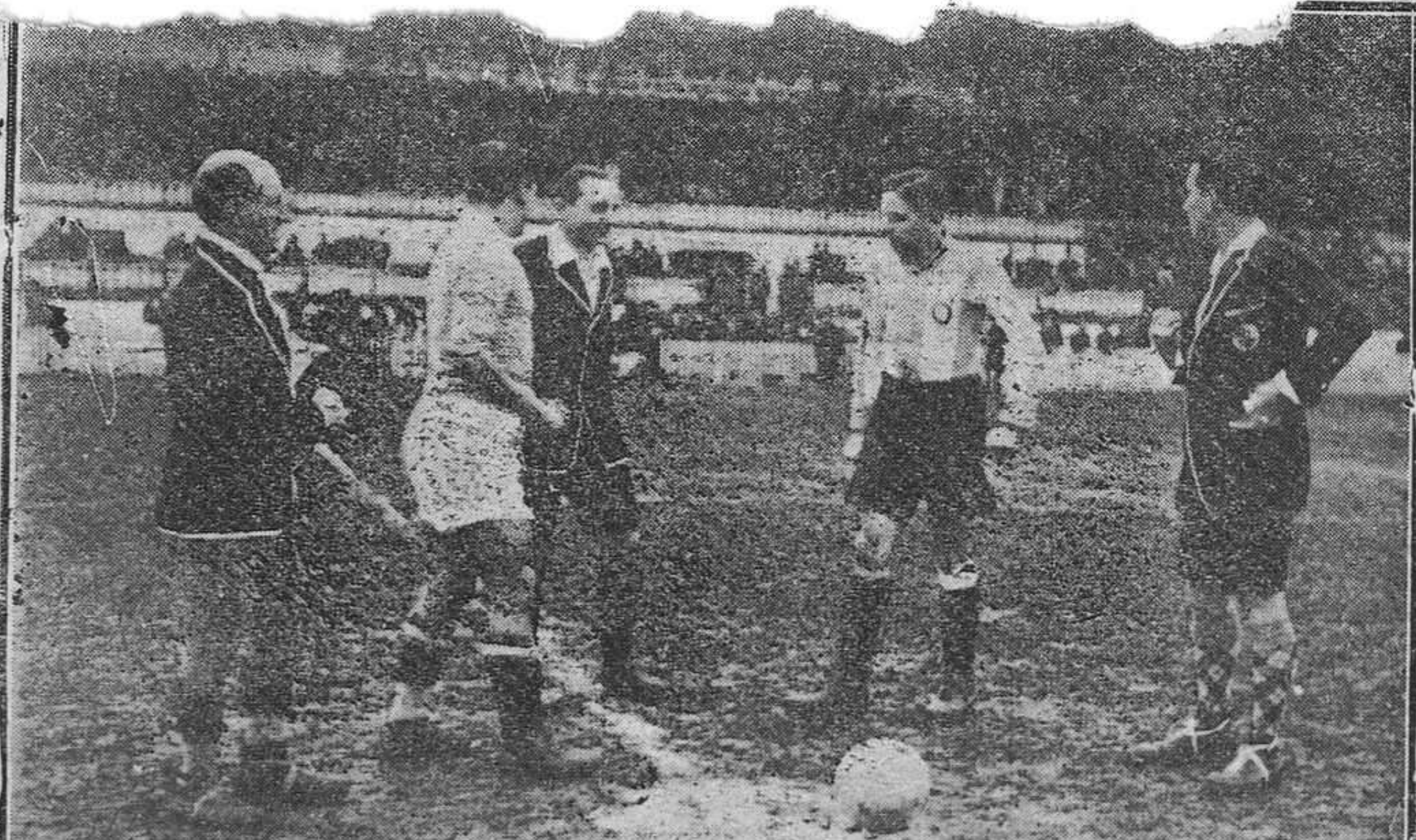
Los capitanes del Español y el Oviedo, antes de comenzar el encuentro, sorcean los campos bajo la mirada de Vallana, el árbitro que no dió un míñ porque tuvo la suerte de actuar en Buennavista

Montgomery fué a vivir en un "bungalow" cuando llegó a Hollywood. Luego, tomó un "bungalow" mueblado en Beverly Hills. En la actualidad tiene una casa de dos pisos con paredes de ladrillo en Brentwood. Allí vivió en pisos alquilados durante sus primeros meses en California, tomando luego una casa en Beverly Hills. Después hizo traer el mobiliario de su casa en Nueva York, y se instaló en una quinta a estilo español en Beverly Hills.