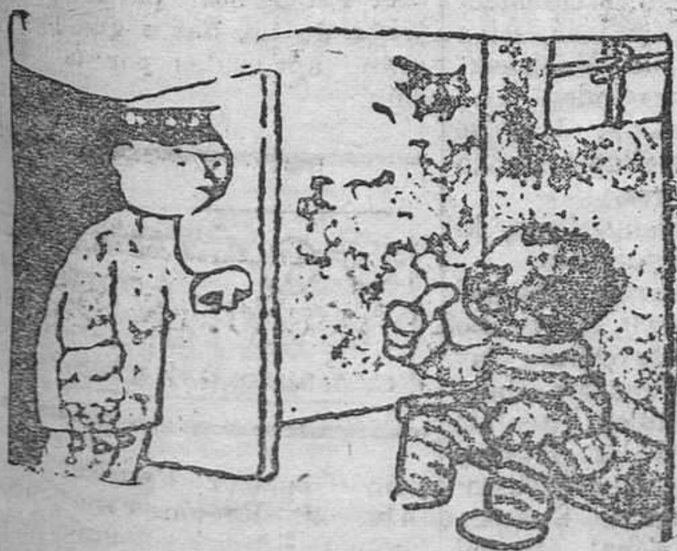
EL CARCELERO.— No cante usted más o le voy a echar a la calle.

Haga usted su publicidad en REGION y obtendrá un resultado práctico