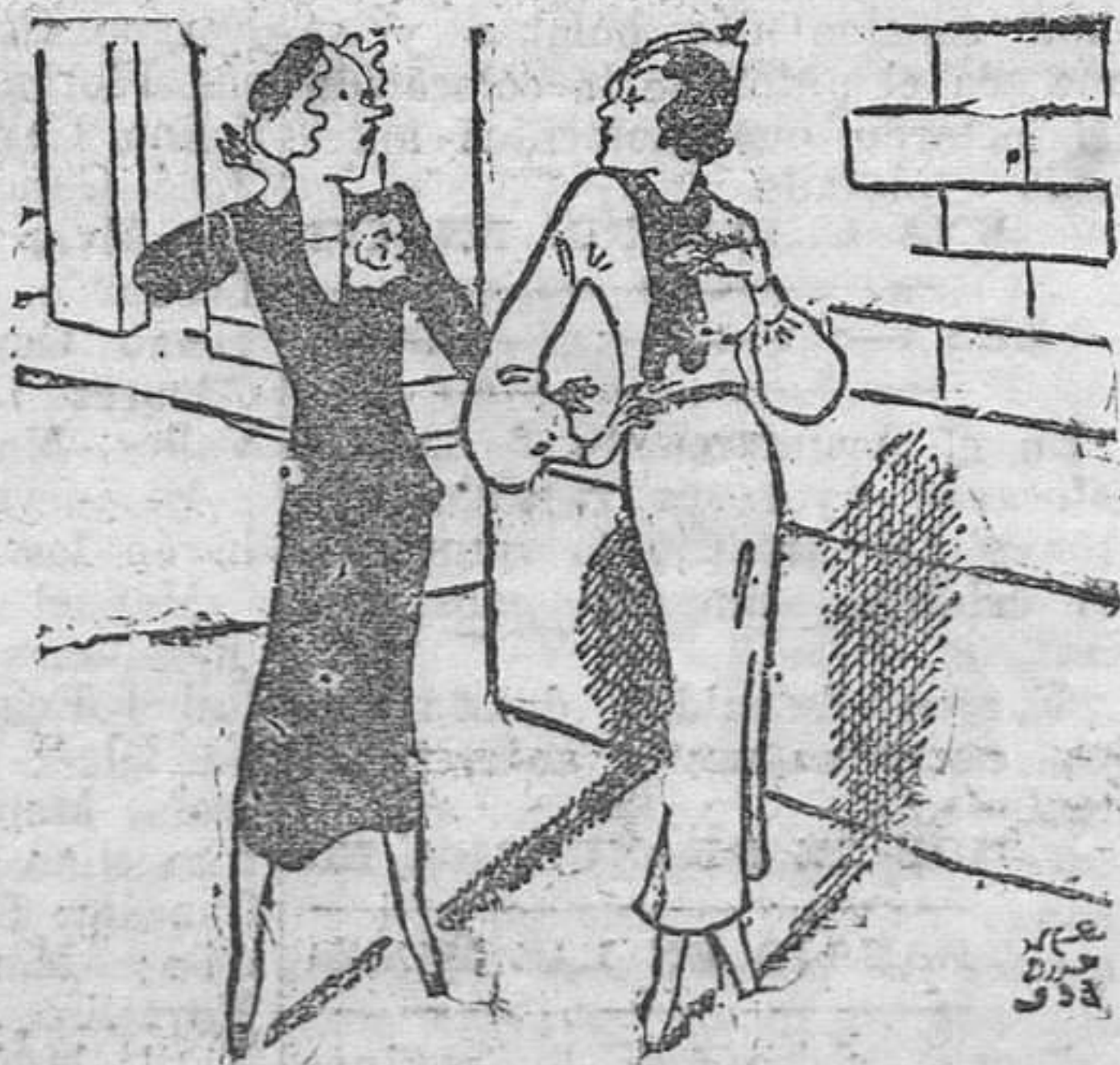
—Jack me ha ofrecido su mano y su fortuna, pero no las he querido.