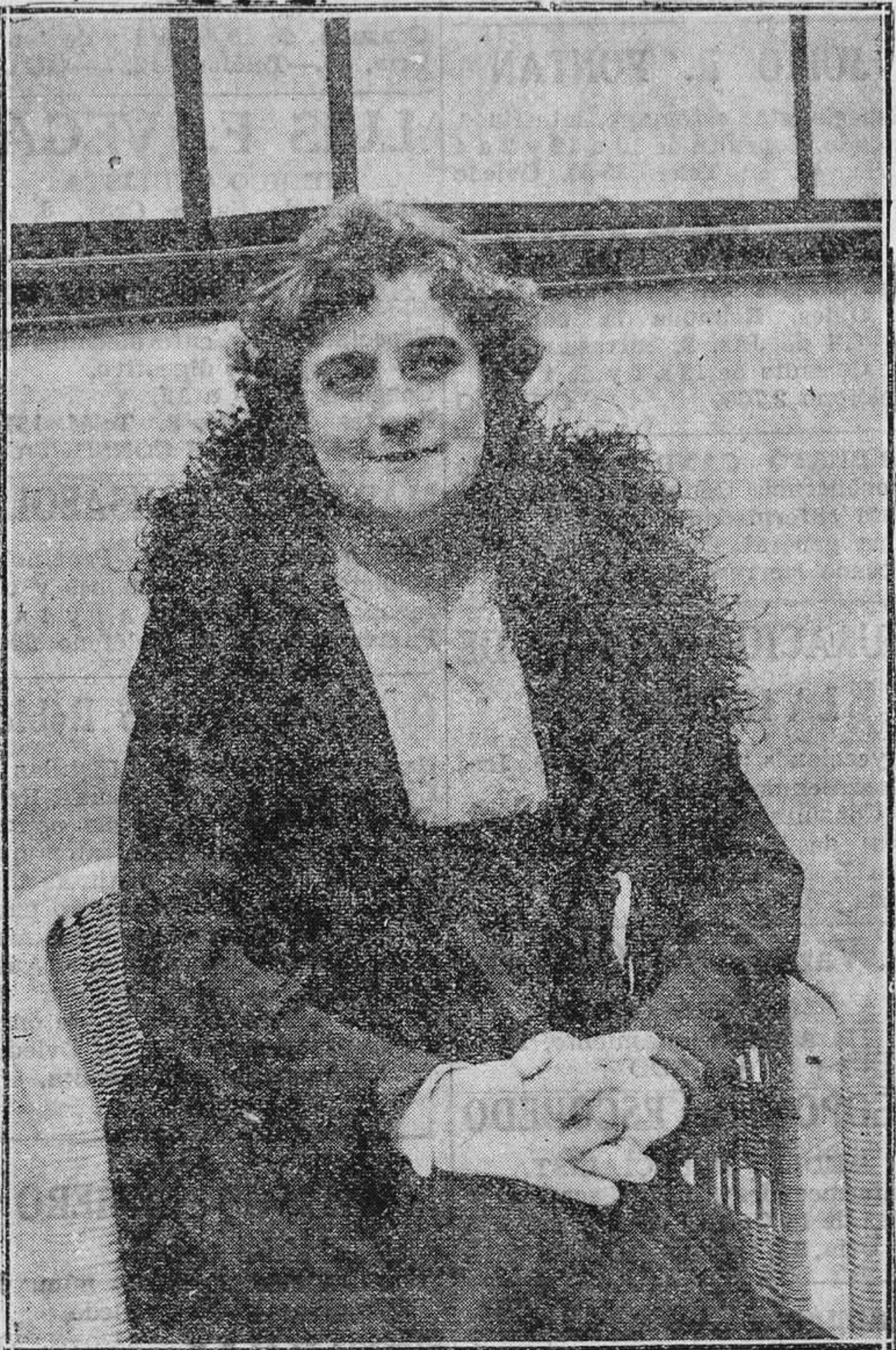
La insigne actriz Rosario Pino, gloria de la escena española que acaba de desaparecer.

FERROL.— Se han suspendido los actos galleguistas, a causa de que las principales figuras de los partidos tienen que tratar los puntos para el mitin monstruo que se celebrará como eco de protesta contra el tratado con el Uruguay.