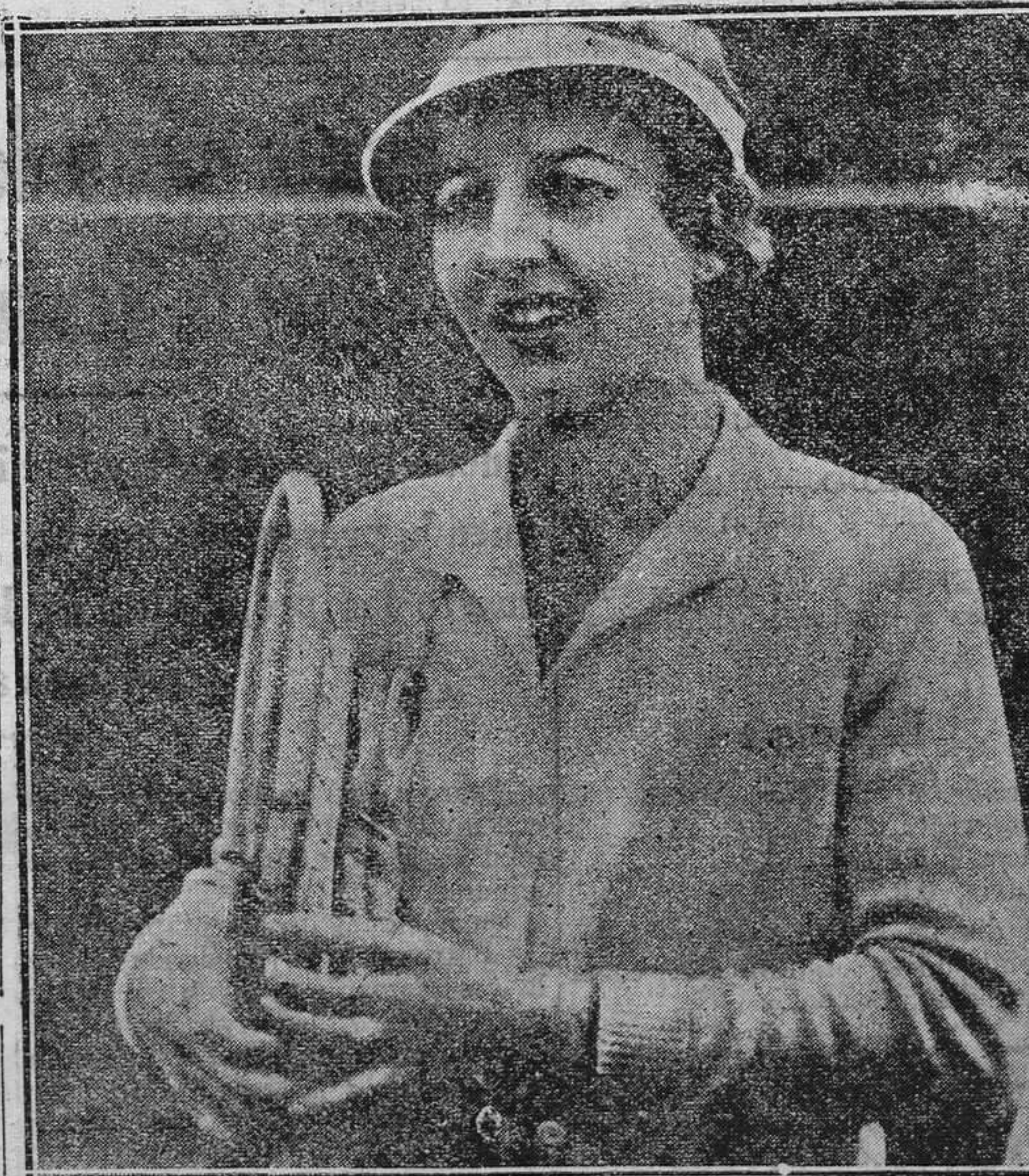
La señorita Helen Wills Moody, que ganó, una vez más, el campeonato femenino de tennis disputado en Wimbledon.