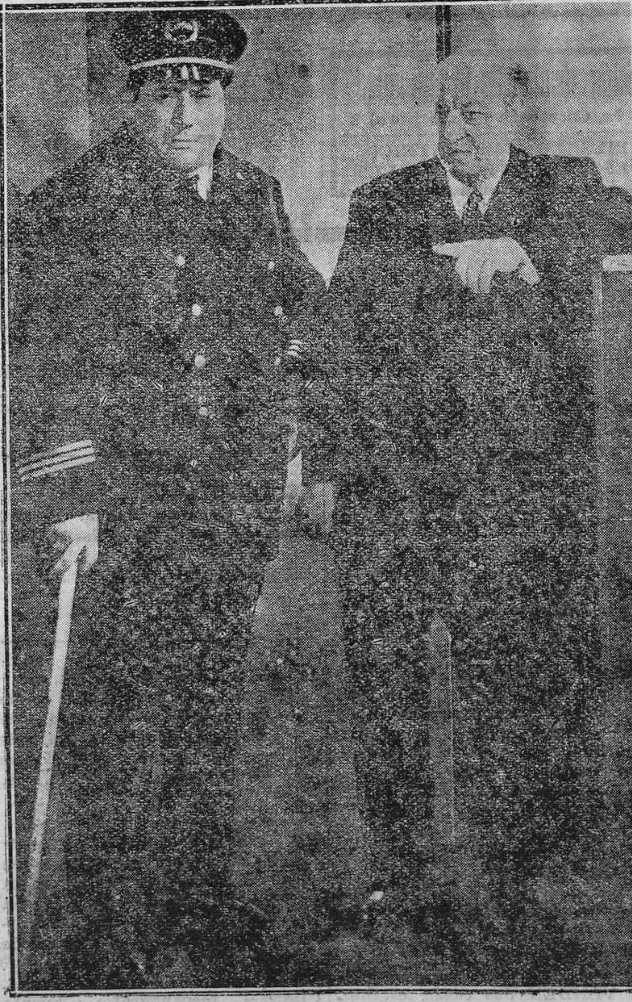
Harry Baer y Alcover, en la película "El Criminal".