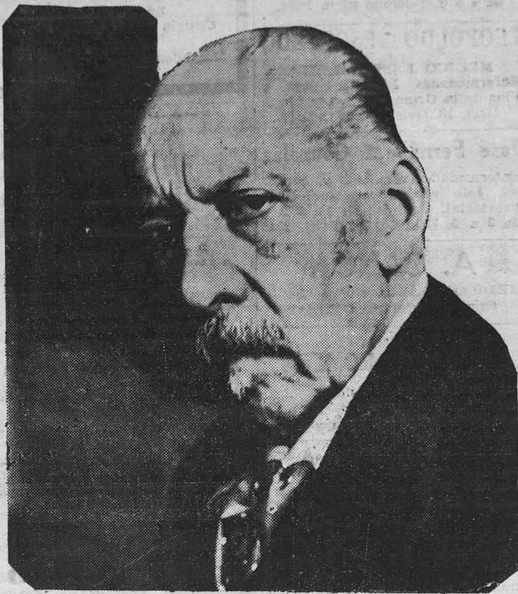
Un gran amigo de España.—Mr. Charles Widor, el famoso organista y compositor francés, secretario perpetuo de la Academia de Bellas Artes de París, a quien acaba de serle rendido gran homenaje, con motivo de haber cumplido sus 90 años.