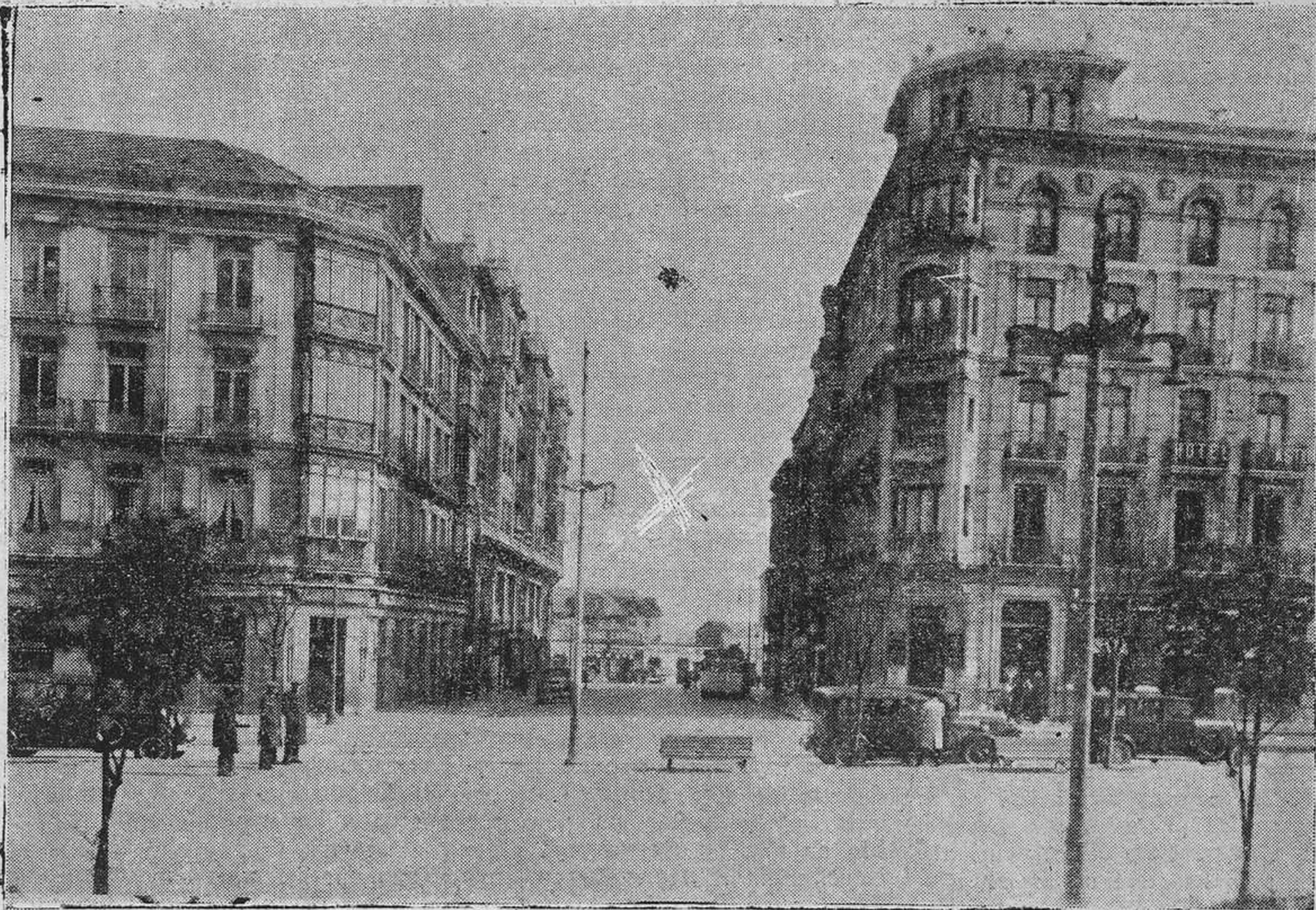
Al fondo de esta vía (x) se pretende levantar un edificio para la ponar el proyecto de prolongación de cuyo asunto hemos de ocuparnos oportunamente. He aquí una atrocidad más del Ayuntamiento socialista.