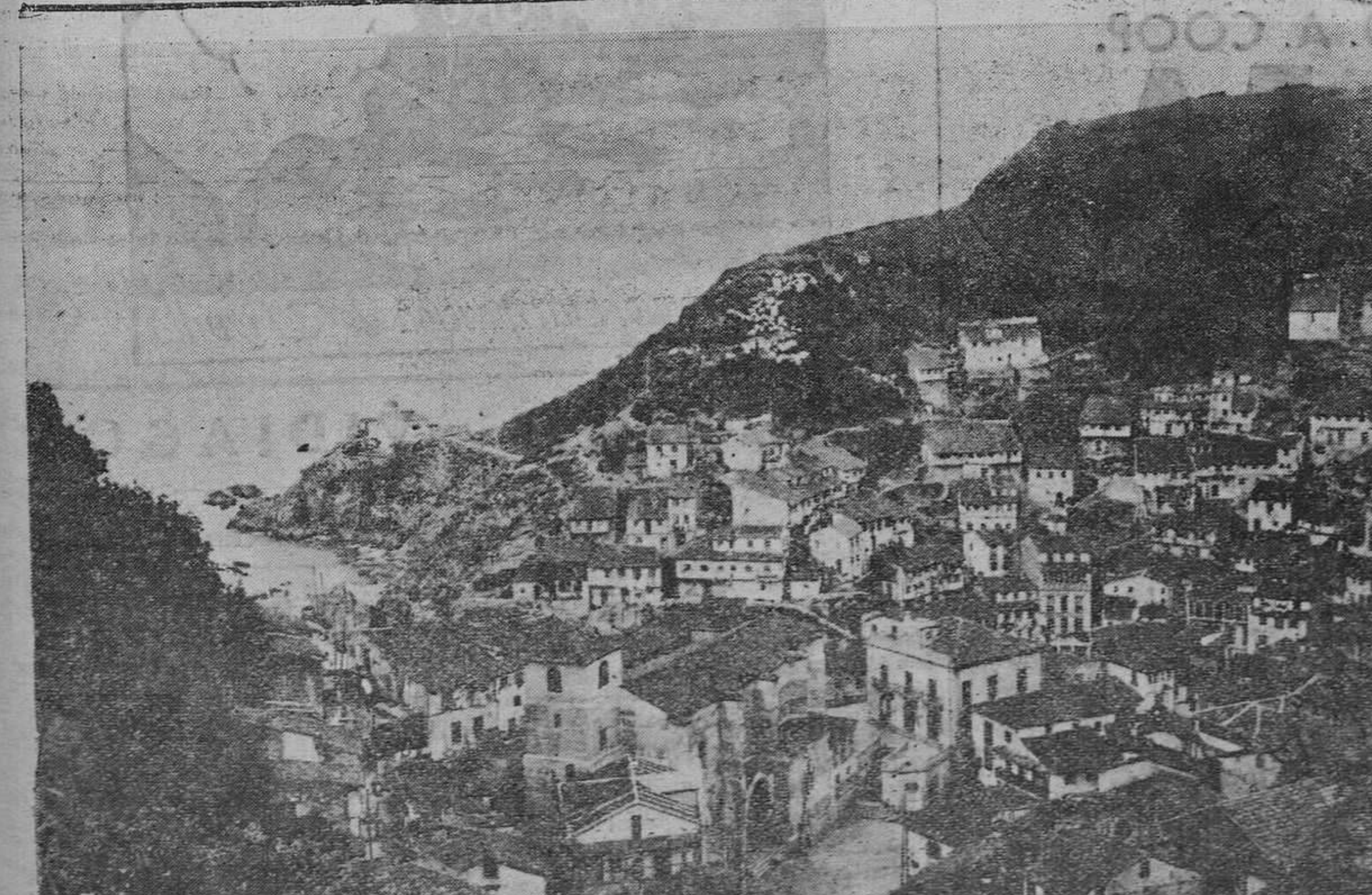
CUDILLERO. VISTA PARCIAL

CUDILLERO.— Una vista parcial del pintoresco pueblo, cuyas casitas enjaibegadas aspiran a conquistar la coronación de la ingente montaña.