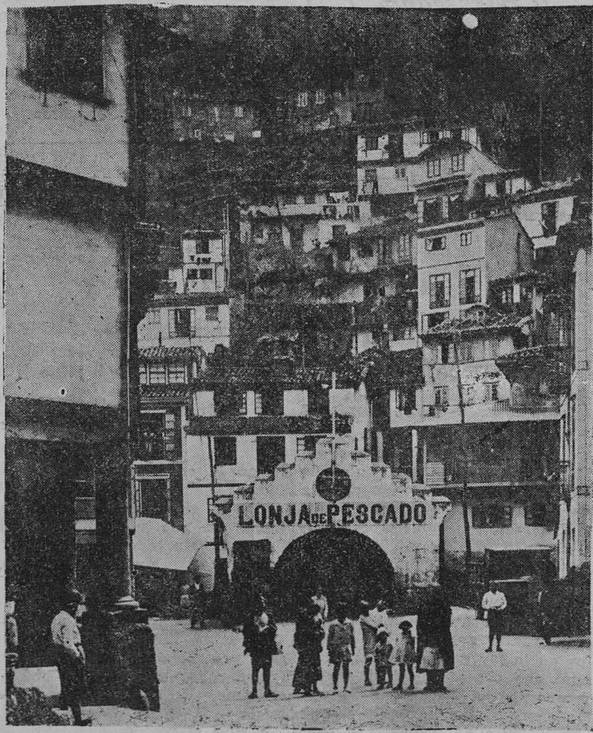
CUDILLERO.— La Lonja de Pesca. En ella está controlada toda la economía del pueblo. Entran en ella peces de irisadas escamas, que se convierten en plata acuñada todos los días en que la pesca copiosa llena las naves del edificio.