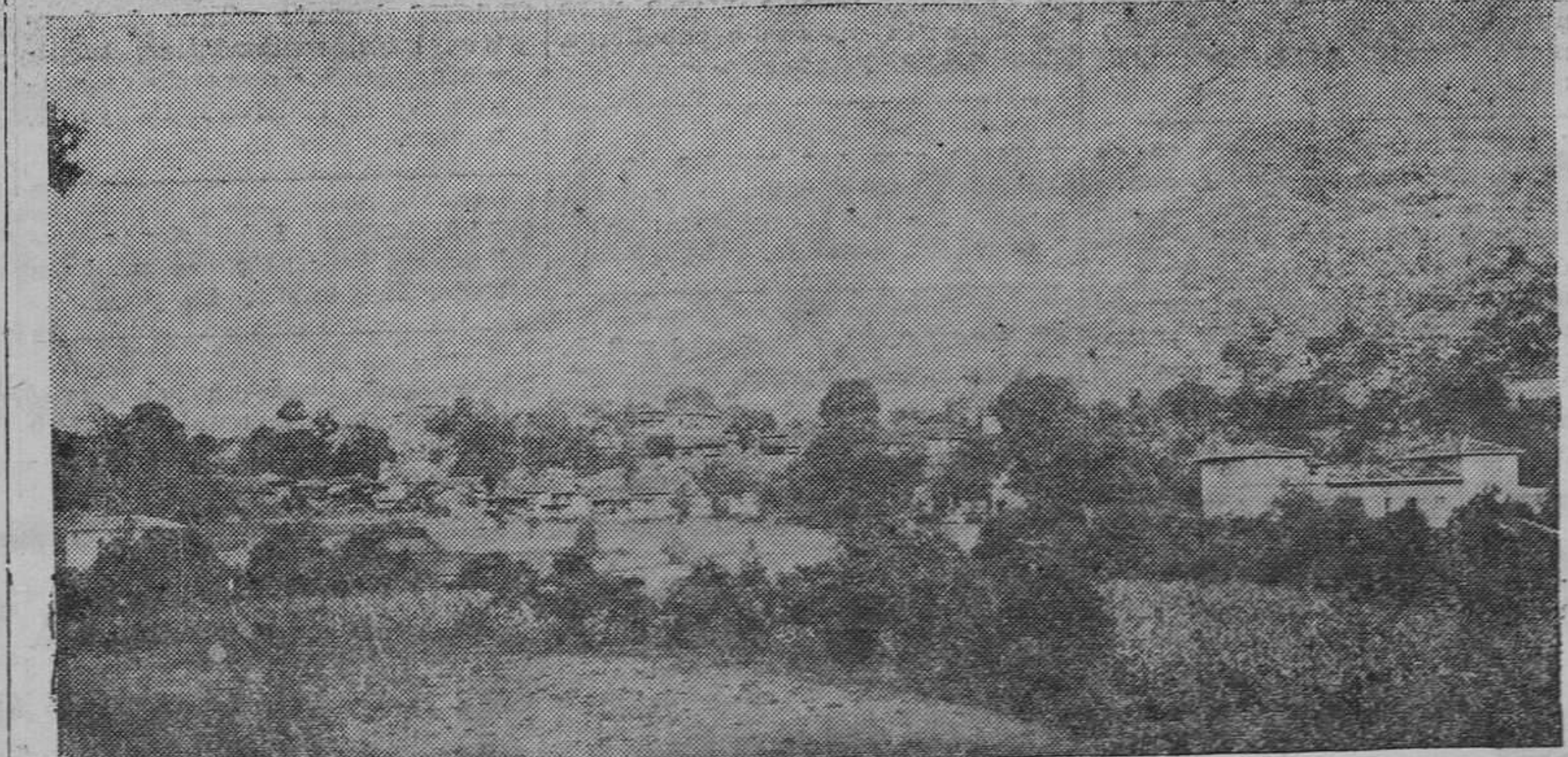
TEVERGA.—El conde de Agüera (†) ha captado con su máquina fotográfica este hermoso paisaje de Peña de La Sobia que es foro auténtico de una escena de ézloga que ofrece ante rincón tevergano.