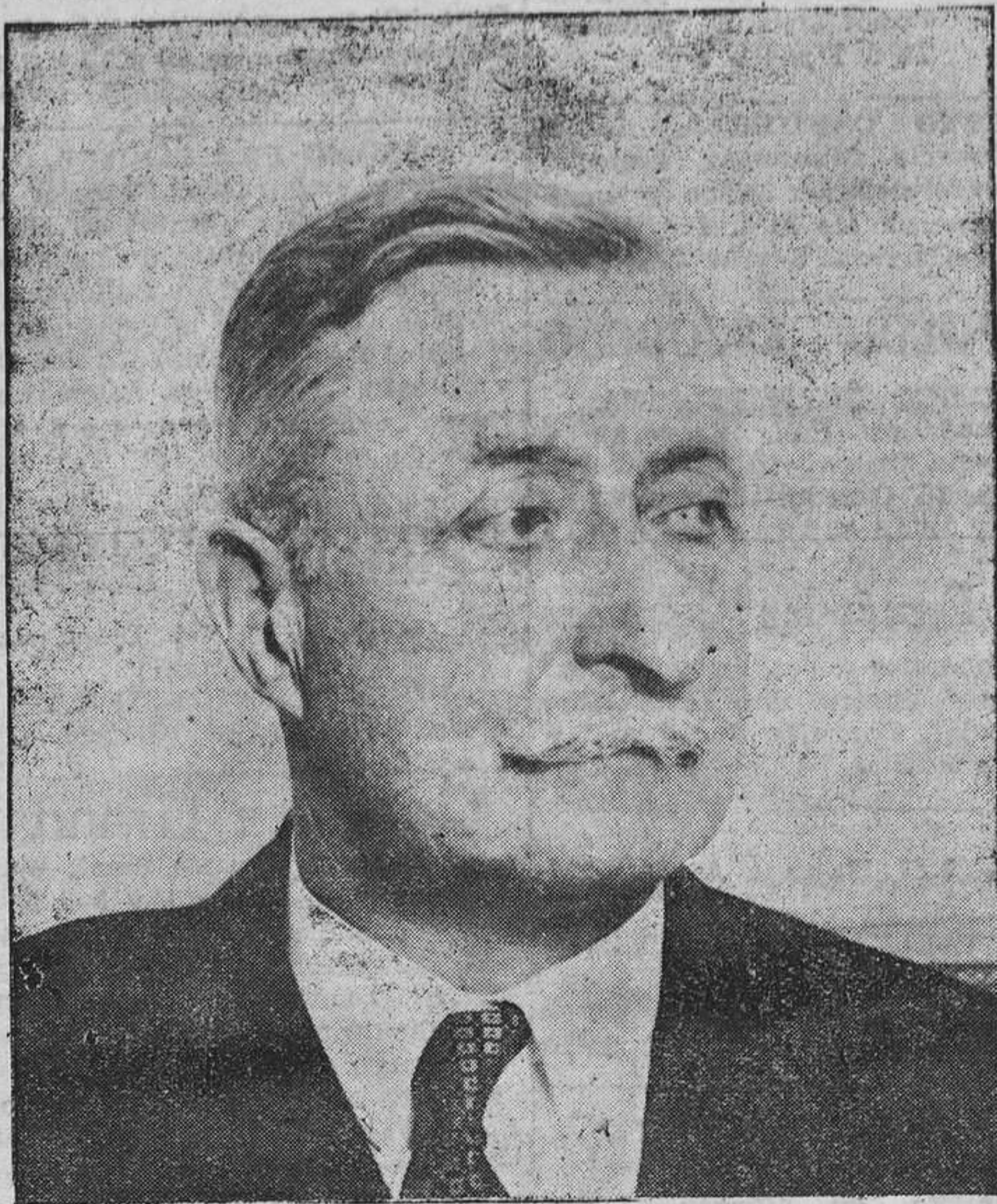
El conde de la Faille que preside la embajada extraordinaria belga que ha venido para anunciar al Presidente de la República el advenimiento al trono del Rey Leopoldo III.