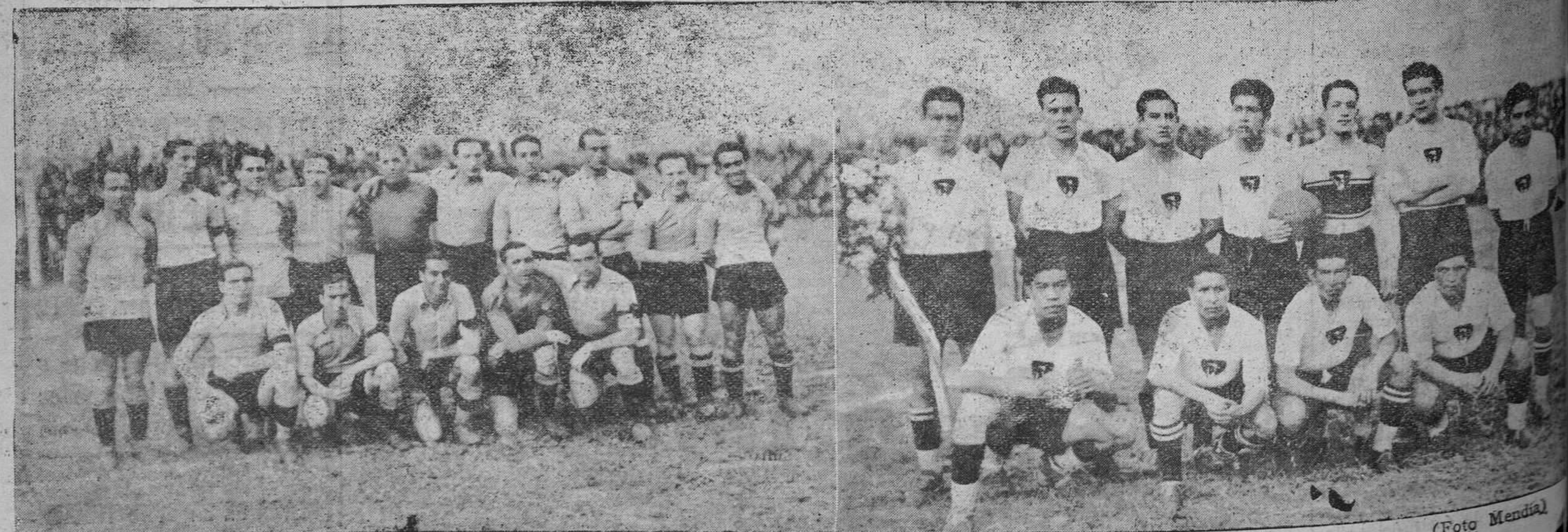
Los equipos nacional de Méjico y selección asturiana que ayer contendieron en el Molinón, venciendo los indígenas por cinco tantos a dos.