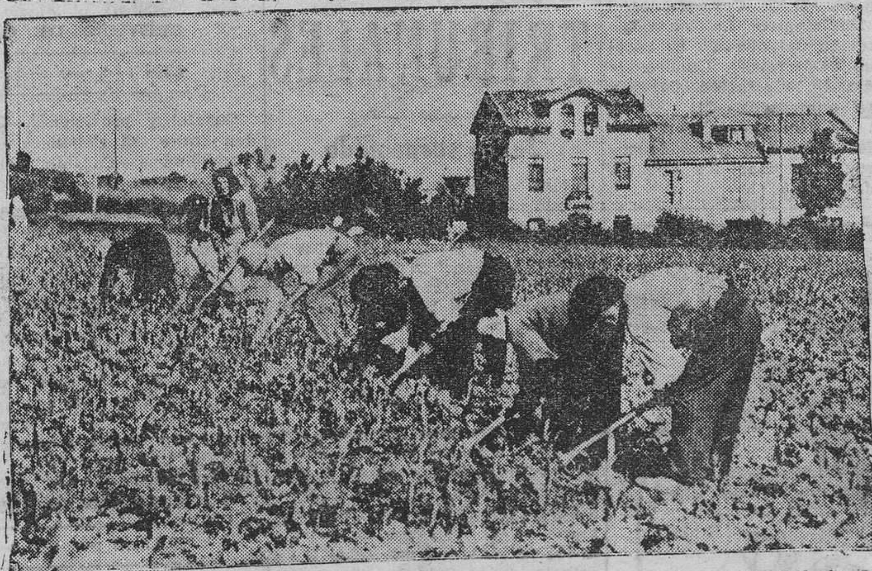
OVIEDO.— En la faena de "sallar" el maíz, estos laboriosos vecinos de los alrededores de la ciudad ponen un afán revelador de que saben que el trabajo honrado es prenda segura de bienestar. ¡Que vayan hablandoles a ellos de la huelga de cam pesinos!