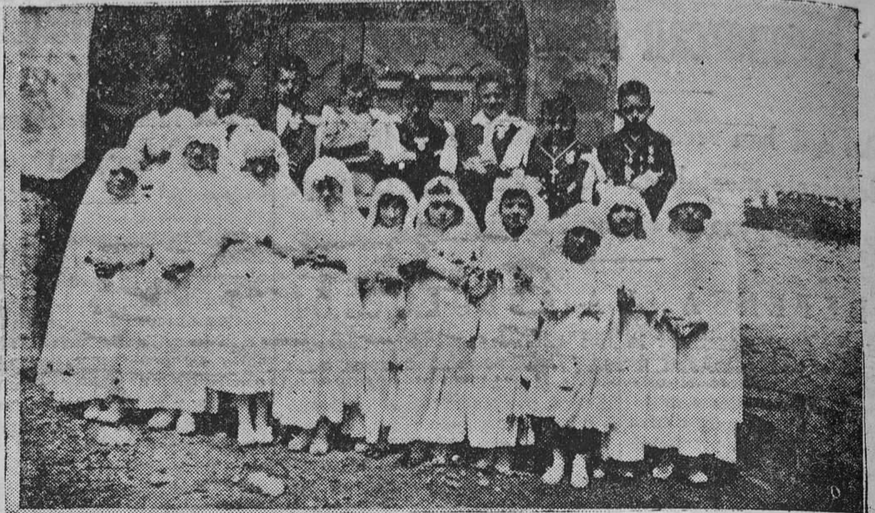
LENA.— Grupo de niños y niñas del Catecismo parroquial de Columbello, que hicieron la Primera Comunión.