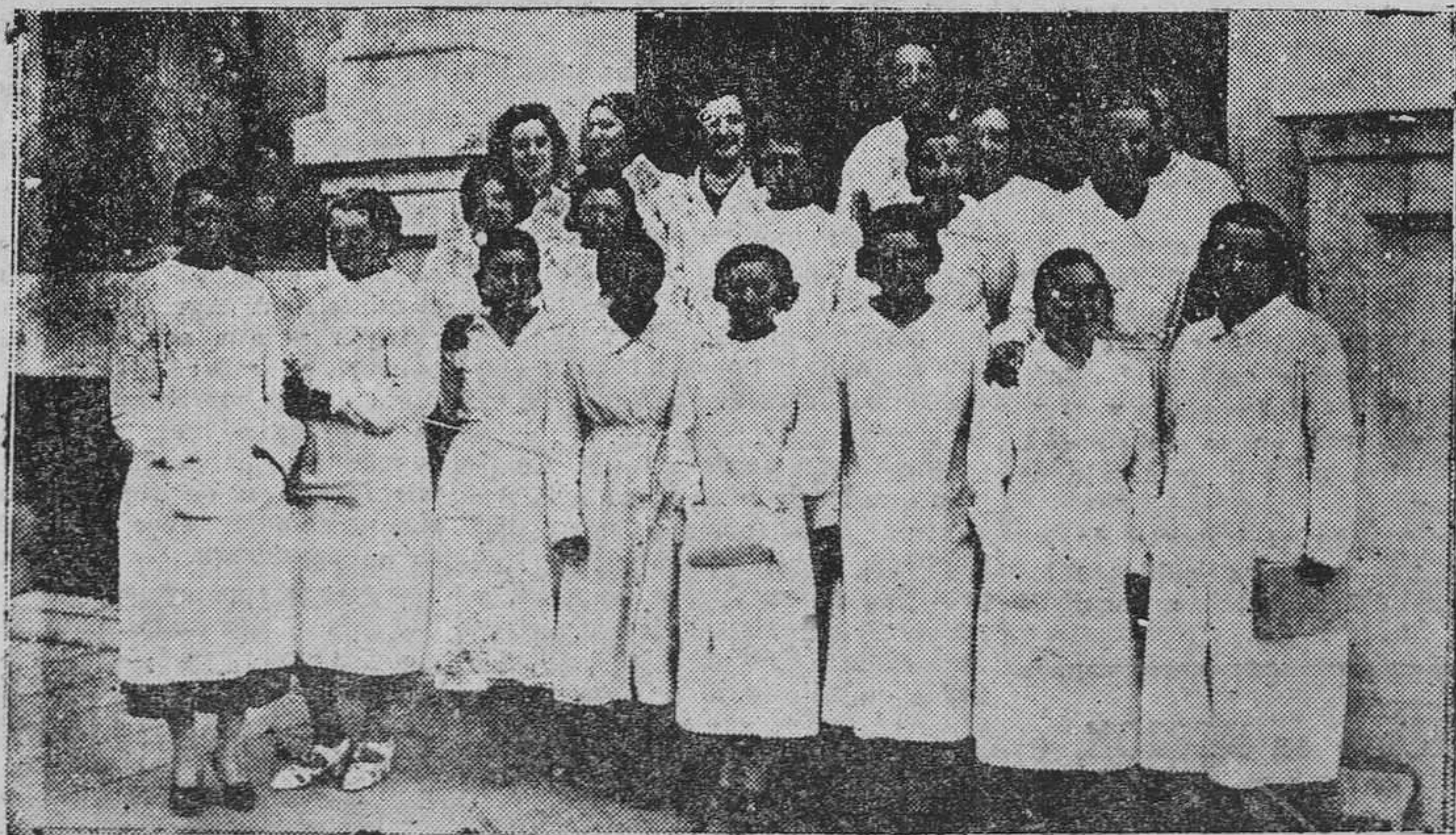
OVIEDO.— Grupo de señoritas cursaron el primer año de Maestras Puericultoras y Niñeras Enfermeras en el Instituto de Puericultura de Oviedo.

Necesitándose adquirir una máquina de escribir para este Establecimiento, pueden las Casas que tengan interés en ello, hacer ofertas de precios y condiciones en las oficinas de aquí, hasta fines del mes actual, todos los días laborables, horas de 9 a 1 y media.