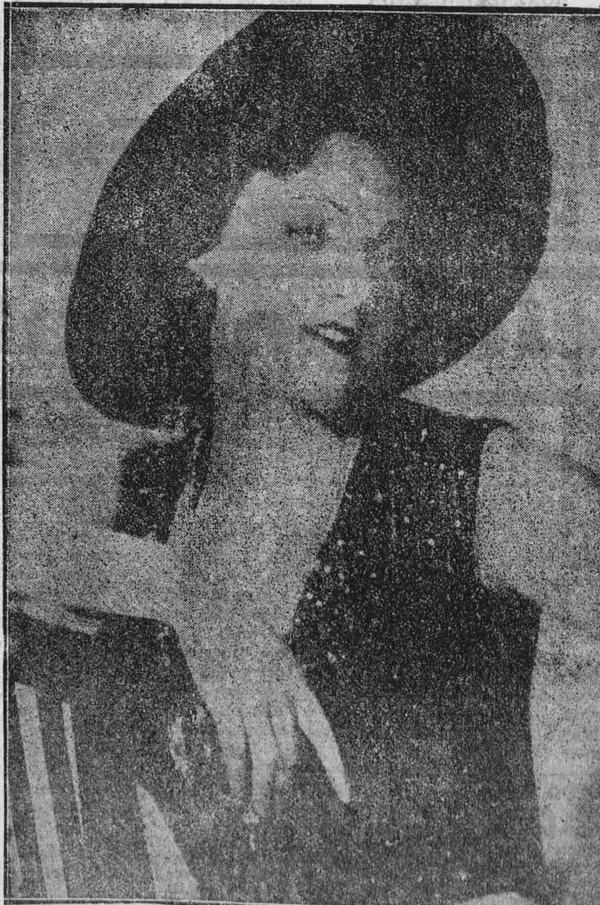
Lola-Lola, una de las más graciosas actrices del cinematógrafo francés.