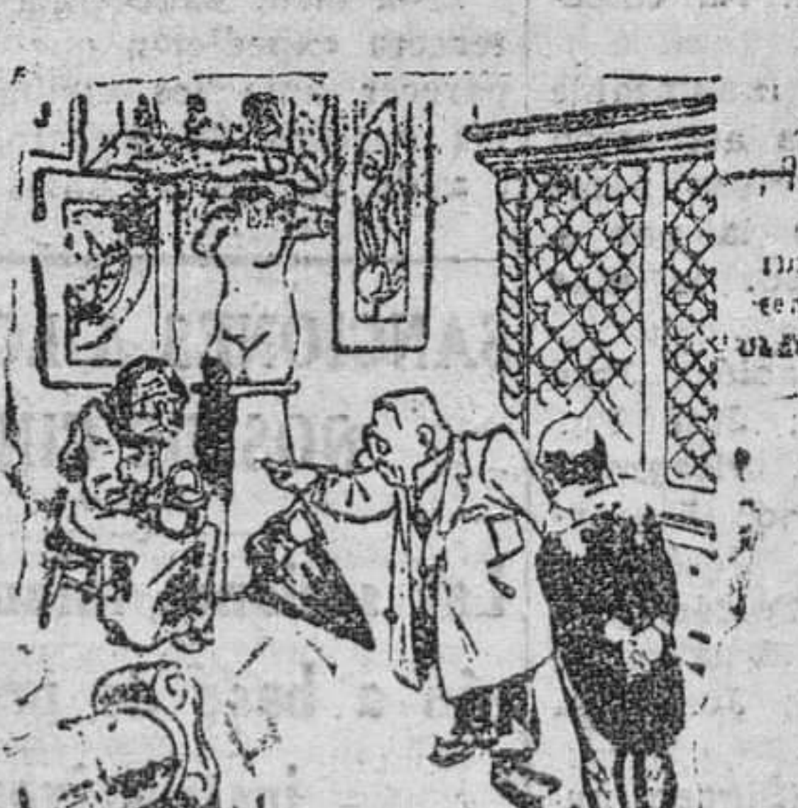
El cliente miope.—Aquí lo único verdaderamente antiguo es esa figura de ahí. El anticuario.—Como que es mi abuela.