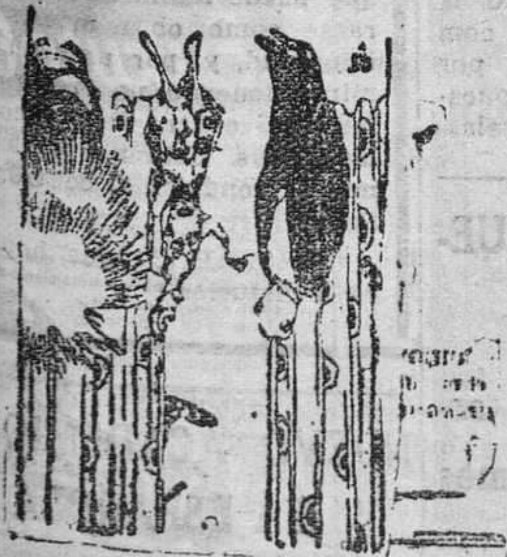
—Mi marido me regala siempre una perla por mi cumpleaños. —¿Caramba! ¿Y qué hace usted con tantísima perla.

Desde Asturias han comenzado a expedirse despachos conteniendo aquella petición y es de esperar que quienes no lo hayan hecho se apresuren a cumplir con un deber que les imponen sus conciencias.