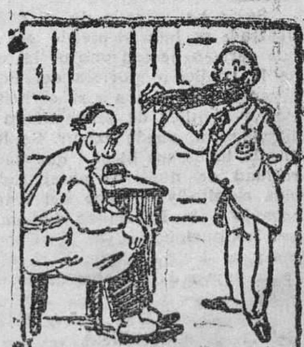
El especialista de enfermedades mentales: —¿Alguna extravagancia? —Sí, señor. Que me recojo la barba con un "clip".