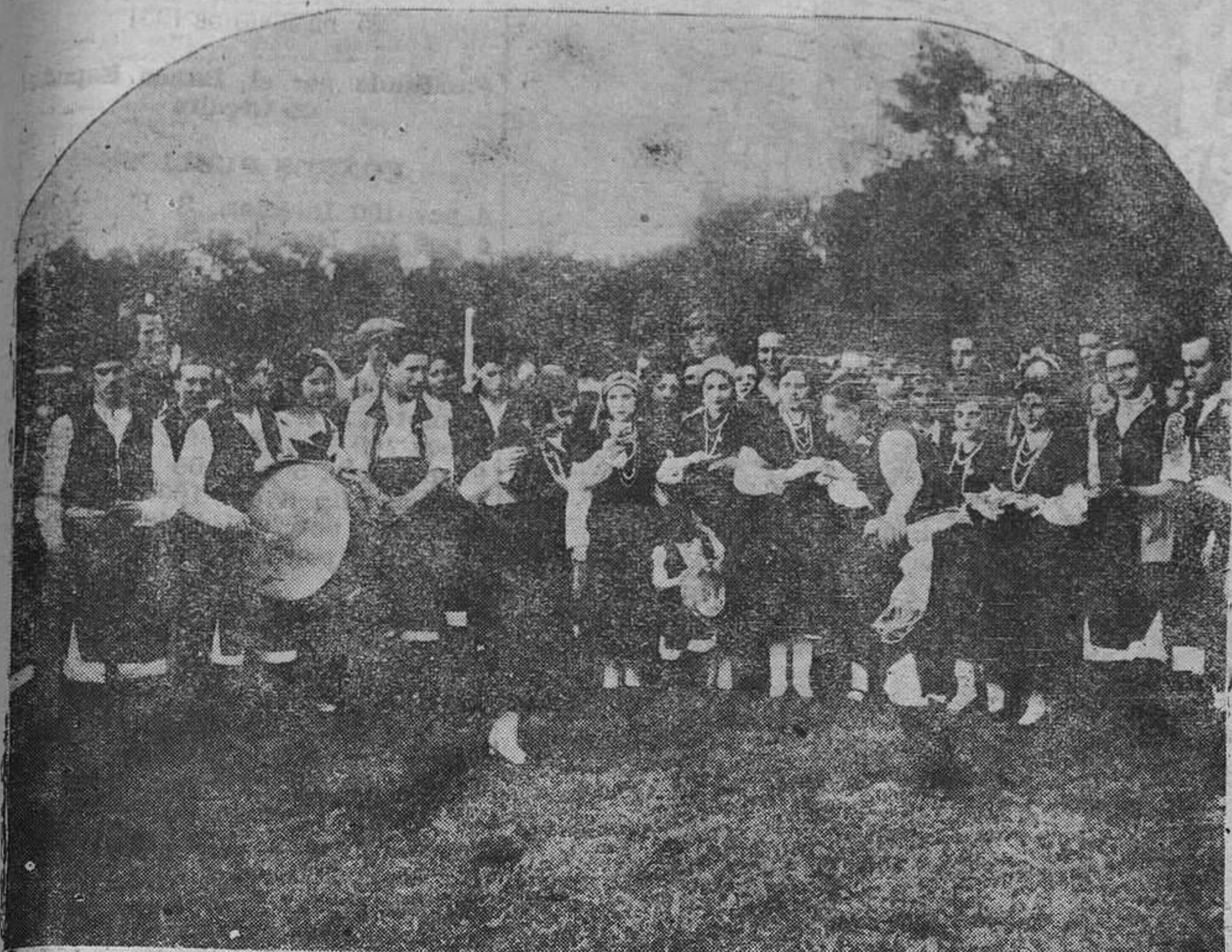
MADRID.—Tipos gallegos que tomaron parte en la cabalgata celebrada durante las fiestas de la República.