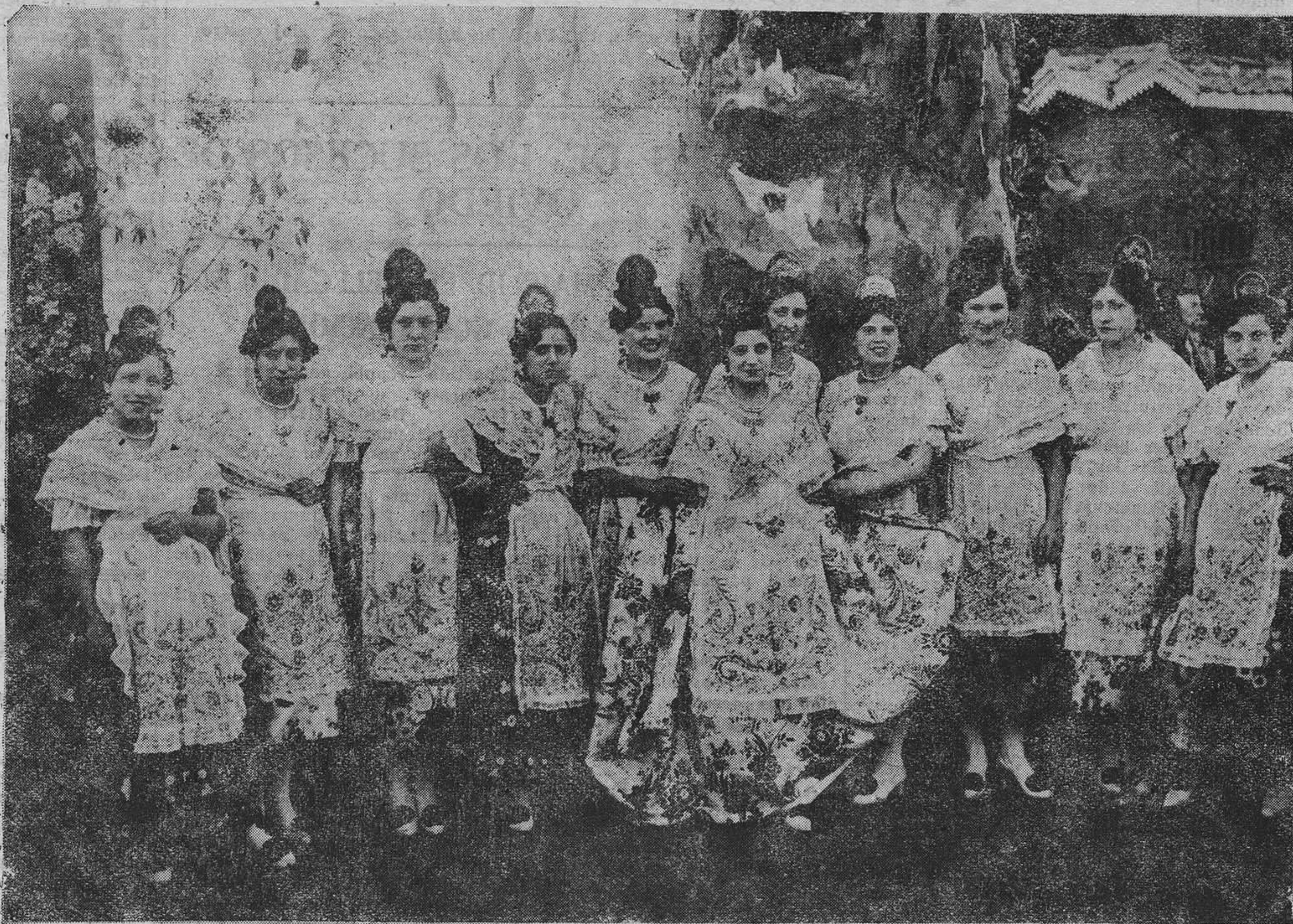
MADRID.—Grupo de Valencianas que tomaron parte en la cabalgata celebrada durante las fiestas de la República.