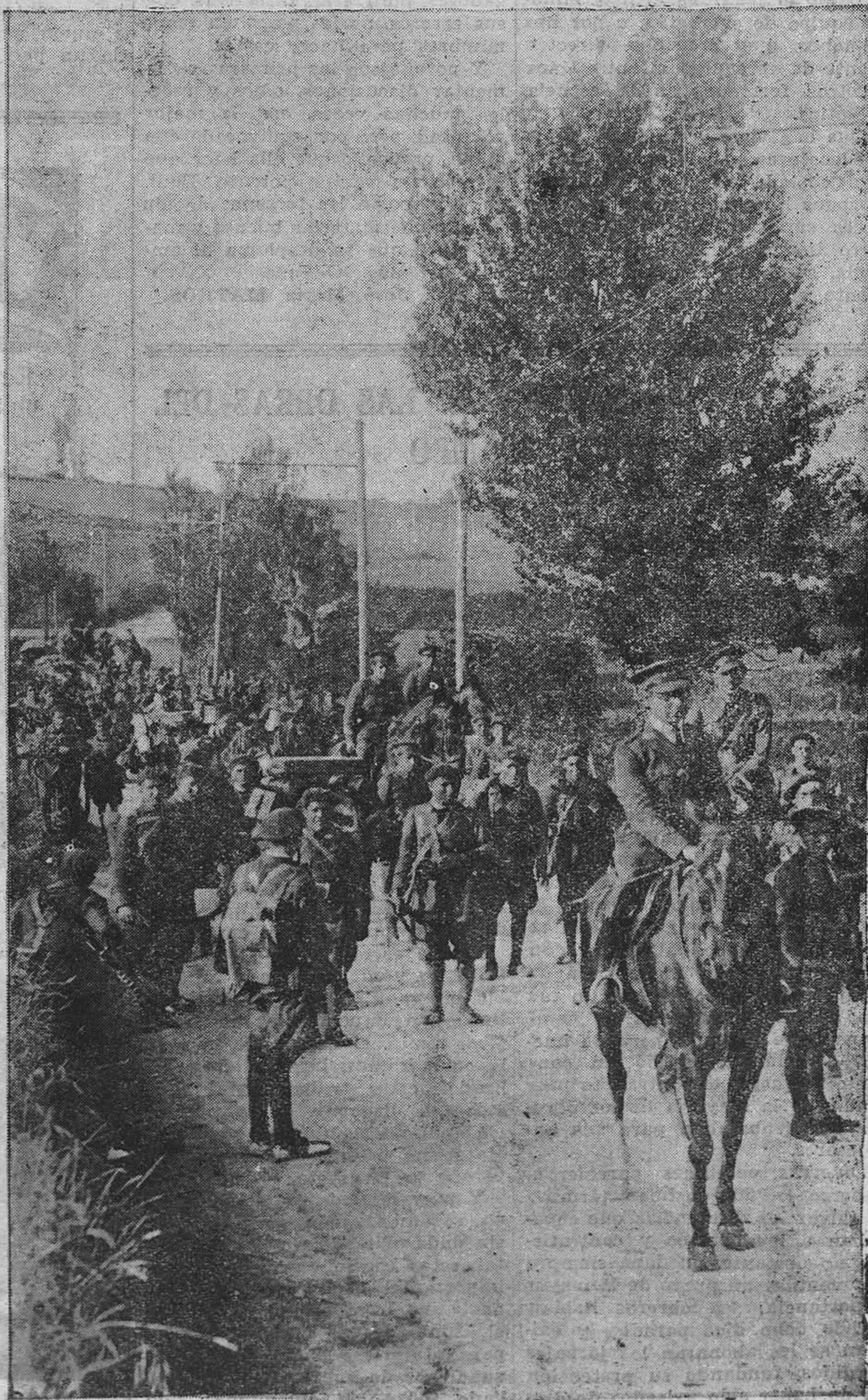
OVIEDO.—Las fuerzas del Tarragona durante la jornada de ayer, camino de la capital.