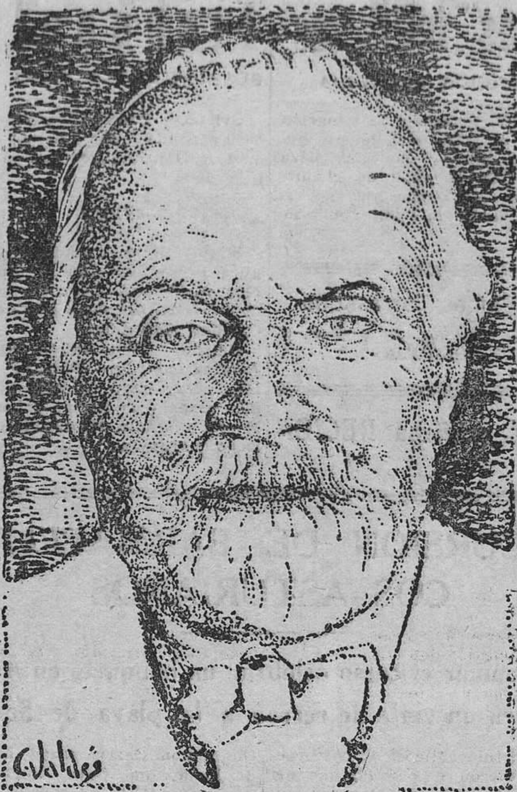
El ilustre novelista asturiano don Armando Palacio Valdés, que se encuentra enfermo hace algunos días.

PLATO DEL DIA SERVICIO A LA CARTA HELADOS-REPOSTERIA