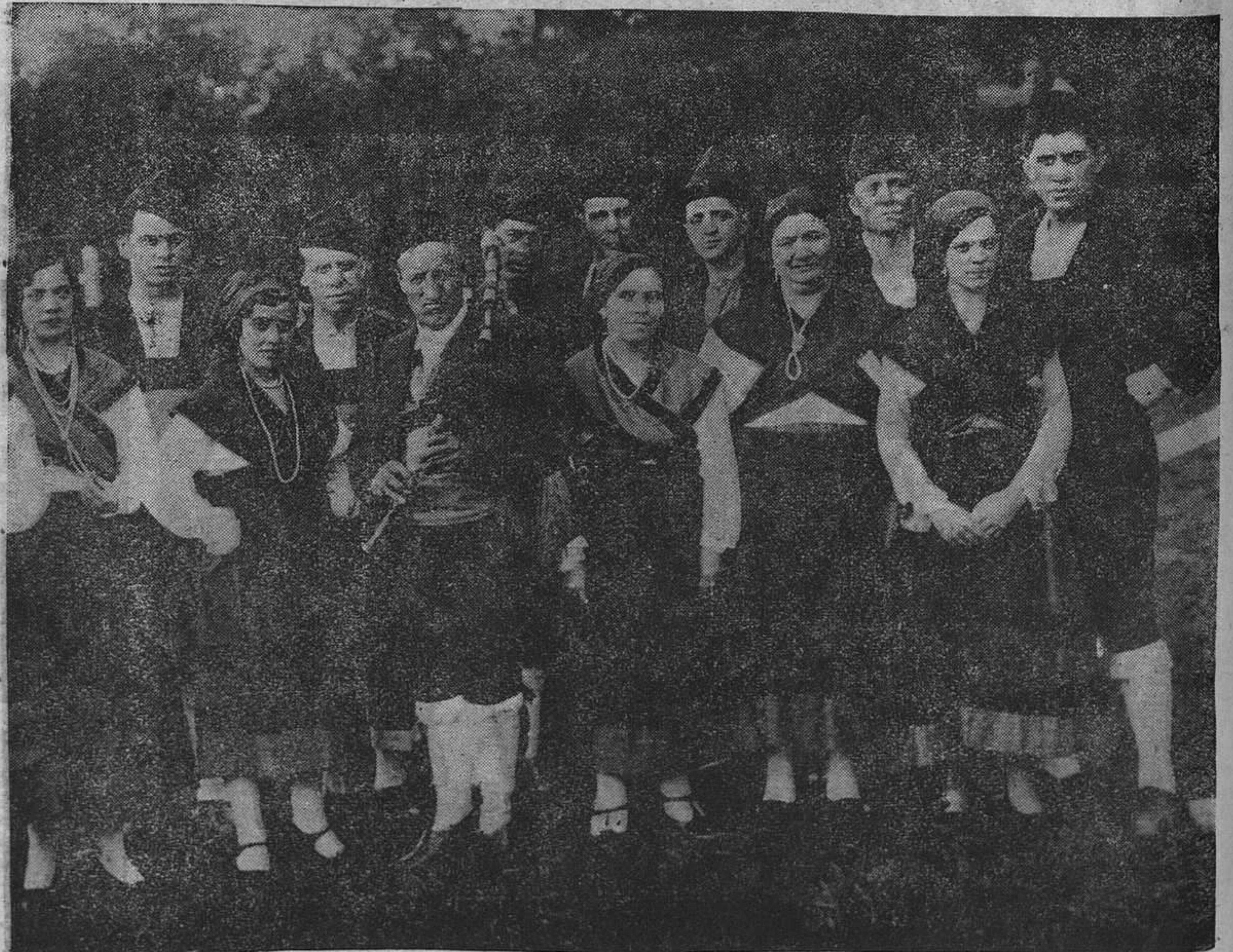
MADRID.—Representación regional asturiana que tomó parte en la cabalgata celebrada en las actuales fiestas de la República.

Reconstituyente eficaz en convalecencias, anemia, cansancio cerebral y regulador del sistema nervioso.