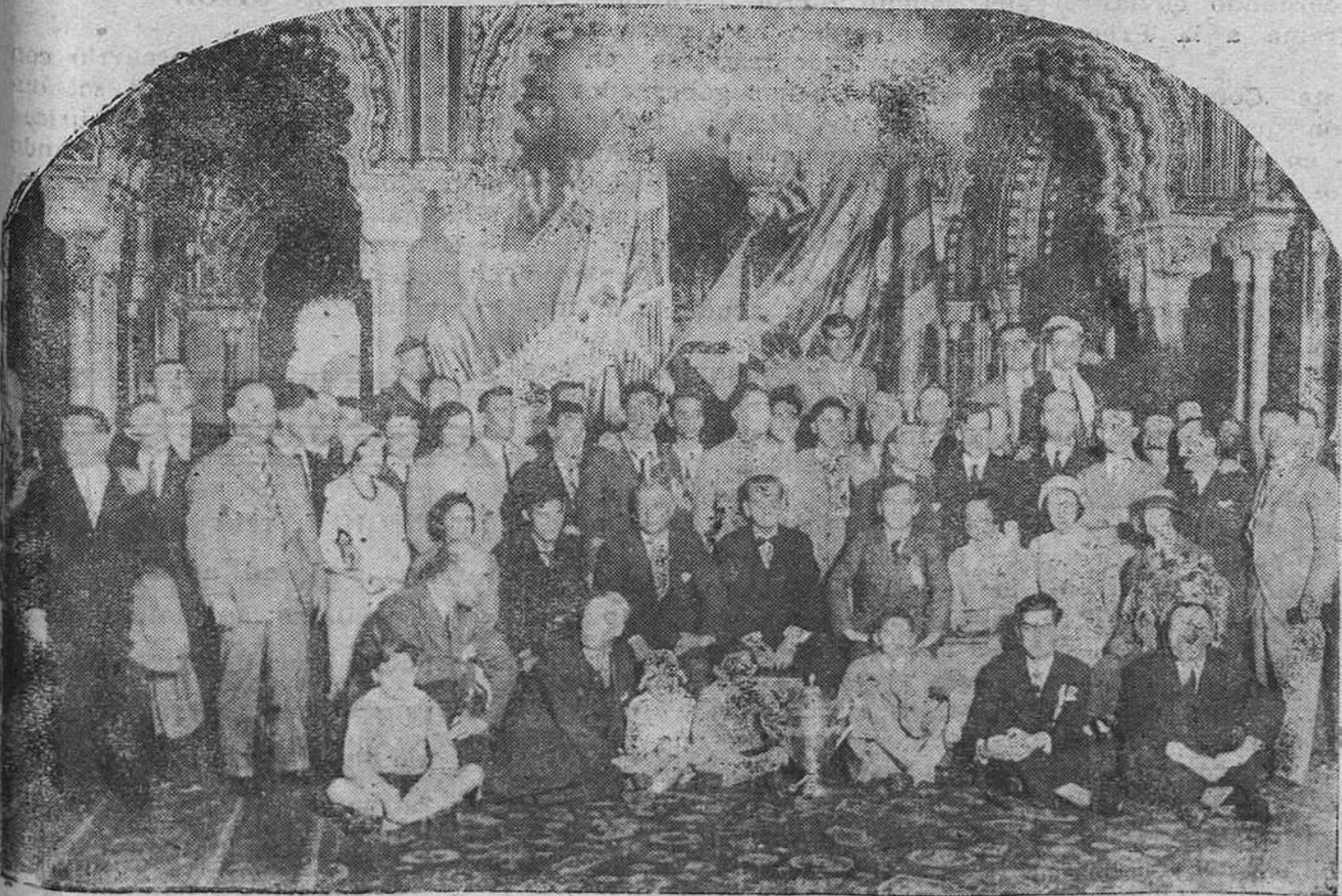
BILBAO.—Los equipiers del Athletic Club, campeón de España, son recibidos por el alcalde en el salón árabe del Ayuntamiento a su regreso a la invicta villa, donde fueron recibidos con grandes muestras de entusiasmo.