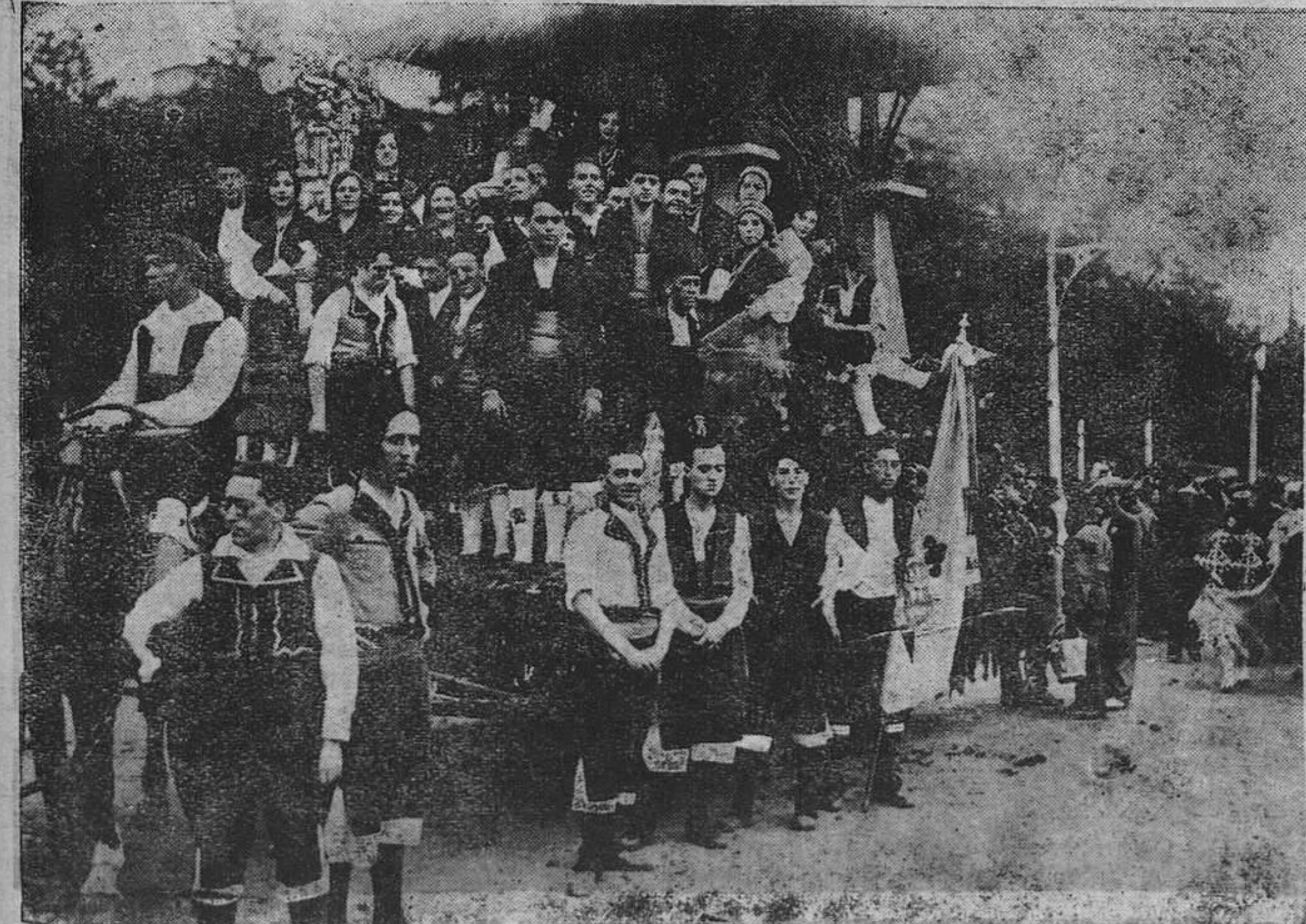
MADRID.—La carreras de Asturias y Galicia que tomó parte en la cabalgata de las fiestas de la República.