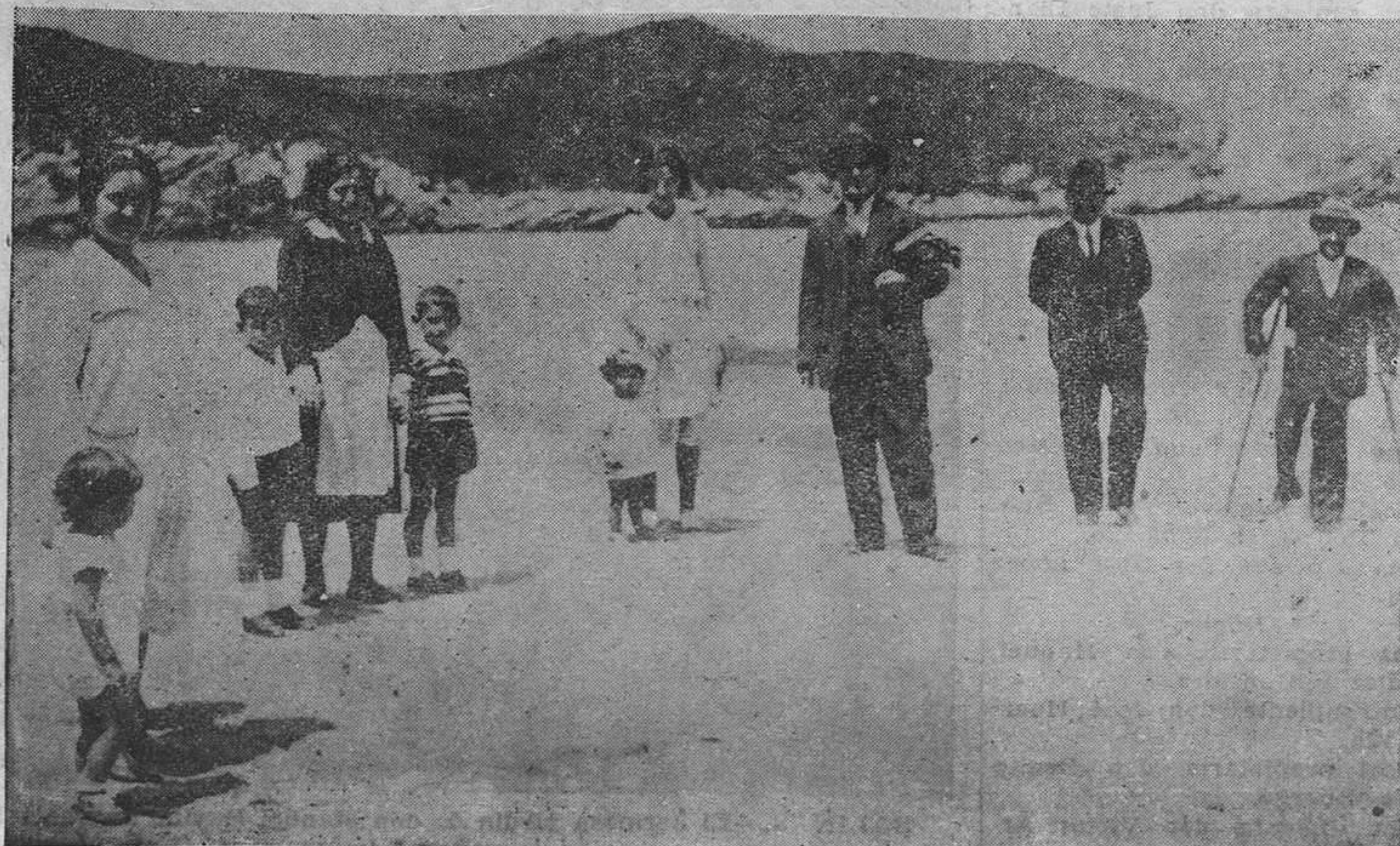
SALINAS.— Los primeros veraneantes en esta pintoresca playa.

El general Pignatelli, que fué el encargado de descender el lienzo que ocultaba el monumento, pronunció después de efectuada esta operación, un vibrante discurso, en el que cantó las glorias del Regimiento de Alcántara.