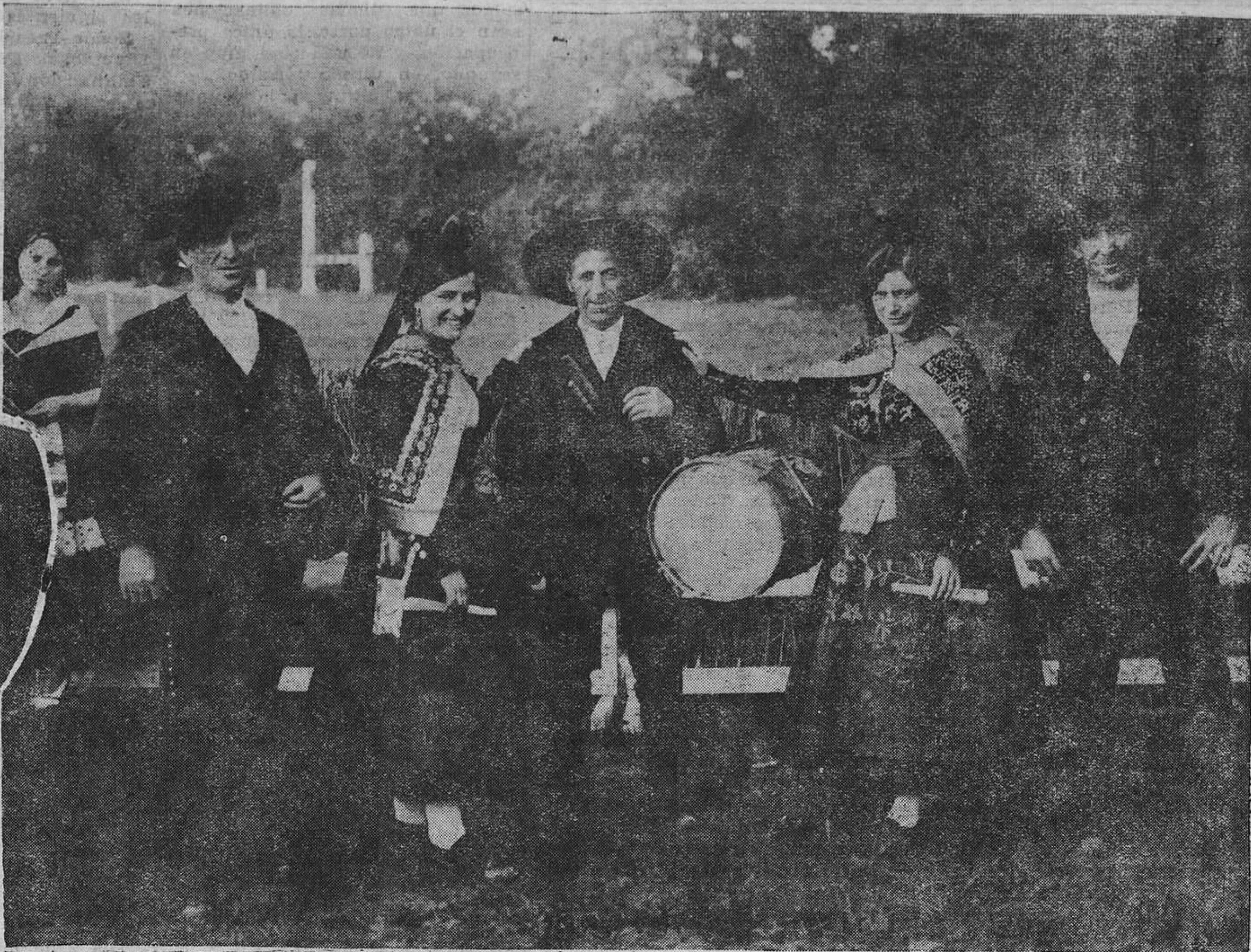
MADRID.— Representación de Candelario (Salamanca), que formó en la cabalgata celebrada con motivo de las fiestas de la República.