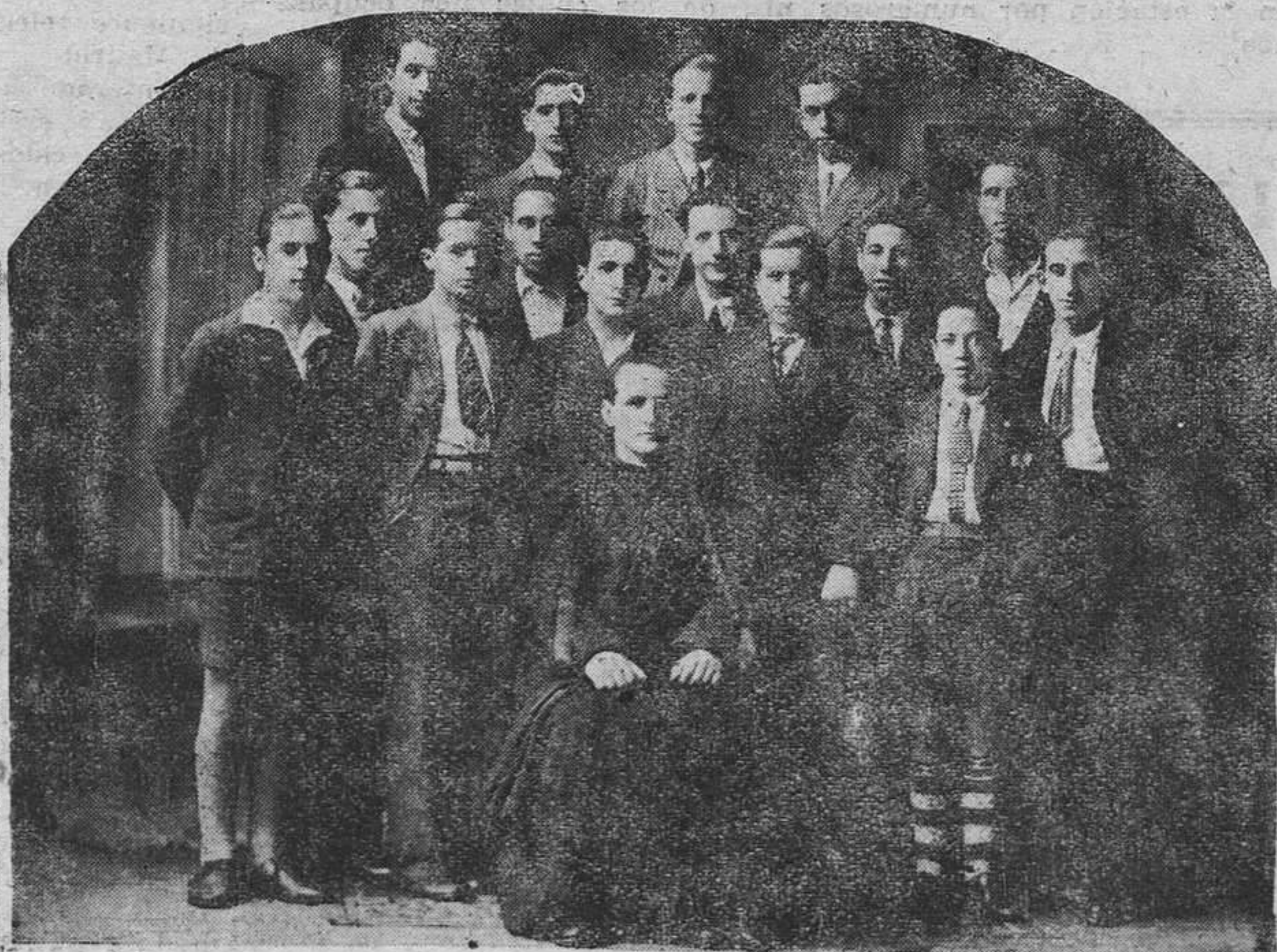
Coro "El Ampurdán", dirigido por el señor sochantre de San Nicolás de Avilés, que tomó parte en las fiestas solemnísimas que los PP. franciscanos de dicha villa dedicaron al Santo de Padua en las centenarias de su canonización.