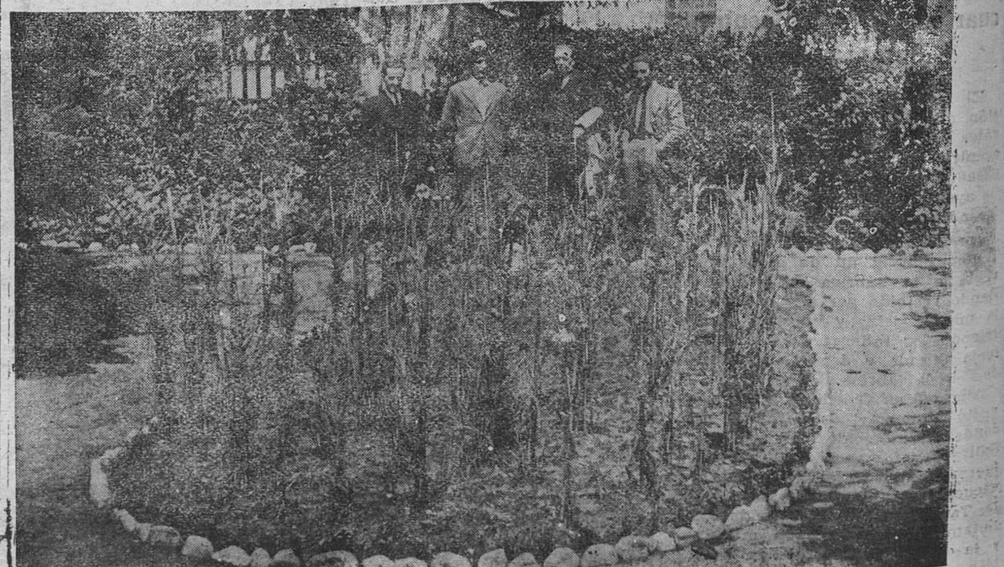
SALINAS. —El hermoso jardín de don Manuel Buyla, en que afloran magníficos claveles y odoran los macizos. (Foto Mena).