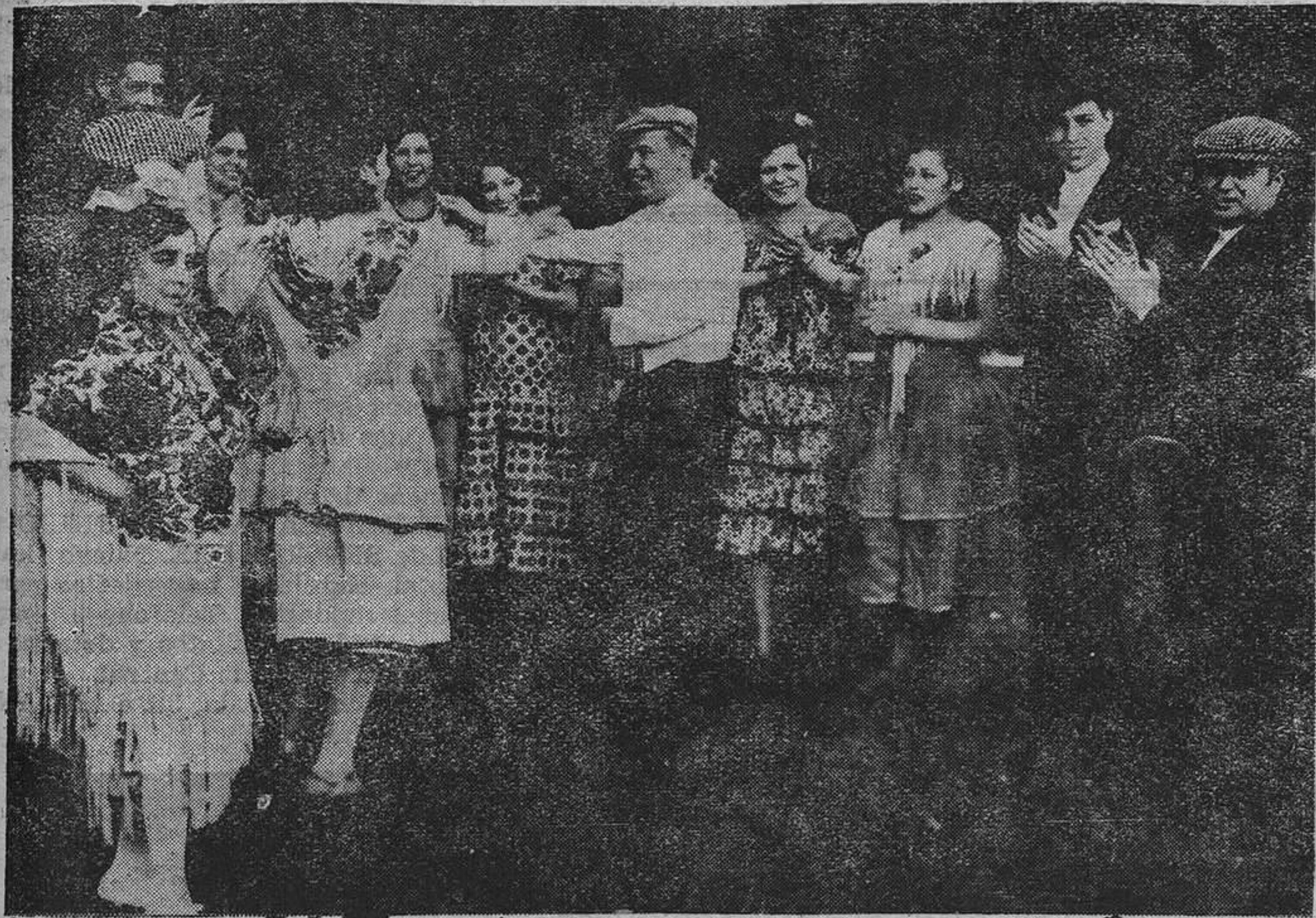
MADRID.—De la cabalgata celebrada durante las fiestas de la República. Grupo que figuraba en la representación de Andalucía..