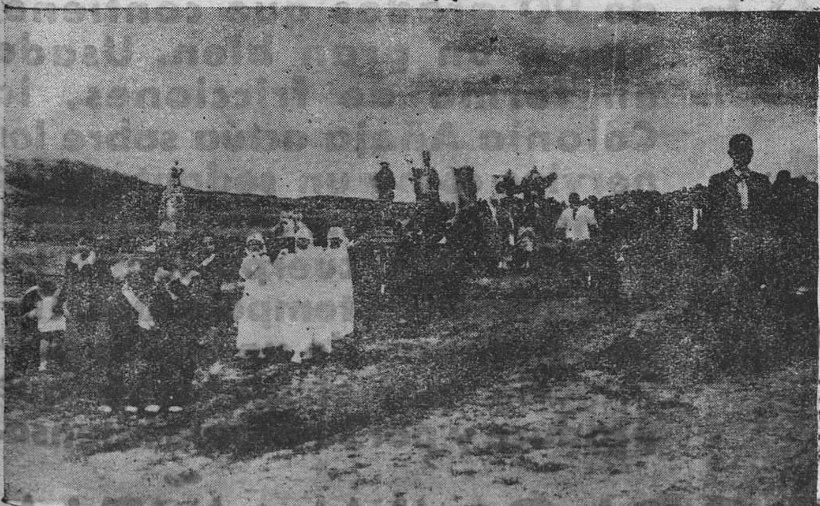
SAN MARTIN DE ANES.—Un detalle de la procesión del Corpus..

de Oviedo, que requirió la custodia por medio de fuerzas de la Guardia civil y policía, lo que dio lugar a cierto revuelo, por haberse supuesto que el canónigo mencionado había sido detenido.