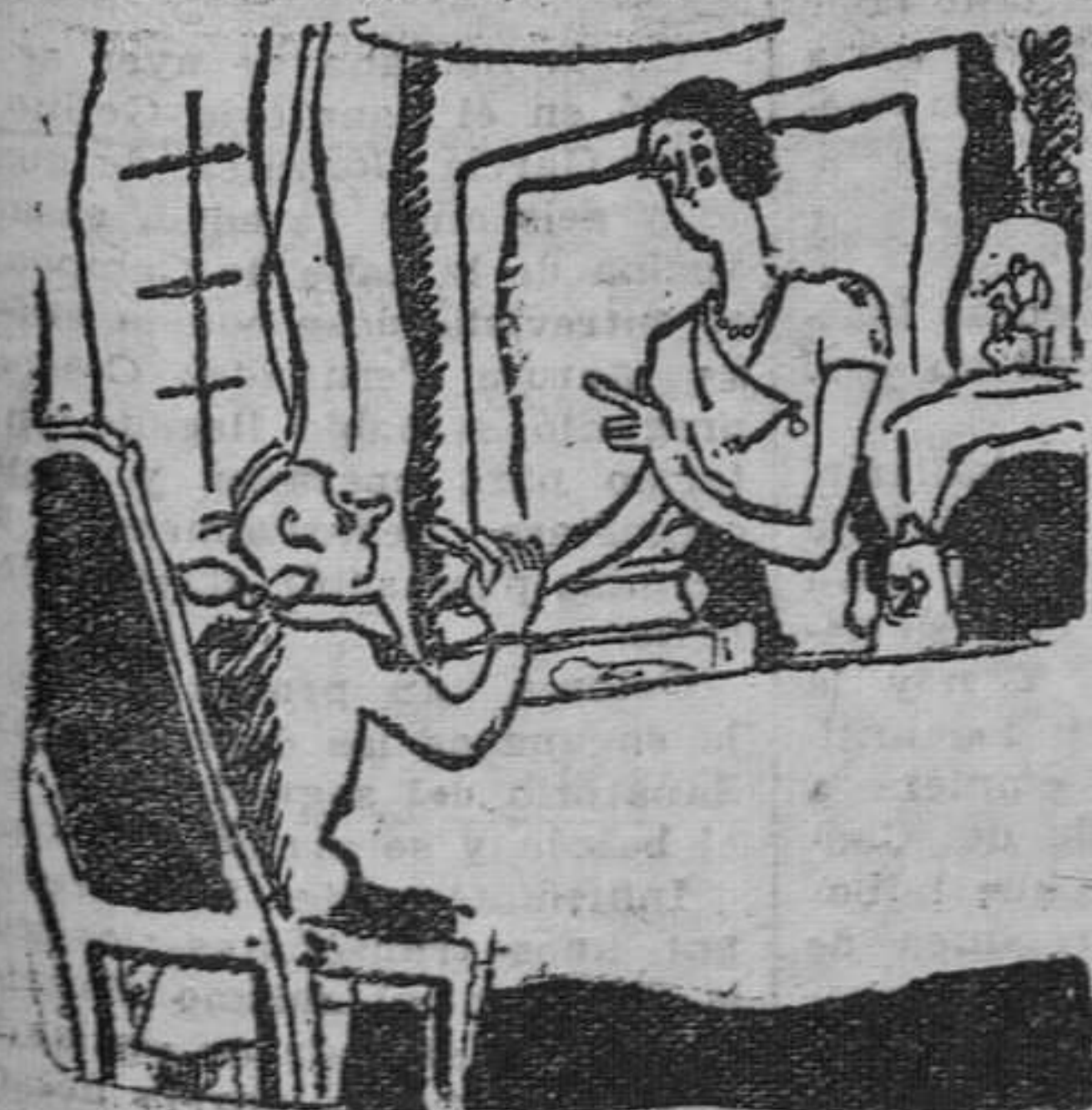
—No contas más, que te vas a poner enfermo. —Será tuya la culpa. Si no me como este pastel habré comido trece, y este número trae mala suerte.