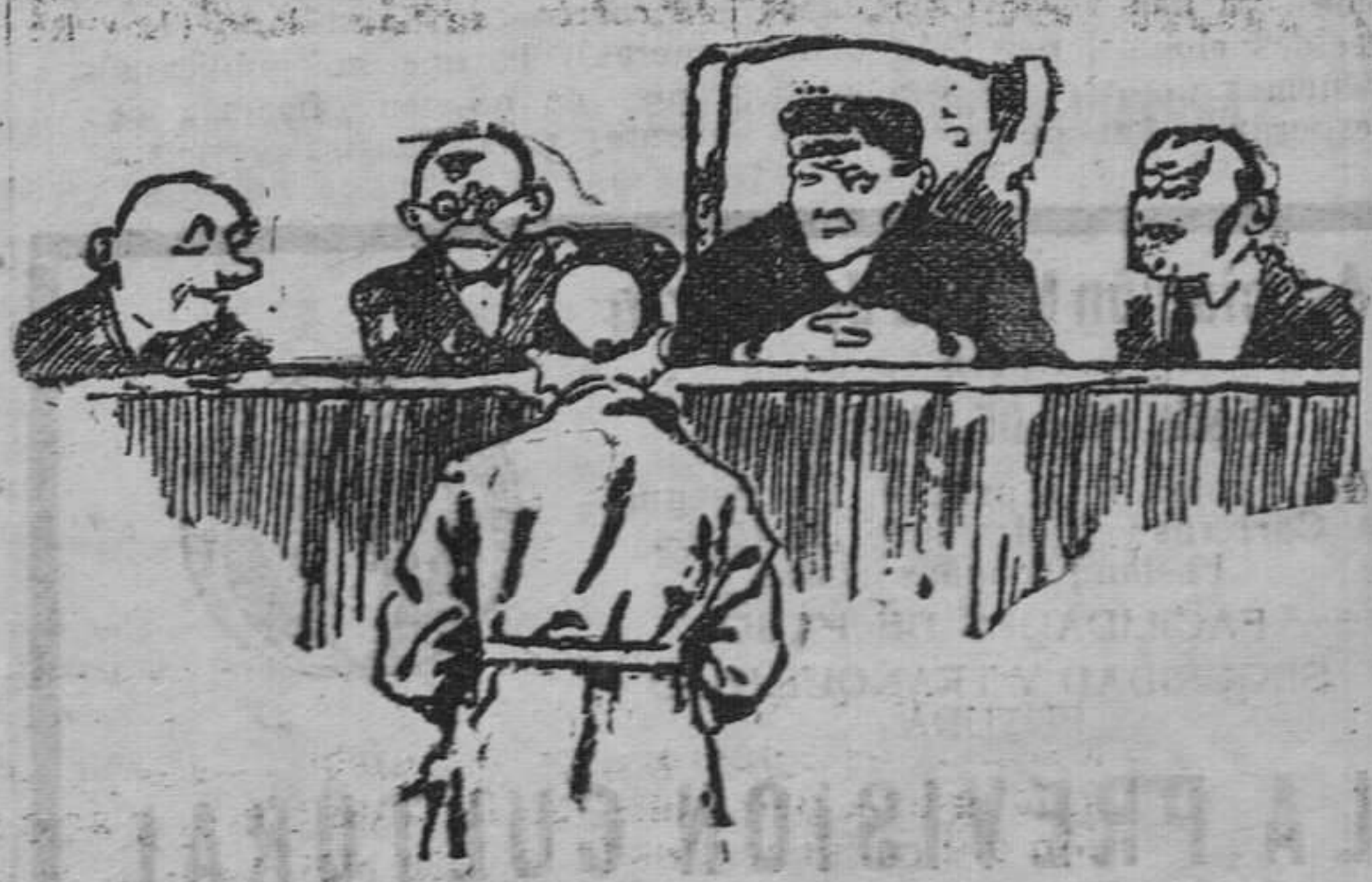
—¿Estaba usted jugando con cartas marcadas? —Sí. Es que yo estoy cansado de los juegos de azar.