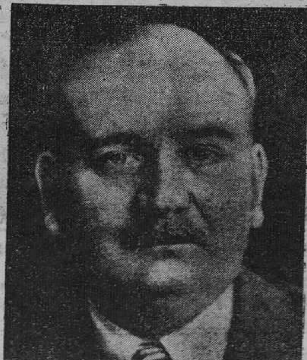
PARIS.—M. P. E. Flandin, presidente de la Alianza Democrática que hará un llamamiento a los partidos políticos para la deflacción presupuestaria

Las exportaciones al Reino Unido y Canadá descendieron de valor en 167.510.808 dólares y 154.930.618 dólares respectivamente. Las importaciones de Inglaterra sufrieron una reducción a 60.763.705 de 74.688.706 dólares que sumaban el año anterior y las importaciones del Canadá bajaron de 174.101.308 dólares a 60.763.705. Alemania adquirió en los Estados Unidos mercancías por valor de 133.471.862 dólares cuando en 1931 el valor de sus compras fué de 166.049.927 y vendió a los Estados Unidos por valor de 73.521.439 contra 127.038.893 que vendió en el año anterior. El Japón compró por valor de 134.537.384 dólares mientras que en el año anterior sus compras alcanzaron la cifra de 155.715.052 dólares, y vendió a Norteamérica mercancías por valor de 134.011.311 dólares en comparación 206.349.370 que vendió en el año anterior.