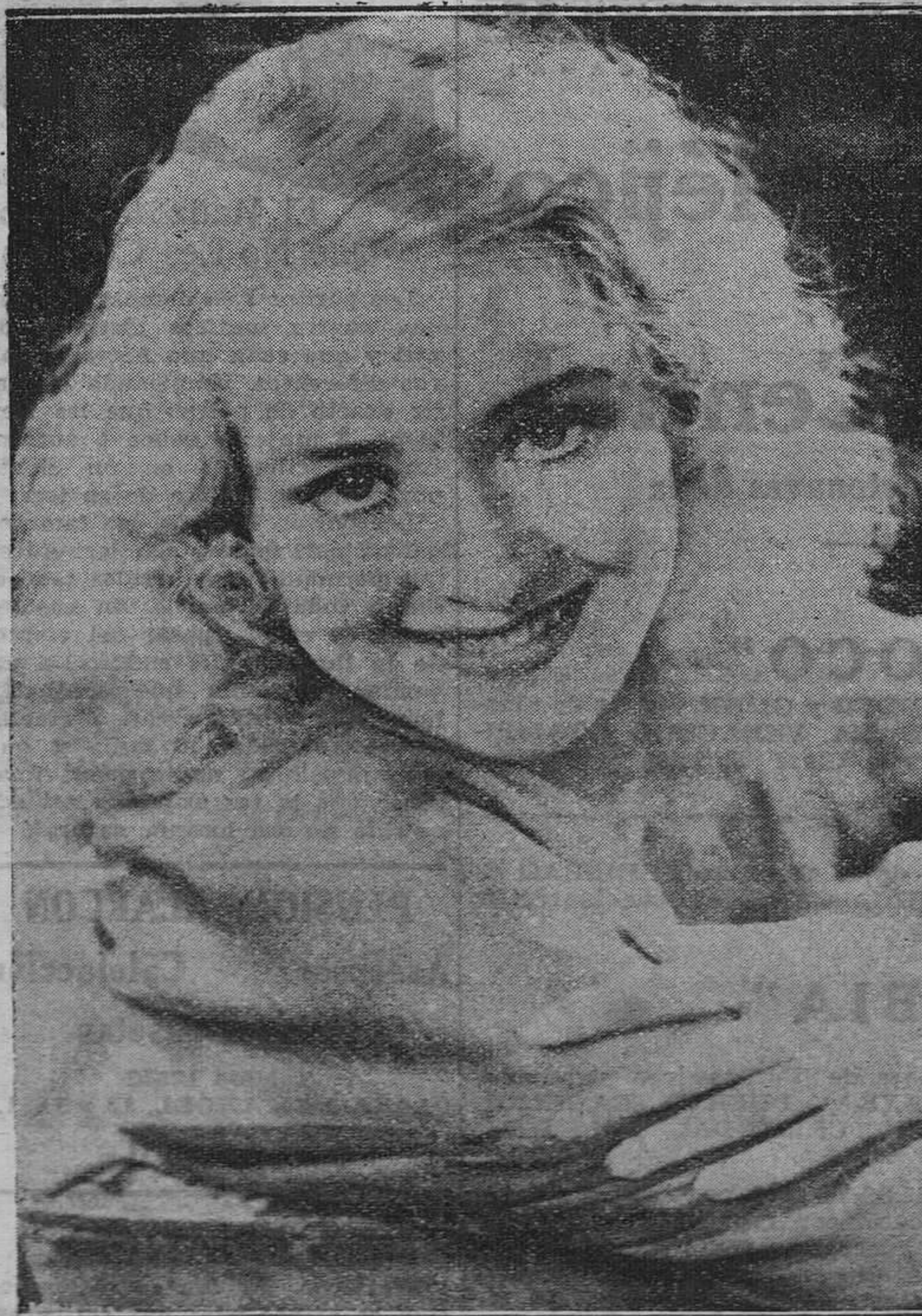
Durante la temporada actual hemos admirado ya en varias películas la rubia y cándida belleza de Marien Marsh, encantadora ingenua y admirable actriz, que en cada una de ellas sube con paso firme un escalafón hacia la cima del séptimo arte.