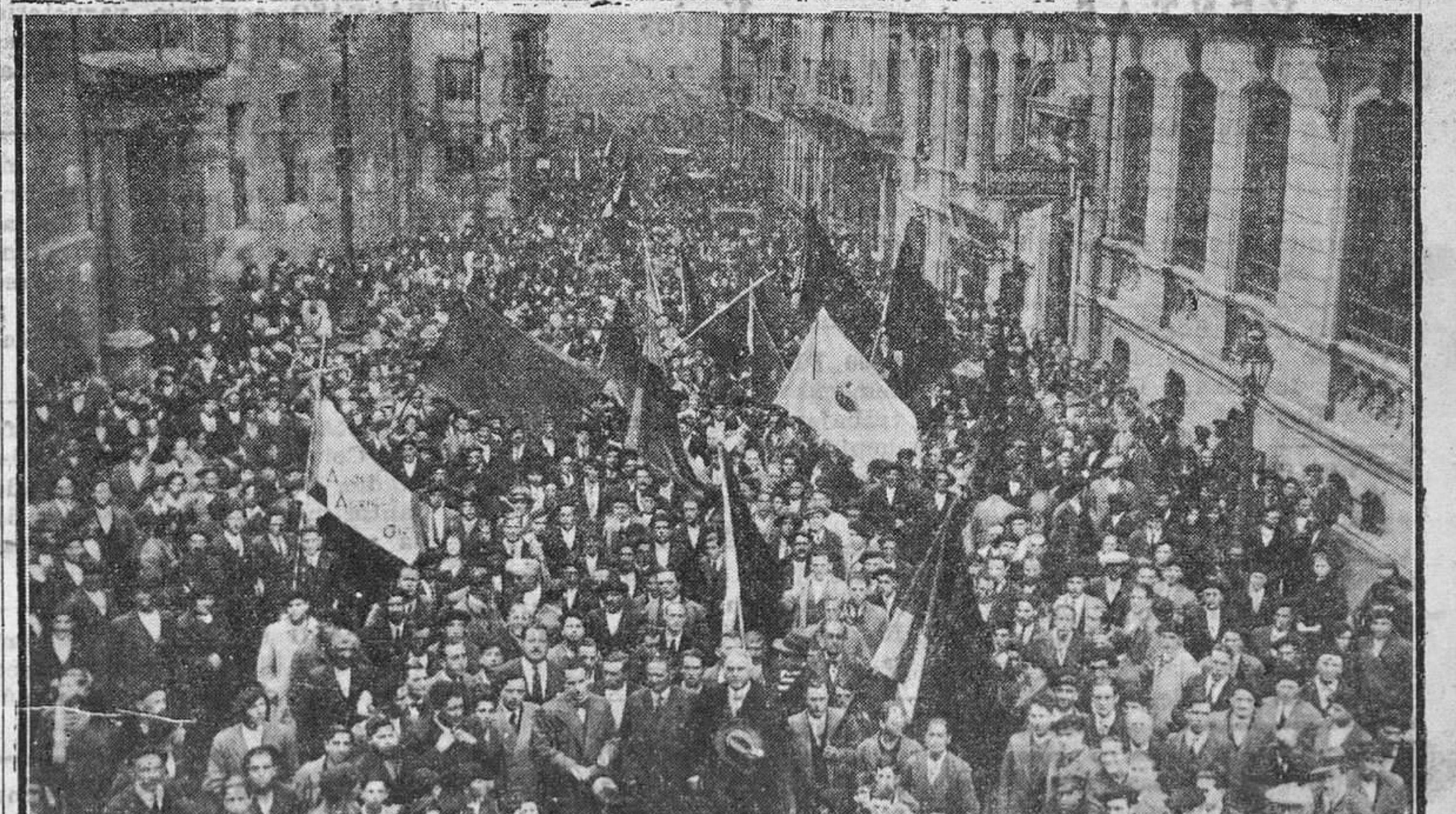
OVIEDO.—Un detalle de la manifestación celebrada el domingo después del mitin celebrado en el Teatro Campoamor