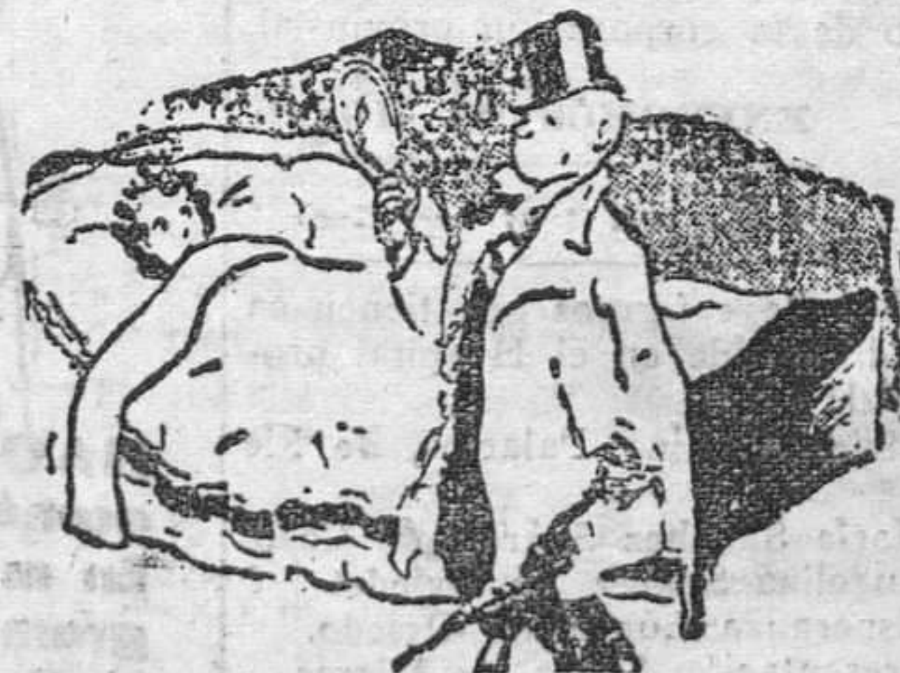
—¿Para qué te miras al espejo? —Para saber quién soy. (De "The Humorist", Londres).