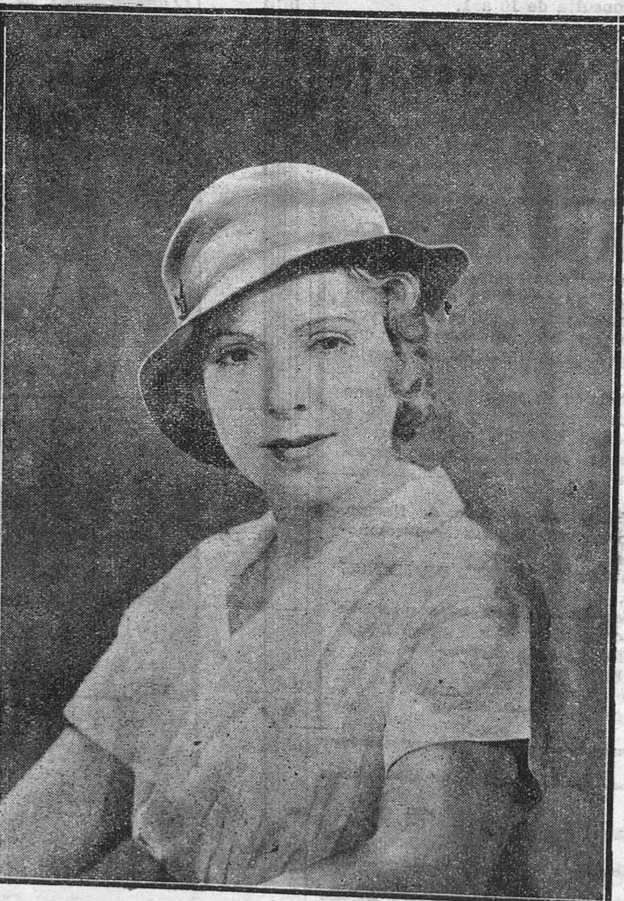
Catalina Bárcena, la exquisita actriz que tantos éxitos granjea en las tablas y cuyo debut en la pantalla en la adaptación cinematográfica de "Mamá" fué el acontecimiento cinematográfico más grande de la pasada temporada, vuelve ahora a deleitarnos con su arte maravilloso en "Primavera en Otoño", adaptación también de la hermosa comedia de Martínez Sierra.