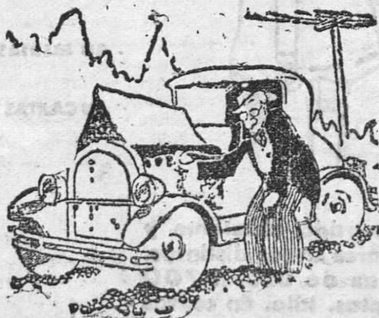
El doctor sufre una "panne". (De "London Opinion", Londres)

Por esta causa sufrieron retraso el expreso que viene de Madrid por la mañana y que no pudo salir de la estación de Oviedo hasta las diez y media, y el rápido de Gijón a Madrid, que quedó detenido en Lugones hasta las diez y treinta y cinco.